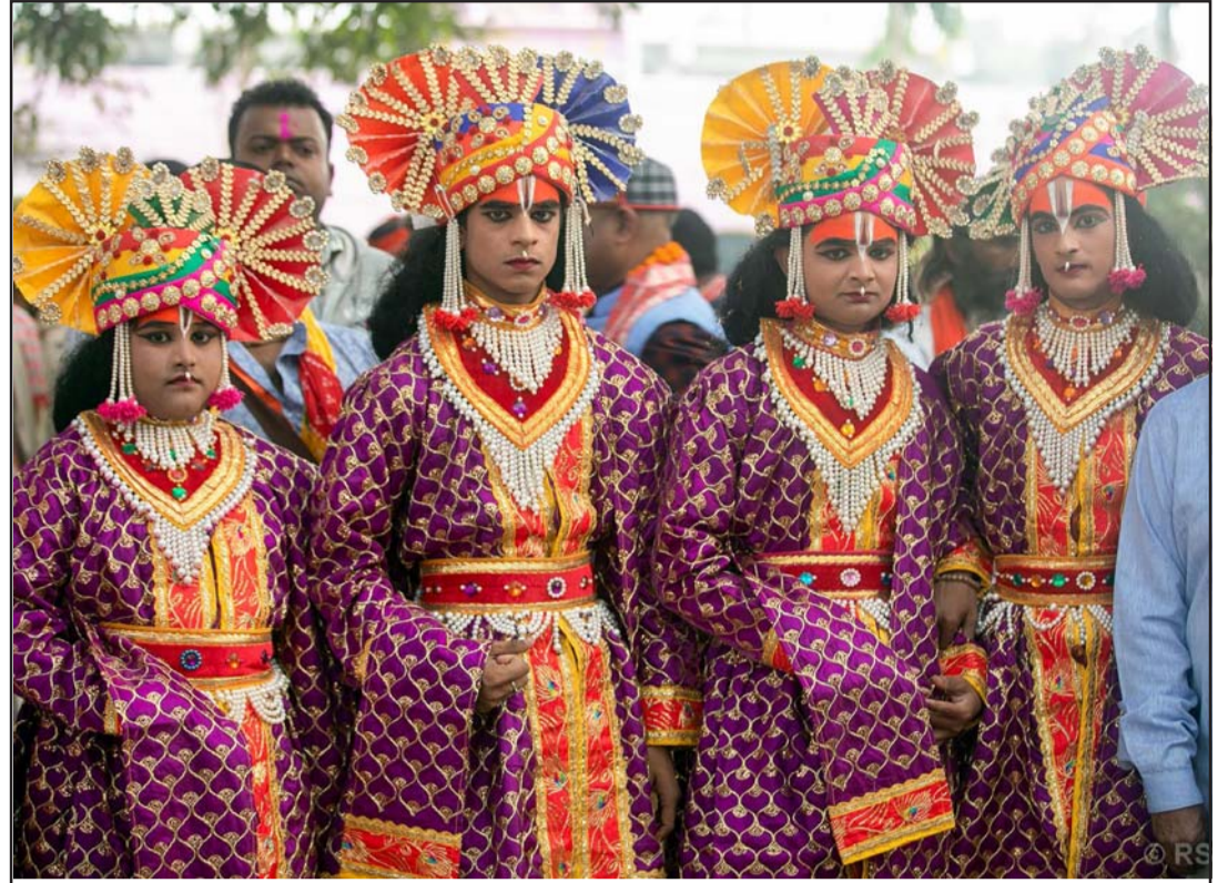
प्रतीकात्मक राम, लक्ष्मण, भरत र शत्रुघ्न: विवाहपञ्चमी महामहोत्सवको अवसरमा भारतको उत्तर प्रदेश अयोध्याबाट प्रतीकात्मकरूपमा आएका मर्यादा पुरुषोत्तम भगवान् श्रीराम, लक्ष्मण, भरत र शत्रुघ्न।

जनवरीमा अमेरिकी राष्ट्रपति-निर्वाचित डोनाल्ड ट्रम्पले पदभार ग्रहण गर्नु अघि रूसी सेनाले पूर्वी मोर्चामा आक्रमण बढाउने र दुवै पक्षले माथिल्लो हात सुरक्षित गर्ने प्रयास गर्दा बहस शुरू भएको छ। रासस