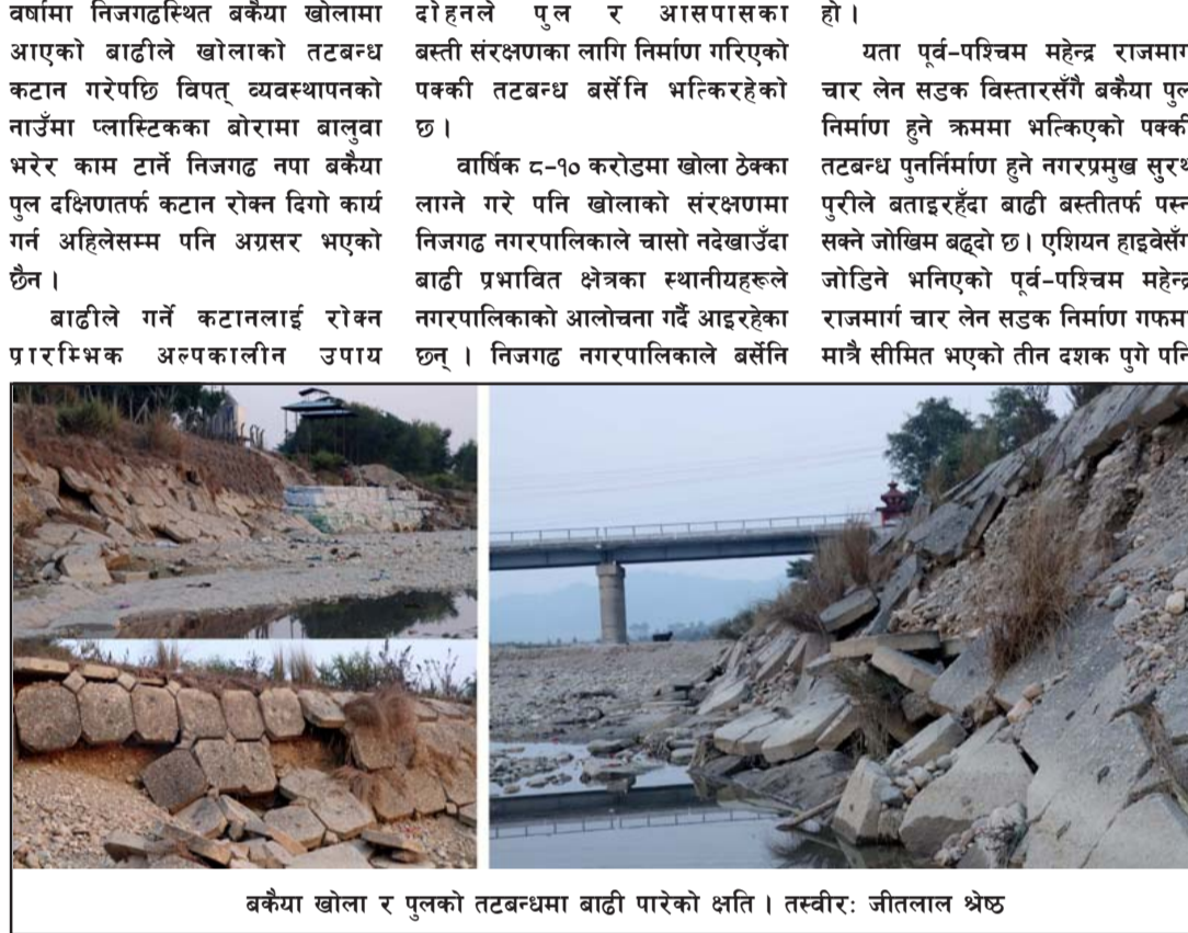
बकैया खोला र पुलको तटबन्धमा बाढी पारेको क्षति ।

गहुँको बीउ छर्दा युरिया, पोटास र डिएपी मल दुई/दुई किलो प्रतिक्वेट्टा प्रयोग हुन्छ भने बीउ छरेको २१ दिन र सिंचाइ गरेको एक सातापछि युरिया मल प्रतिक्वेट्टा तीन/चार किलो प्रयोग गरिन्छ । गहुँबालीको लागि मात्र पनि तीनपटक मल आवश्यक पर्छ । पहिले बीउ छर्दा, त्यसको चार सातापछि र बाला लाग्ने बेलामा मल छरिन्छ । अहिले एक चरणको मल छर्ने कार्य भइरहेको छ । मङ्सिर मसान्तसम्म पहिलो चरणको मल छर्ने काम हुन्छ र त्यसको २१ दिनमा सिंचाइ गरिएको एकसातापछि, अनि तेस्रो चरणमा बाला लाग्ने बखतमा मल छरिन्छ ।