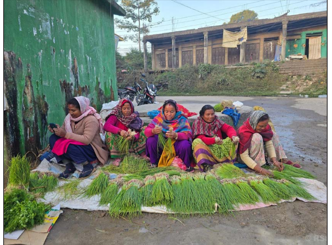
प्याजको बेना: दाङ देउखुरीको लमही नगरपालिका-४ स्थित घोराहीको रझेना चोकमा प्याजको बेना बिक्री गर्न ग्राहक कुट्टे सेमरहवाका स्थानीय महिला ।