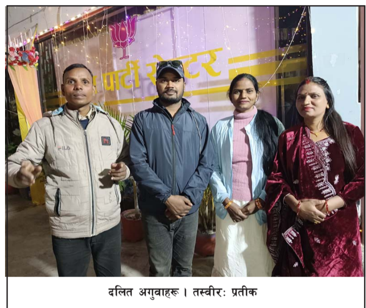
दलित अगुवाहरू।

महानगरमा परेको उजुरीमा सानोपाइलाले बचतकर्ताहरूको ८८ करोड रकम हिनामिना गरेको देखिएको उनले बताए। महानगरपालिकाले सानोपाइलालाई सङ्कटग्रस्त घोषित गरिसकेको छ। सानोपाइलाविरुद्ध पर्सा जिल्ला अदालतमा १३ जनाविरुद्ध यस अघि नै पक्राउ पर्ने जारी भएको र उनीहरूमध्ये केहीले अदालतले तोकेको धरौटीबापतको रकम बुझाएर साधारण तारेखमा छन्।