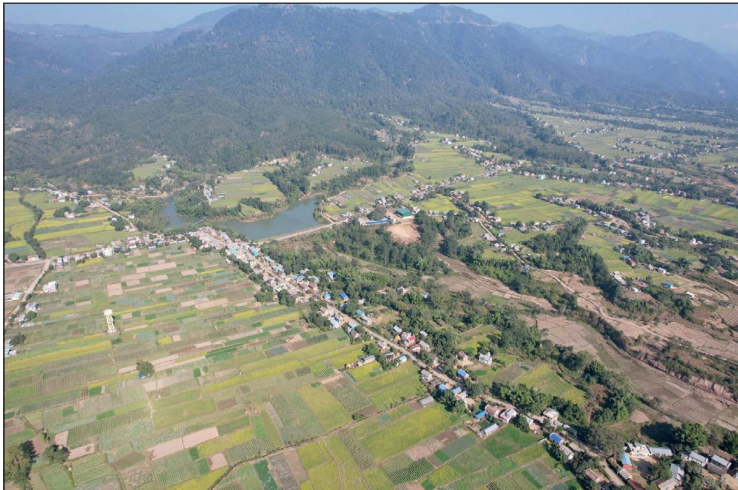
कृत्रिम जलाशयको बरदान: दाङको घोराही उपमहानगरपालिका-२ स्थित सुर्केडागी गाउँमा व्यावसायिकरूपमा गरिएको तरकारीखेती । उपमहानगरले बनाएको कृत्रिम चेपे जलाशयको पानीले गर्दा मौसमी तथा बेमौसमी तरकारीखेतीले हराभरा देखिएको छ । यस गाउँमा थारू, मगर, ब्राह्मण र दलितलगायत दुई सय घरधुरीको बसोबास रहेको छ ।