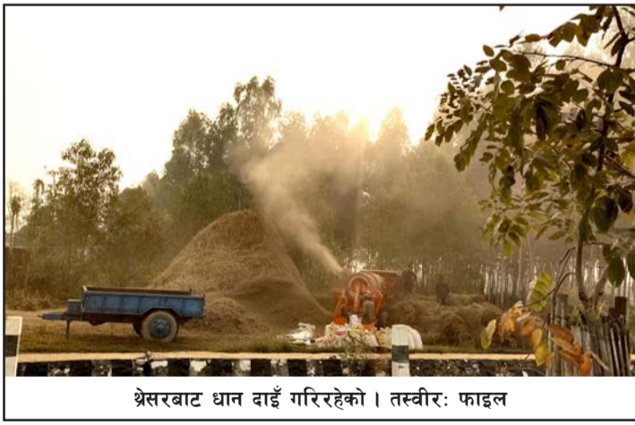
श्रेसरबाट धान दाइँ गरिरहेको।

नकारात्मक प्रभाव पर्नुका साथै जनस्वास्थ्यमा समेत असर परेको छ। श्वासप्रश्वासको समस्या भएका बालबालिका र वृद्ध नागरिकलाई असर गरेको छ। आँखामा धूलो परेर समस्या सिर्जना हुने गरेको पनि छ। तर खेतमै खलो बनाइ दाइँ गर्दा त्यस्तो समस्या हुँदैनथ्यो।" युवाशक्ति विदेश पलायन हुनु, गाउँघरमा गोरु र काम गर्ने मान्छे पाउन