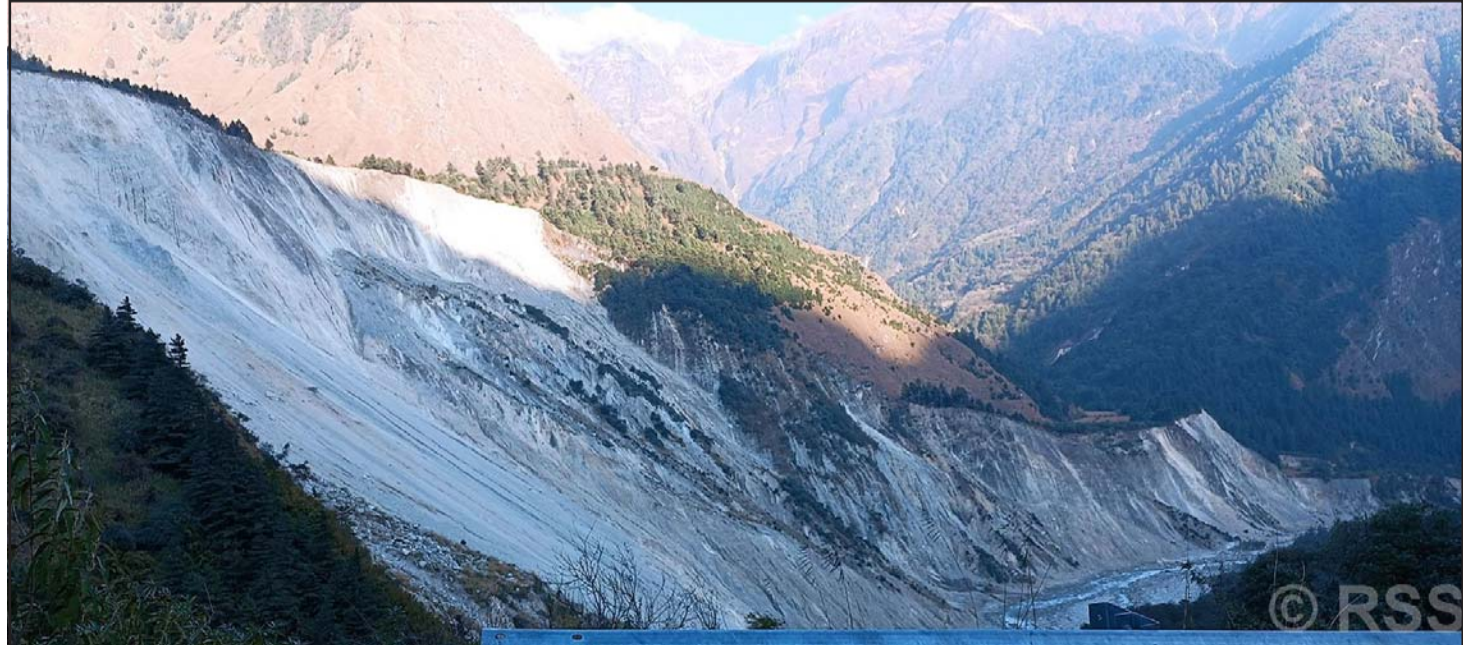
सात वर्षदेखि भूक्षय: मुस्ताङको थासाङ गाउँपालिका-५ झिप्रा-देउरालीमा विगत सात वर्षदेखि निरन्तररूपमा भूक्षय सँगसँगै धूलो उडिरहेँदा बस्ती, कालीगण्डकी नदी किनार र घनावनजङ्ग नसिद्धै।