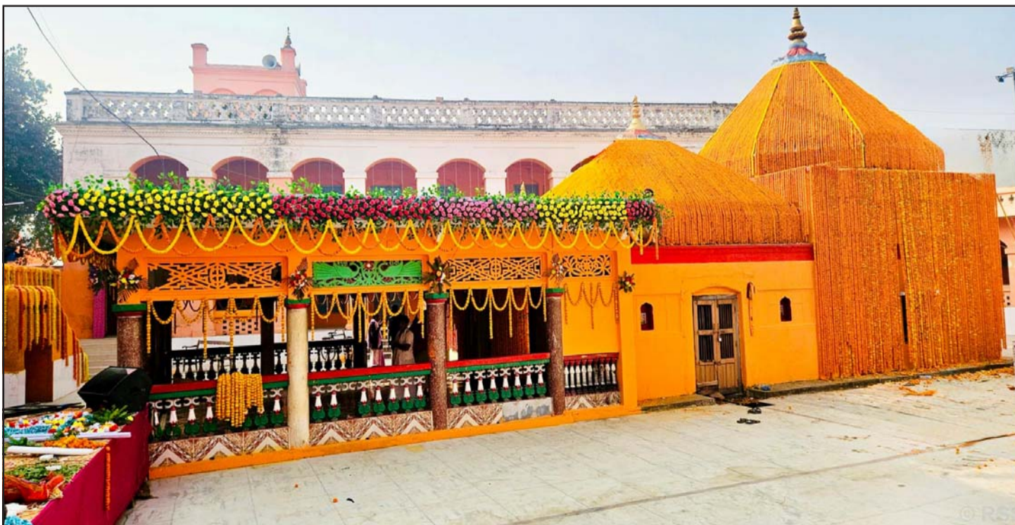
विवाहपञ्चमीमा जन्ती स्वागतको तयारी: भारतको अयोध्याबाट विवाहपञ्चमीका लागि सोमवार आउने जन्तीको स्वागतका लागि फूलमालाले सजाइएको महोत्तरीको मटिहानीमा रहेको प्रसिद्ध लक्ष्मीनारायण मन्दिर (मठ)।