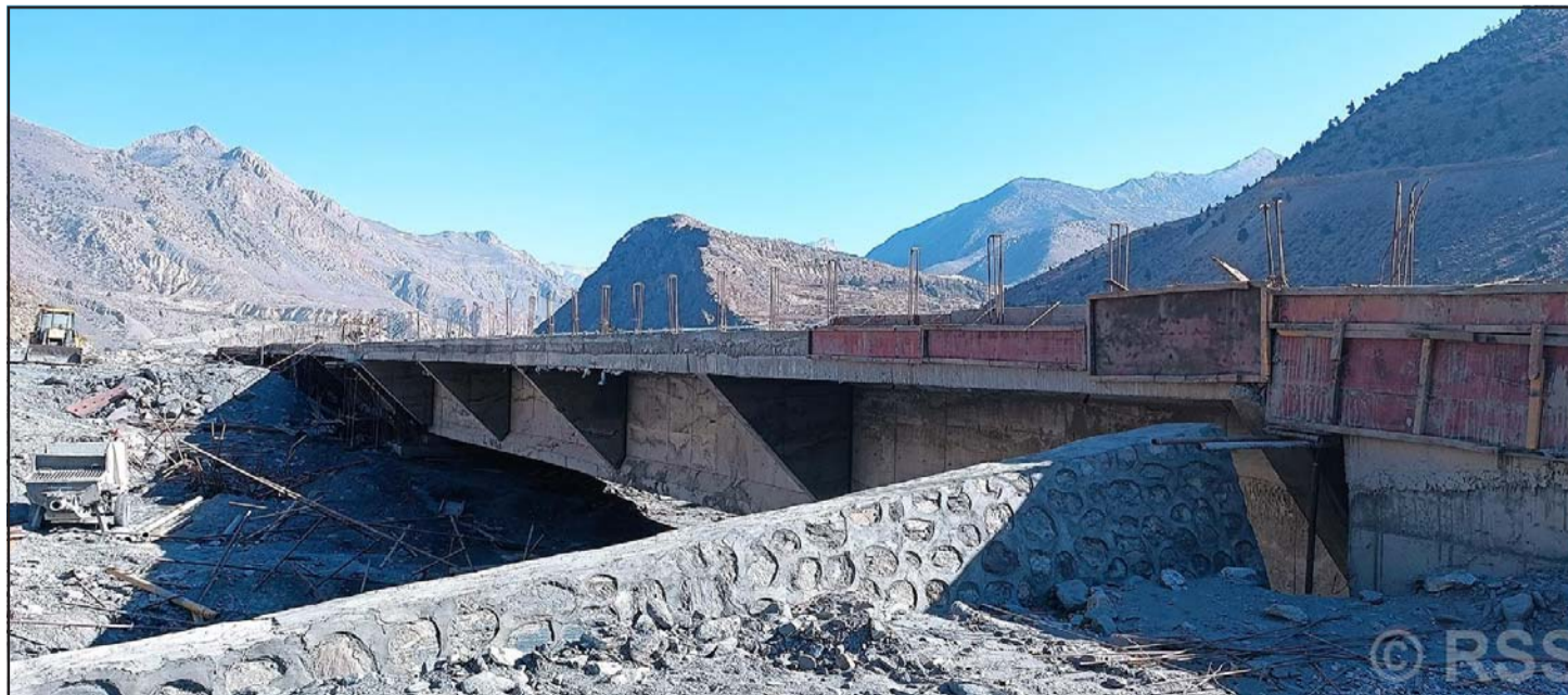
निर्माणाधीन पक्की मोटरेवल पुल: मुस्ताङको घरपझोड गाउँपालिका-२ मार्फा खोला अवस्थित निर्माणाधीन पक्की मोटरेवल पुल। ठेकेदार कम्पनीले यही मङ्सिर अन्तिम सातादेखि नै उक्त पुलबाट सवारीसाधन गुड्ने जानकारी गराएको छ।