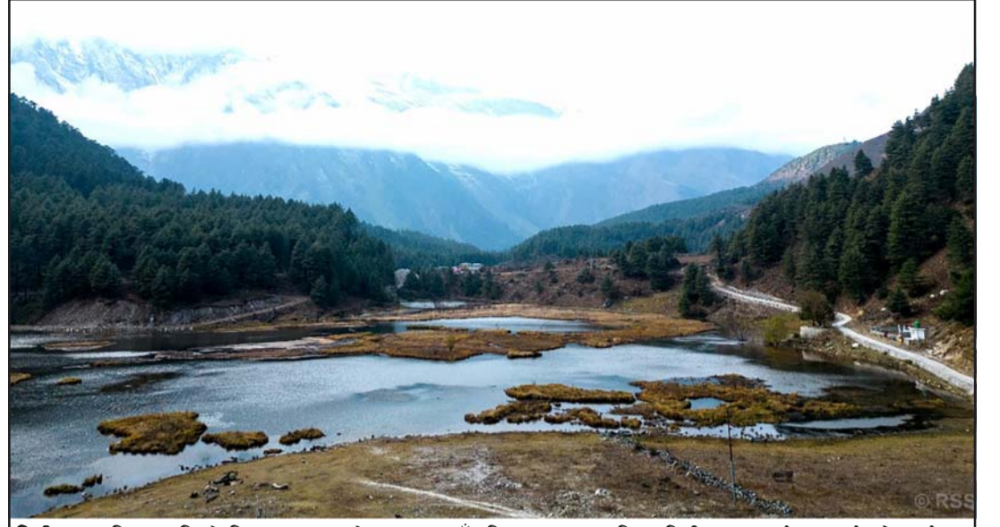
टिटी ताल: हिमालपारिको जिल्ला मुस्ताङको थासाङ गाउँपालिका-५ मा अवस्थित टिटी ताल। पर्यटन प्रवर्द्धनको पर्खाइमा रहेको उक्त ताल सडक सञ्जालदेखि टाढा रहे पनि मुस्ताङ घुम्न आउने आन्तरिक पर्यटक कम मात्रामा यो ताल अवलोकन गर्न आउने गर्छन्।

उनको मुद्दा लामो समयदेखि बाइडेन परिवारको पक्षमा काँडाको रूपमा रहेको छ। विशेषगरी यो चुनावी वर्षको दौरानमा रिपब्लिकनहरूले हन्टरलाई धेरै नरम व्यवहार देखाइएको आरोप लगाएका थिएँ। रासस