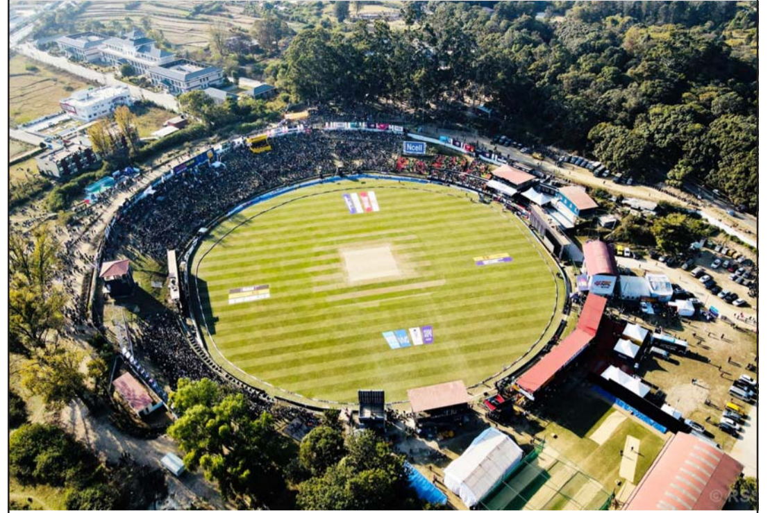
क्रिकेटमय कीर्तिपुर क्रिकेट मैदान: जारी नेपाल प्रिमियर लिग (एनपिएल) क्रिकेट प्रतियोगितामा कर्णाली याक्स र जनकपुर बोल्ट्सबीचको प्रतिस्पर्धाका क्रममा ड्रोनबाट देखिएको कीर्तिपुर क्रिकेट मैदान र दर्शकको दृश्य।

औद्योगिक क्षेत्रको बीचबाटै सार्वजनिक बाटो भएकाले सुरक्षा चुनौती बढेको उनको भनाइ छ। "हामीले पर्खाल लगाउन पटकपटक प्रयास गर्छौं, तर स्थानीयले अवरोध गर्दै आएका छन्," प्रमुख कुँवरले भनिन्।