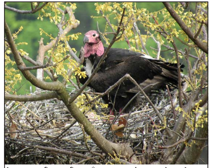
नेपालका चार जिल्लामा गिद्धका गुँड अनुगमन कार्य शुरू भएको छ। नेपालमा पाइने नौ प्रजातिका गिद्धमध्ये सुन गिद्धको गुँड। विश्वमा २३ प्रजातिका गिद्ध पाइन्छन्।

गत वर्षको अनुगमनमा कैलाली, कञ्चनपुर, डडेल्धुरा र बैतडीमा गरी डङ्गर, सानो खैरो, सेतो, हाडखोर,