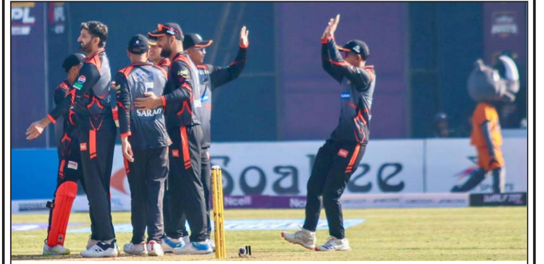
काठमाडौं गुर्खाजका खेलाडीको विकेट लिएपछि खुशियाली साटासाट गर्दै चितवन राइनोज टीम।