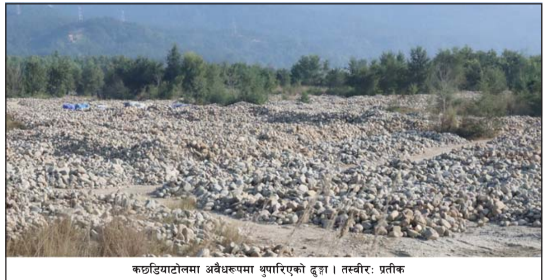
कछडियाटोलमा अवैधरूपमा थुपारिएको ढुङ्गा ।