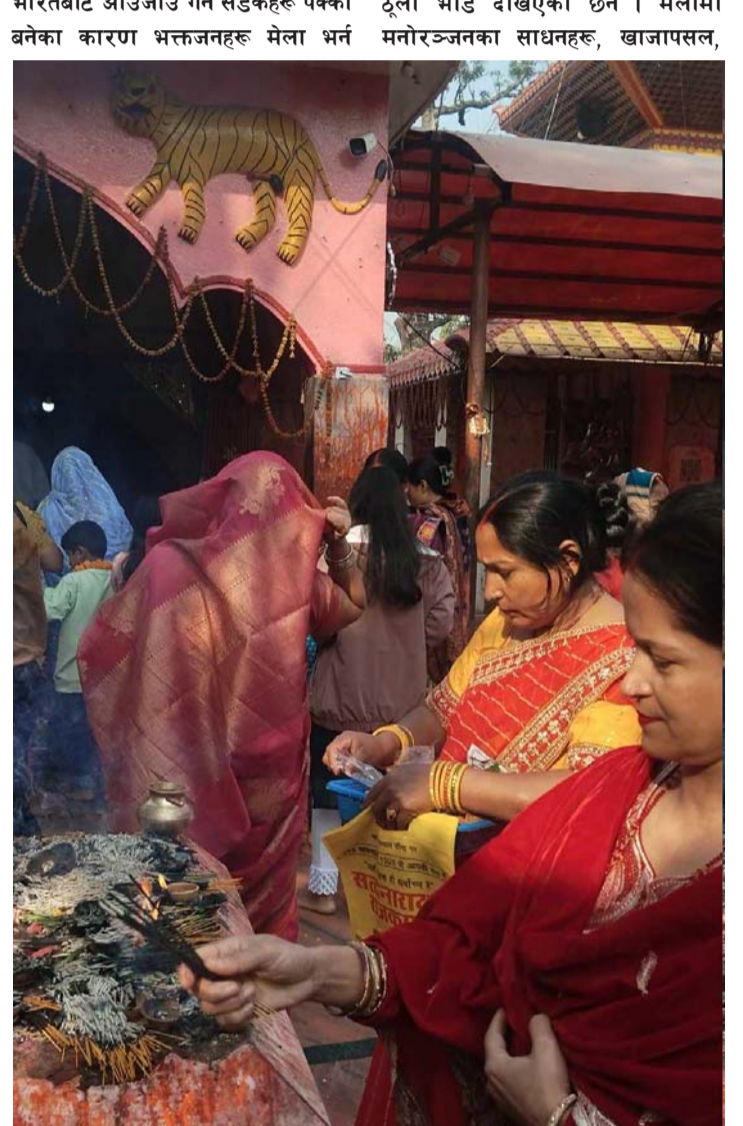
आआफ्नो सवारीसाधनबाट जाने-आउने गर्दैछन्, जसले गर्दा मन्दिरमा पहिले जस्तो होटललगायतका पसलहरू सञ्चालनमा आइसकेका छन्।

यसपटकको गढीमाई मेला यही मङ्सिर १ गतेदेखि शुरू भइसकेको छ भने मुख्य पूजा भोलि मङ्सिर १७ गते सोमवारदेखि हुनेछ। भोलिदेखि मुख्य पूजा शुरू हुने भएकोले आजदेखि नै मन्दिरमा भीड बढ्न थालेको छ। गढीमाई मन्दिरसम्म पसां, रौतहट र छिमेकी