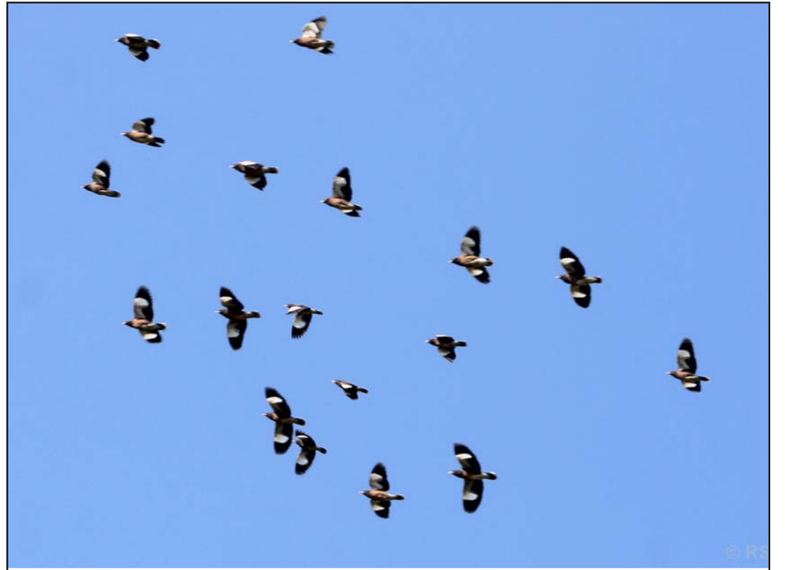
उड्दै गरेको मैना चराको झुन्डः कञ्चनपुरको लालझाडी गाउँपालिकाको कञ्जमा आकाशमा उडिरहेको मैना चराको झुन्ड । सानैदेखि मैना चरीलाई घरमा पालेमा मानिसको जस्तै नक्कल गरेर बोल्ने गर्छ ।

मार्चमा सबैभन्दा बढी एक लाख २८ हजार १६७ र सबैभन्दा कम जुलाईमा ६४ हजार ५९९ पर्यटकले नेपाल भ्रमण गरेका छन् । अक्टोबरमा एक लाख २४ हजार ३९३, अप्रिलमा एक लाख ११ हजार ३७६ पर्यटक आएका तथ्याङ्कमा उल्लेख छ । नोभेम्बरमा एक लाख १४ हजार ५०१, सेप्टेम्बरमा ९६ हजार ३०५, जनवरीमा ७९ हजार एक सय, फेब्रुअरीमा ९७ हजार ४२६, मेमा ९० हजार २११, जूनमा ७६ हजार ७३६ र अगस्तमा ७२ हजार ७१९ पर्यटक नेपाल आएका थिए ।