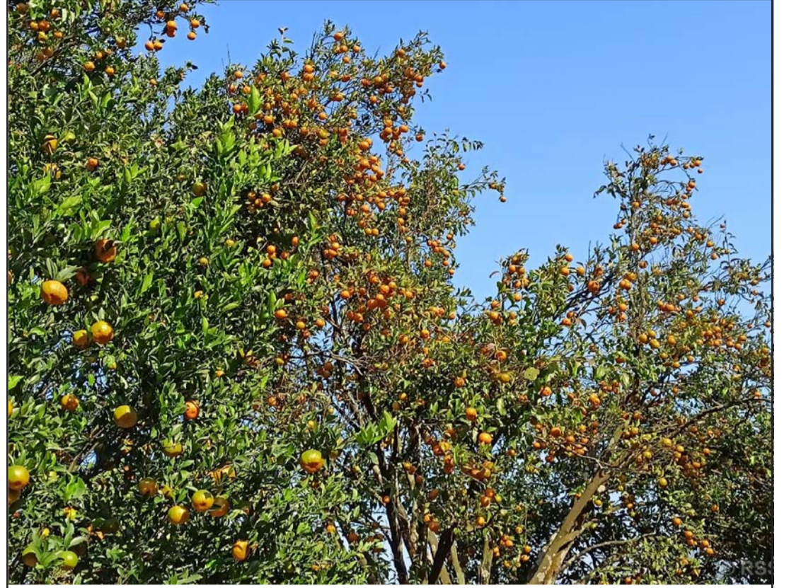
लटरम्म फलेका सुन्तला: सिन्धुलीको गोलन्जोर गाउँपालिका-४ माझकुभिन्डेस्थित एक किसानको घरअगाडि लटरम्म फलेका सुन्तला। यतिबेला यहाँ सुन्तला पाकेर बगैँचा नै पहेंलपुर भएको छ।

बोन्डी र पटेलको नियुक्तिले ट्रम्पले आफ्नो दृष्टिकोण र नीतिगत भुकाव पूरा गर्न इच्छुक निकटस्थहरूलाई नियुक्त गर्ने व्यक्तिहरूको सूचीमा राख्न इच्छुक रहेको सङ्केत गर्दछ। रासस