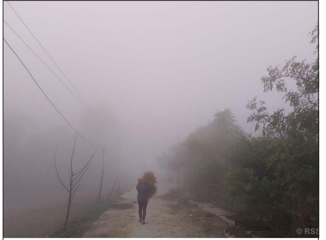
परालको जोहो: महोत्तरी जिल्लाको जलेश्वर नगरपालिका-८ स्थित ग्रामीण सडकमा हुस्सुका बीचमा पराल बोकेर हिंडिरहेका स्थानीय एक किसान।