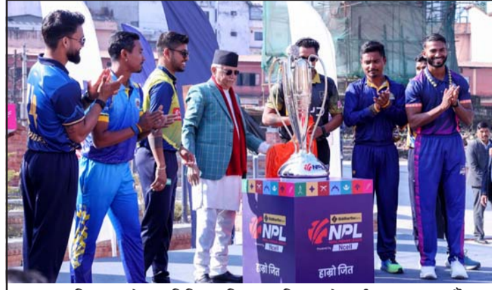
धरहरा परिसरमा नेपाल प्रिमियर लिग (एनपिएल)को ट्रफी अनावरण गर्दै प्रम ओली।

देशको प्रधानमन्त्री भएकाले सात टीममध्ये कुन टीमलाई समर्थन गर्ने भन्नेमा आफू द्विविधामा रहेको बताउँदै उनले सबैलाई शुभेच्छा र शुभकामना दिए।