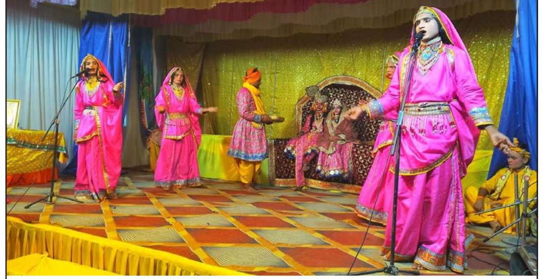
रामलीला मञ्चन: नेपालगंज उपमहानगरपालिका-६ फुलेटामा जारी हडियाबाबा मेलामा बिहीवार राति रामलीला मञ्चन गर्दै कलाकारहरू।

क्रमेण प्रमुखको भ्रमणको क्रममा रणनीतिक साझेदारी सन्धिमा हस्ताक्षर गरेका थिए। यसले दुवै राज्यलाई अर्कोमाथि आक्रमण भएमा सैन्य सहायता प्रदान गर्न र पश्चिमी प्रतिबन्धहरूको विरोध गर्न अन्तर्राष्ट्रिय सहयोग गर्न बाटो खोलेको थियो। विश्लेषकहरूका अनुसार सैनिकहरूको बदलामा रूसले उत्तर कोरियालाई तेल र ग्यास जस्ता अन्य प्राकृतिक स्रोतहरूमा पनि पहुँच दिन सक्छ। उत्तर कोरियाली विदेश मन्त्री जो सोन हुईले हालै मस्कोको भ्रमण गरी आर्मी देश "विजय दिवससम्म रूसी कमरेडहरूसँग दृढतापूर्वक उभिने बताउनु भएको थियो। रासस