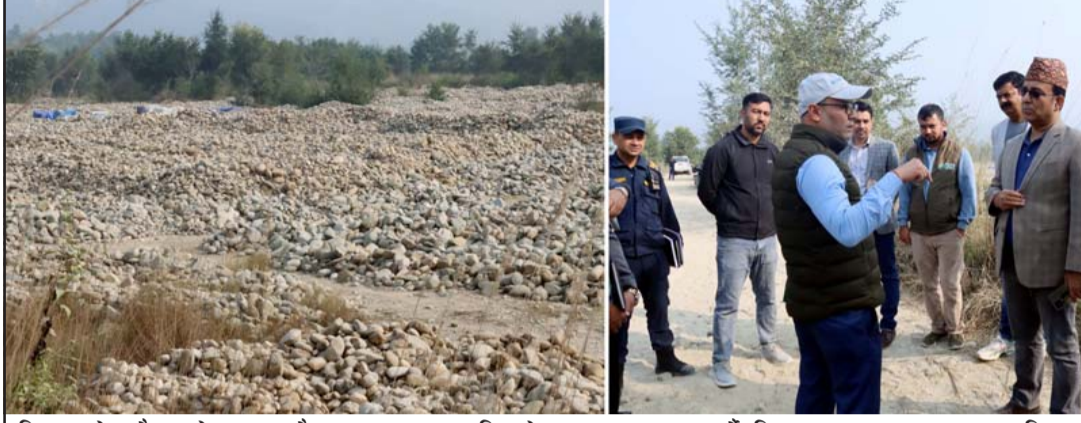
निजगढको बकैया खोलाबाट अवैधरूपमा ल्याइ थुपारिएको स्थानमा अनुगमन गर्दै जिसस बाराका प्रमुख साह, प्रजिअ अधिकारी, डिभिजनल वन अधिकृत झालगायत।

ठेकेदार कम्पनीले कात्तिक २२ गते छठ पर्वपछि खोलामा मापदण्डले तोकेको स्थानमा उत्खनन कार्य शुरू गरेको छ। तर दुई साता पनि नबित्दै दुई हजार