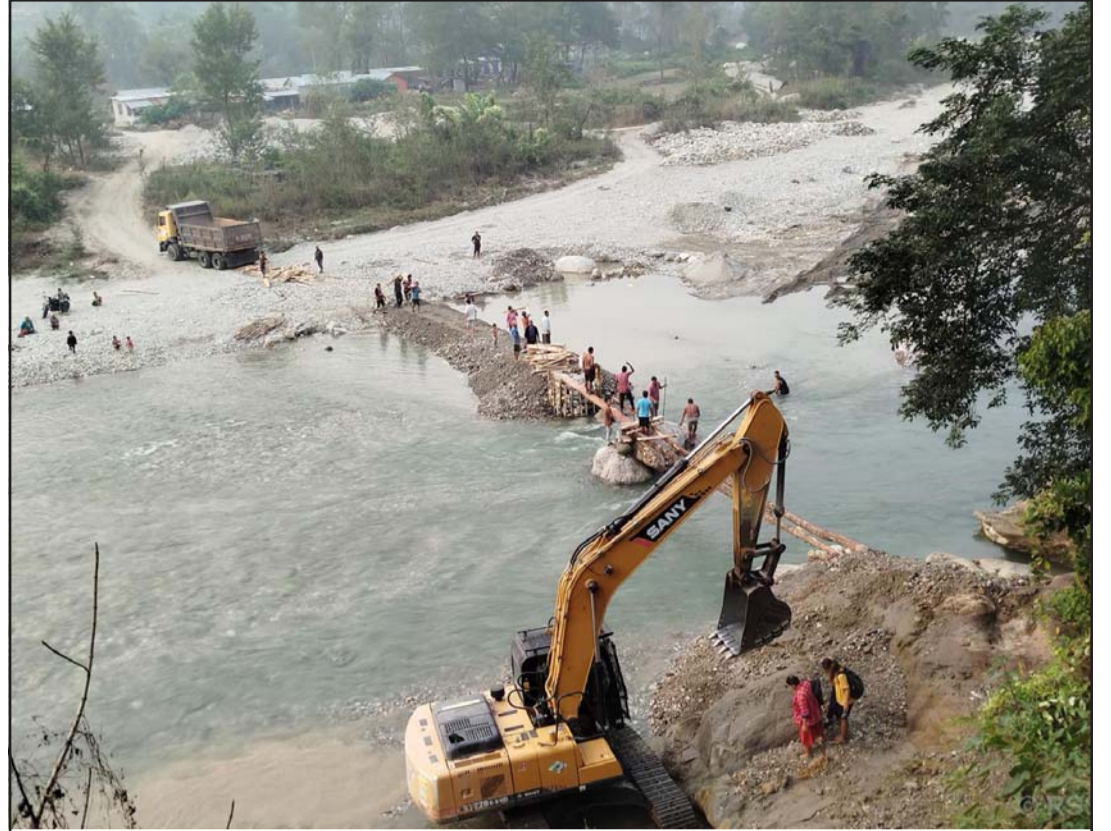
राप्ती खोलामा अस्थायी काठेपुल: मकवानपुरको हेटीडा उपमहानगरपालिका-१ मा बग्ने राप्ती खोलामा काठेपुल बनाउँदै। बर्खापछि लालझाडी, मैनटारका स्थानीयहरू पक्की पुल समयमा नबन्दा यस्तै जोखिम मोल्दै काठेपुलको भरमा आवतजावत

उनीहरूले घोषणापत्रमाफत विश्व अर्थतन्त्रको सुधारिंदो सम्भावनालाई आत्मसात् गर्दै बलियो, दिगो, सन्तुलित र समावेशी विकासका साथ सहज जीवनयापन र वित्तीय दिगोपनको रक्षा गर्ने वाचासमेत गरेका छन्। रासस