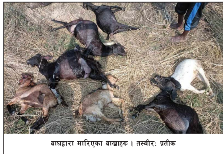
बाघद्वारा मारिएका बाखाहरू।