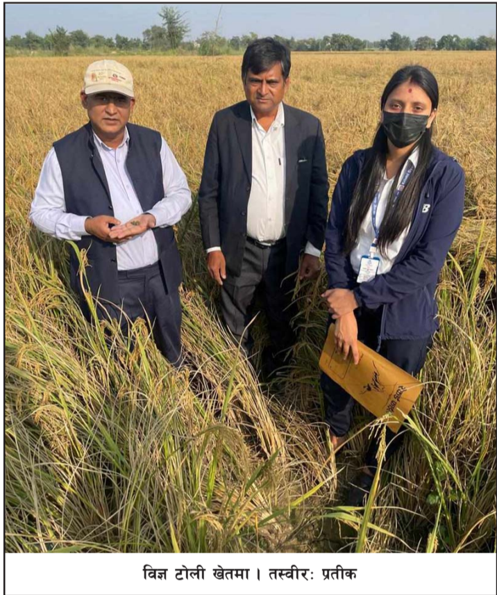
विज्ञ टोली खेतमा।

नहुने गरेको उनको भनाइ छ। यस वर्षको मेलामा मङ्सिर २३ (डिसेम्बर ८)का दिन राँगाको बलि र मङ्सिर २४ (डिसेम्बर ९) गतेका दिन बोकालगायत पशुबलिको मिति निर्धारण गरिएको छ। पञ्चवर्षीय गढीमाई मेलामा बलि अघि शुरूमा पूजा समारोहमा पञ्चबलि दिने र त्यसपछि मात्र राँगा अनि बोका लागि मन्दिर क्षेत्रमा छुट्टै व्यवस्था हुन