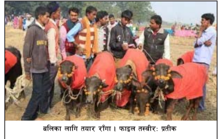
बलिका लागि तयार राँगा।

नसक्दा परम्परागतरूपमा चार किल्लाभित्र जुनसुकै स्थानमा पनि बोकालगायतका पशुको बलि दिन सकिने बताए। यही कारण बोकालगायतका बलिको तथ्याङ्क