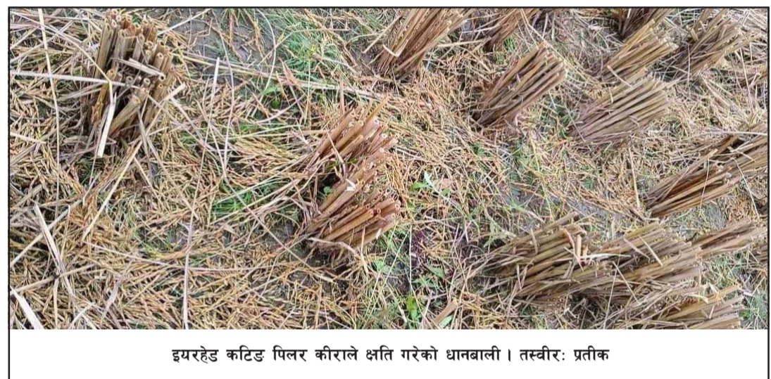
इयरहेड कटिड पिलर कीराले क्षति गरेको धानबाली।

धानबाली काटेर धमाधम भिऱ्याउँदै गरेको बुझिन आएको छ। बालालाई काटेर खेतमा झार्ने गरेकोले ठूलो मात्रामा धानबालीको क्षति भइरहेको स्थानीय किसानहरू बताउँछन्। कीरा नलागेको