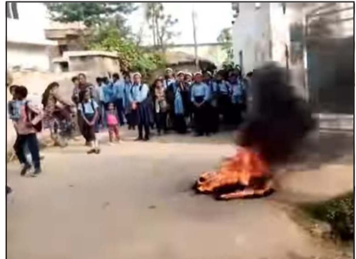
टायर बालेर विरोध गर्दै विद्यार्थीहरू।