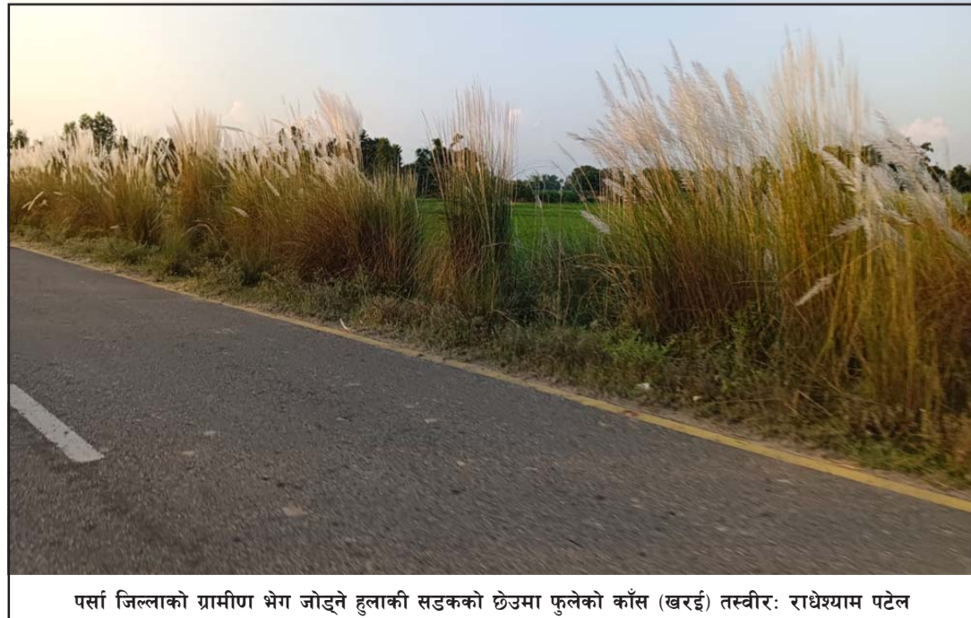
पर्स जिल्लाको ग्रामीण भेग जोड्ने हुलाकी सडकको छेउमा फुलेको काँस (खरई)