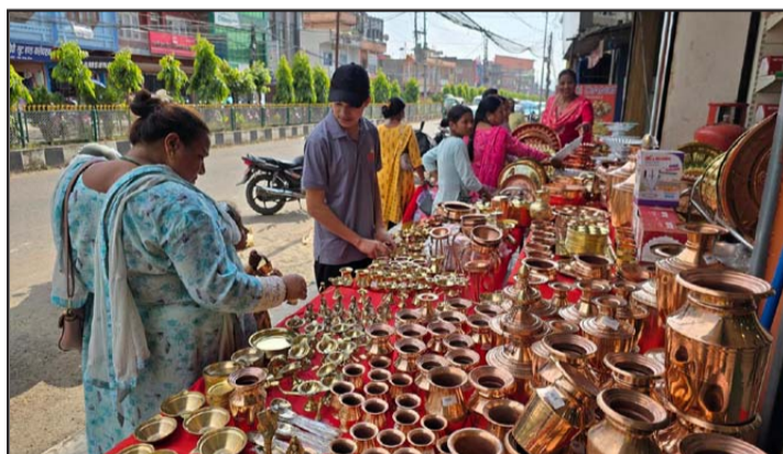
दाङको घोराही उपमहानगरपालिका-१५ स्थित न्यूरोडको भाँडा पसलमा धन्तेर सको दिन मङ्गलवार भाँडाकुँडा किन्दै सर्वसाधारण।

सेवाप्रदायक, ट्राभल एजेन्सी, सञ्चार सेवाप्रदायक तथा होटल रेस्टुरेन्टले दशैंदेखि छठसम्म छुट र उपहारका