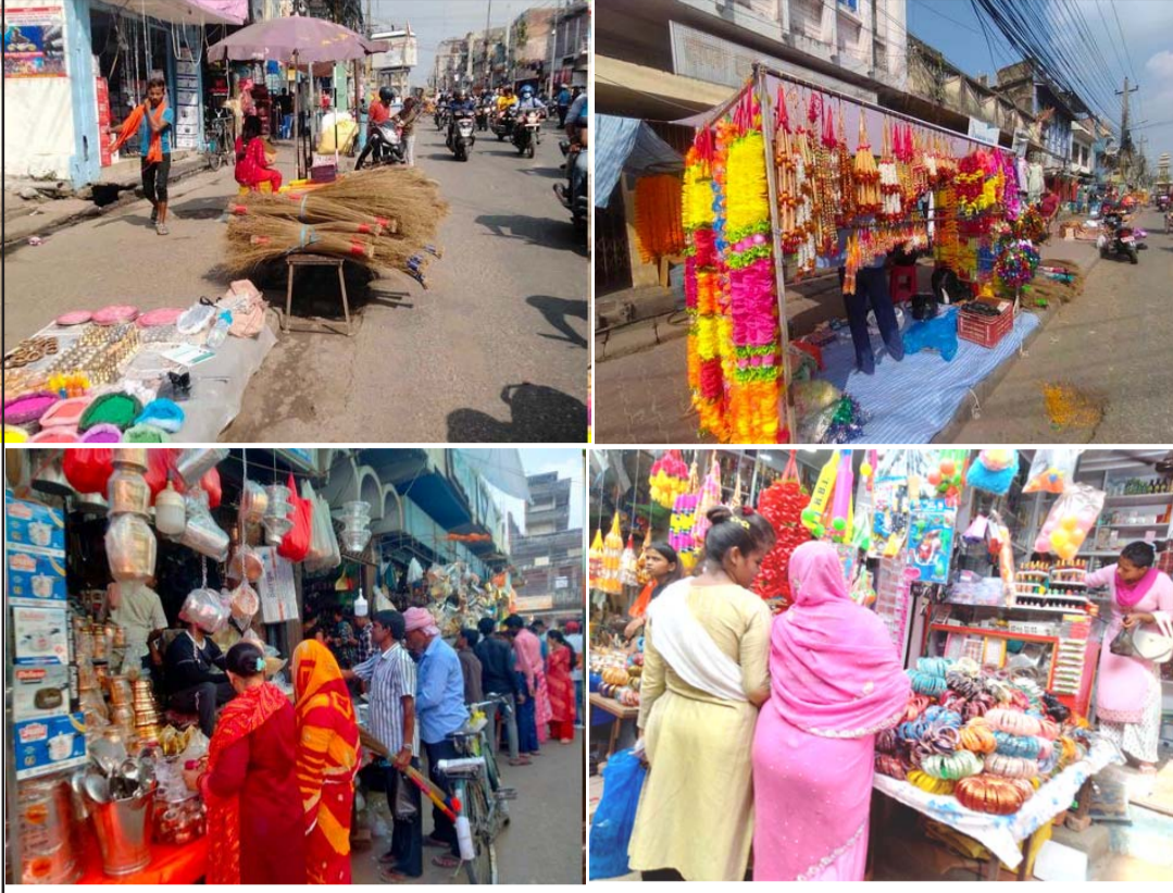
मङ्गलवार र बुधवार धनतेरस परेकोले वीरगंजमा बेज राखिएको सजावट तथा पूजा सामग्रीहरू।