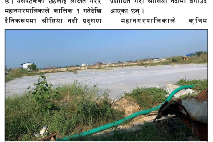
पानी प्रशोधन केन्द्र ।

नियन्त्रणका लागि अभियान शुरू गरेको छ । यो अभियान अन्तर्गत महानगरले आफ्नो क्षेत्र र जीतपुरसिमरा उपमहानगरपालिका अन्तर्गतका क्षेत्रमा पनि अनुगमन शुरू गराएको छ । जीतपुरसिमरा उपमनपासँग यसबीचमा सहकार्य गरेर त्यहाँ र यहाँका उद्योगीहरूको बैठक बसाएर कात्तिक १ गतेदेखि श्रीसिया नदीमा उद्योगका प्रदूषणयुक्त पानी पूर्णरूपमा बन्द गराएको छ । यसकारण श्रीसिया नदीमा अहिले सुधार भएको देखिन्छ । गत वर्षसम्म प्रदूषित रहेको श्रीसिया नदी अहिले ६०