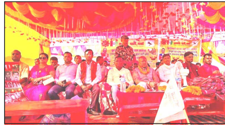
संसारले अलपत्र बनाएको सडक यो सरकारले निर्माण गरेको बताए । विगतको समयमा माछाबजारसँगै

कारण जनमत पार्टी नीति नियम अनुसार अगाडि बढ्दा छोटो समयमा अगाडि बढेको बताए । २०८४ लाई मिसनको