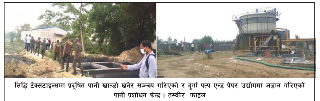
सिद्धि टेक्सटाइल्समा प्रदूषित पानी खाल्डो खनेर सञ्चय गरिएको र दुर्गा पल्प एन्ड पेपर उद्योगमा जडान गरिएको पानी प्रशोधन केन्द्र ।