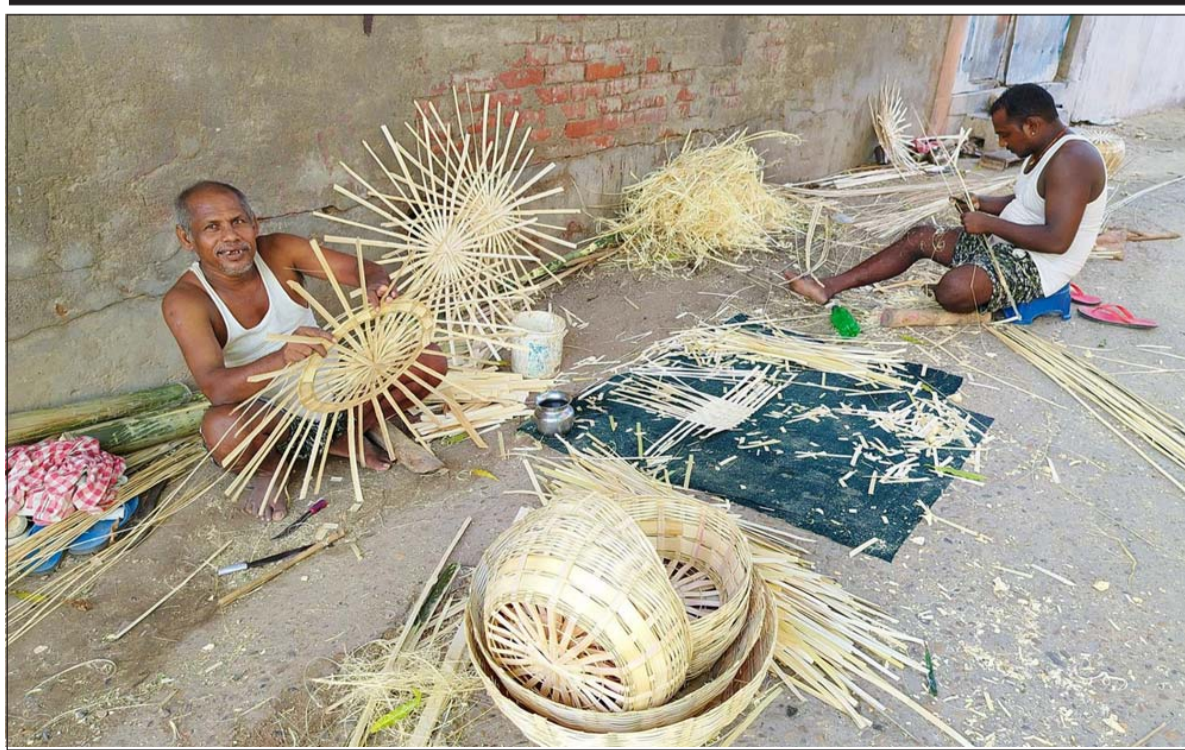
बाँस र बेतका सामग्री बनाउँदै: छठ पर्वलाई लक्षित गर्दै बिक्री गर्न बाँस र बेतबाट विभिन्न सामग्री बनाउँदै महोत्तरी जिल्लाको जलेश्वर नगरपालिका-१ का डोम समुदाय।

राष्ट्रलाई स्थिर सरकार दिन होस् वा आफ्नै स्वार्थका कारण होस्, अहिले एमाले र नेका मिलेर काम गर्न तयार