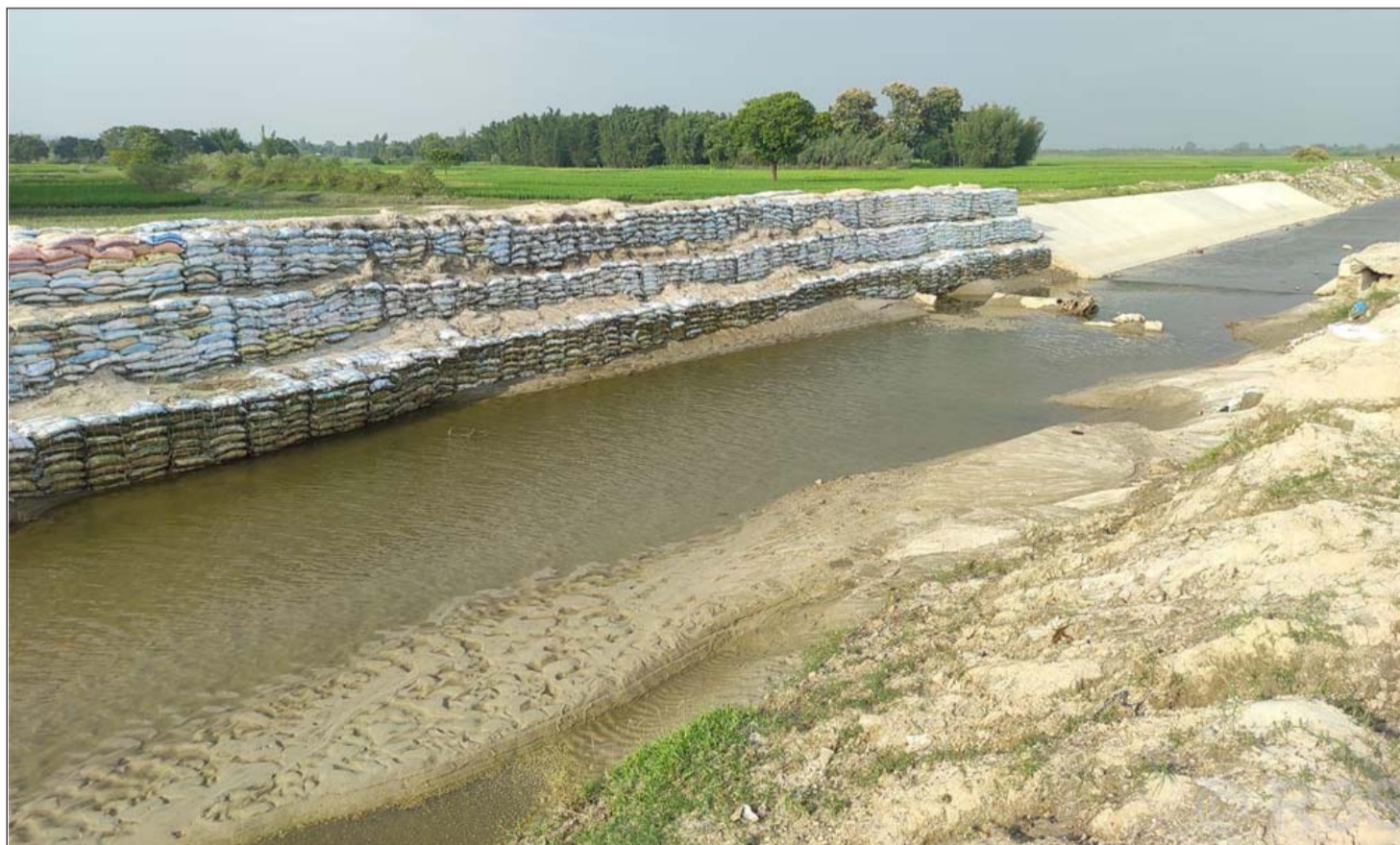
चन्द्रनहरमा अस्थायी तटबन्ध: सप्तरीको तिरहुत गाउँपालिका-१ स्थित बडहरामा बस्तीलाई बाढीको जोखिमबाट बचाउनका लागि देशकै पुरानो चन्द्रनहरमा बोरामा बालुवा राखेर निर्माण गरिएको अस्थायी तटबन्ध।

सम्पर्क: बजार व्यवस्थापक जीतेन्द्र पटेल मोबाइल नं. ९८४५०४७५८. ९८०२७७७५३