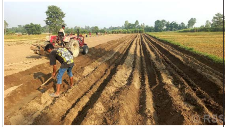
उखु रोप्ने तयारी: बेलौरी नगरपालिका कलकत्ताका किसान उखु रोप्नका लागि खेत तयार गर्दै।

मौद्रिक नीतिमार्फत राष्ट्र बैंकले शैक्षिक प्रमाणपत्र धितो राखेर दिने कर्जा, आर्थिकरूपमा विपन्न, सीमान्तकृत समुदाय तथा लक्षित वर्गका विद्यार्थीलाई उच्च र प्राविधिक तथा व्यावसायिक शिक्षा अध्ययनका लागि उपलब्ध गराइने कर्जा, दलित समुदायलाई व्यवसाय गर्न सामूहिक जमानीमा उपलब्ध गराइनेजस्ता ९ प्रकारको कर्जा विपन्न वर्ग कर्जामा गणना गर्न छुट दिएको छ। उल्लिखित शीर्षकको कर्जामा ५ देखि ६ प्रतिशतसम्म ब्याज अनुदान दिने सरकारको नीति छ। रुग्ण उद्योग, घरेलु तथा साना उद्योग, वैदेशिक रोजगार, दलित, जनजाति, उत्पीडित, महिला, अपाङ्गता भएका व्यक्ति, विपन्न वर्ग तथा समुदायका व्यक्तिद्वारा सञ्चालित साना व्यवसायआदिको प्रवर्द्धन र नियन्त्रणलाई प्रोत्साहन गर्न राष्ट्र बैंकले १ प्रतिशतमा विशेष पुनर्कर्जा प्रदान गर्दै आएको छ। हुनत आर्थिक समृद्धिका लागि मुलुकको सन्तुलित विकास हुनु आवश्यक छ। यसका लागि आर्थिकरूपले पिछडिएका वर्ग, पेशा तथा सम्भावना भएका क्षेत्रलाई सहूलियत ब्याजदरमा पूँजी उपलब्ध गराएर उनीहरूको आर्थिक तथा सामाजिक अवस्थामा सुधार ल्याउनुपर्ने हुन्छ। विपन्न वर्ग कर्जाको प्रभावकारी उपयोगले आन्तरिक उत्पादन, आय र रोजगार बढ्नुका साथै निर्घात र आयातबीचको ठूलो खाडल पुर्ने बाह्य व्यापार घाटा कम गर्न मद्दत पुग्छ। यसका साथै आत्मनिर्भर अर्थतन्त्रको विकासमा ठूलो सहयोग पुग्छ। त्यसैले मुलुकको आर्थिक रूपान्तरणका लागि विपन्न कर्जाको प्रभावकारी कार्यान्वयनमा सरकारको अर्जुन दृष्टि हुनुपर्छ।