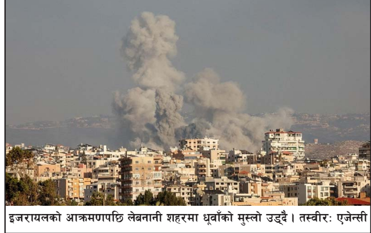
इजरायलको आक्रमणपछि लेबनानी शहरमा धुँवाँको मुस्तो उड्दै।

इजरायली प्रधानमन्त्री बेन्जामिन नेतान्याहले इजरायलले उत्तरमा 'सुरक्षा सन्तुलन' परिवर्तन गर्न काम गरिरहेको बताए। रासस