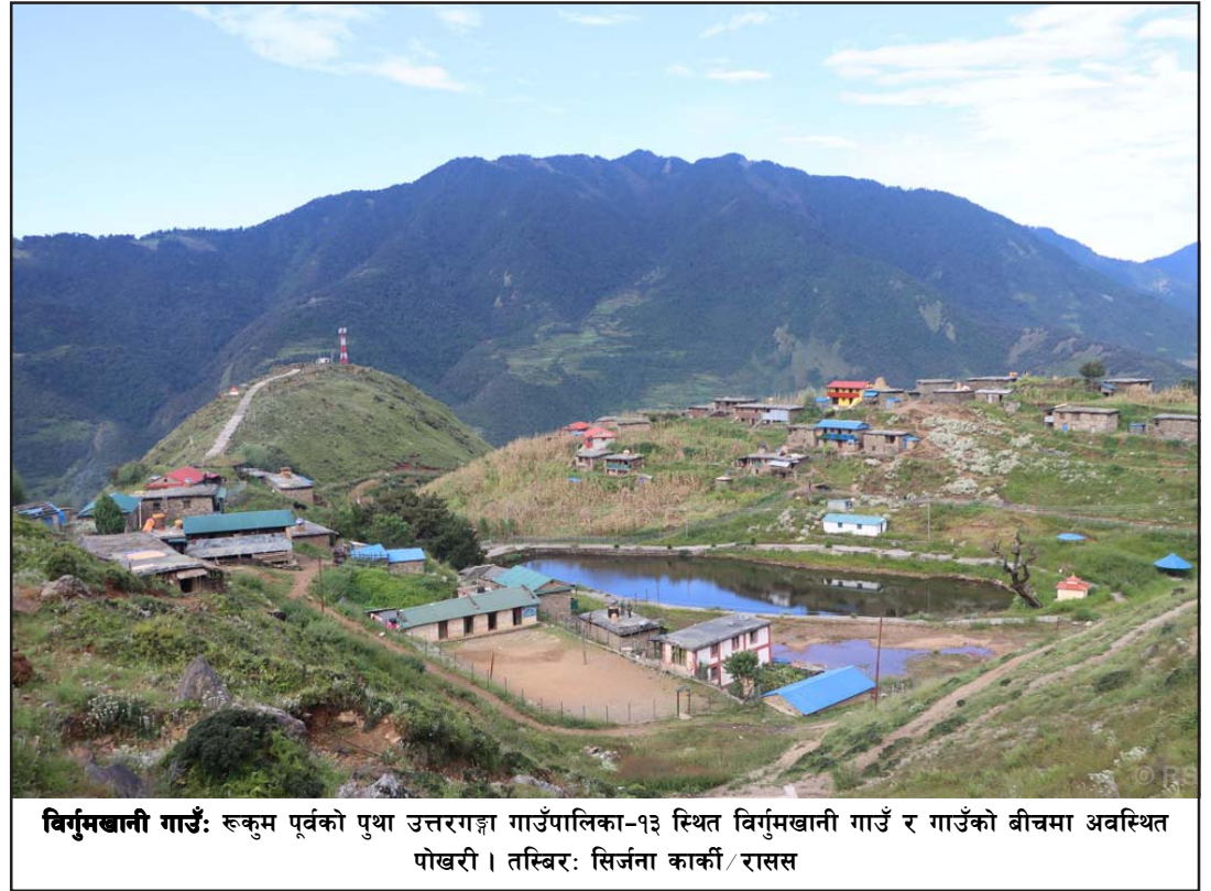
विर्गुमखानी गाउँ: रूकुम पूर्वको पुथा उत्तरगङ्गा गाउँपालिका-१३ स्थित विर्गुमखानी गाउँ र गाउँको बीचमा अवस्थित पोखरी।