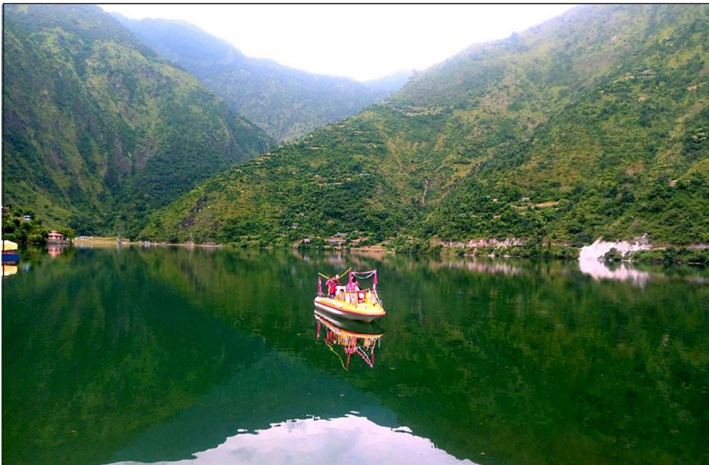
स्वर्ण ताल: रूकुम पश्चिमको बाँफिकोट गाउँपालिका वडा नं ३ र ५ मा पर्ने पर्यटकीयस्थल स्वर्ण ताल। यहाँ असार महीनादेखि असोज महीनासम्म आन्तरिक पर्यटकहरूको चहलपहल बढ्ने गर्छ।