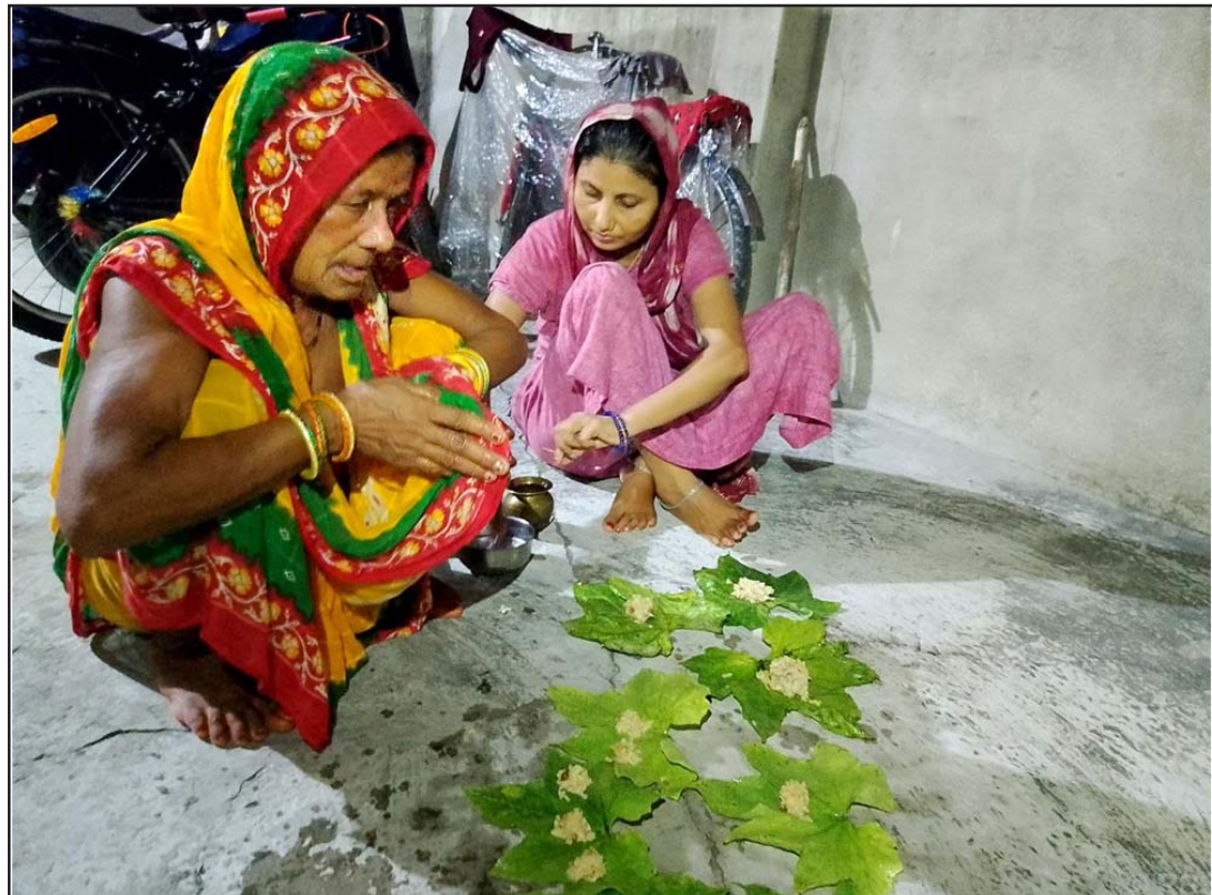
जितिया पर्वमा प्रसाद चढाउँदै: जितिया पर्व अन्तर्गत आज मङ्गलवार बिहान ४ बजेदेखि भोलि बुधवार साँझ सवा ५ बजेसम्म निर्जल निराहार व्रत बस्नु अघि जलेश्वर नगरपालिका-८ बजराही गाउँका व्रताल महिलाहरू भगवान् जितुवाहनलाई आँगनमा घिरोलाको पातमा दही, चिउरा, सख्खर मिश्रित प्रसाद चढाउँदै। यही प्रसाद खाएर ३६ घण्टासम्म महिलाहरू जितिया व्रतको उपवास बस्ने गर्छन्।

गहना बनाउने वा अन्य कुनै यस्तै व्यावसायिक काम गर्ने फर्म, कम्पनी वा व्यक्तिले प्रयोग अनुमति लिई मात्र प्रयोग गर्नुपर्ने व्यवस्थाबमोजिम यस कार्यालयबाट बिक्री र प्रयोग अनुमति लिई कारोबार गर्नु/गराउनु हुन अनुरोध गरिन्छ,” जारी सूचनामा भनिएको छ, “ऐनको बर्खिलाप हुनेगरी विनाअनुमति बिक्री वितरण गरेमा, प्रयोग गरेमा, प्रयोग अनुमतिको म्याद नाघेका फर्म, कम्पनी, व्यक्तिलाई कानूनबमोजिम कारबाई गरिनेछ।”