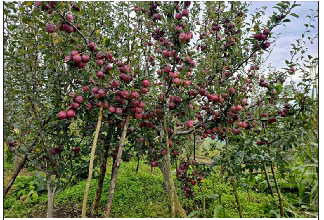
बोटले धान्न नसकेर टेके लगाइएको स्याउको बोट: रोल्पाको सुकीदह गाउँपालिका-३ स्थित मनमारेका किसानको बगैचामा बोटले नै धान्न नसक्ने गरी लटरम्म फलेको स्याउका बोटमा लगाइएको टेको।

“सेनाको मुख्य जिम्मेवारी बङ्गलादेशको सार्वभौमिकता र क्षेत्रीय अखण्डताको रक्षा गर्नु हो”- सेनाका एकजना वरिष्ठ जनरलले सेनाको विस्तारित भूमिकाबारे विस्तृत जानकारी दिए-“तर उनीहरूले राष्ट्र-निर्माण गतिविधि, बङ्गलादेश भित्र र बाहिर प्रकोप व्यवस्थापन र नागरिक शक्तिको सहायतामा आन्तरिक सुरक्षा कर्तव्यहरू पनि पालन गर्छन्।” रासस