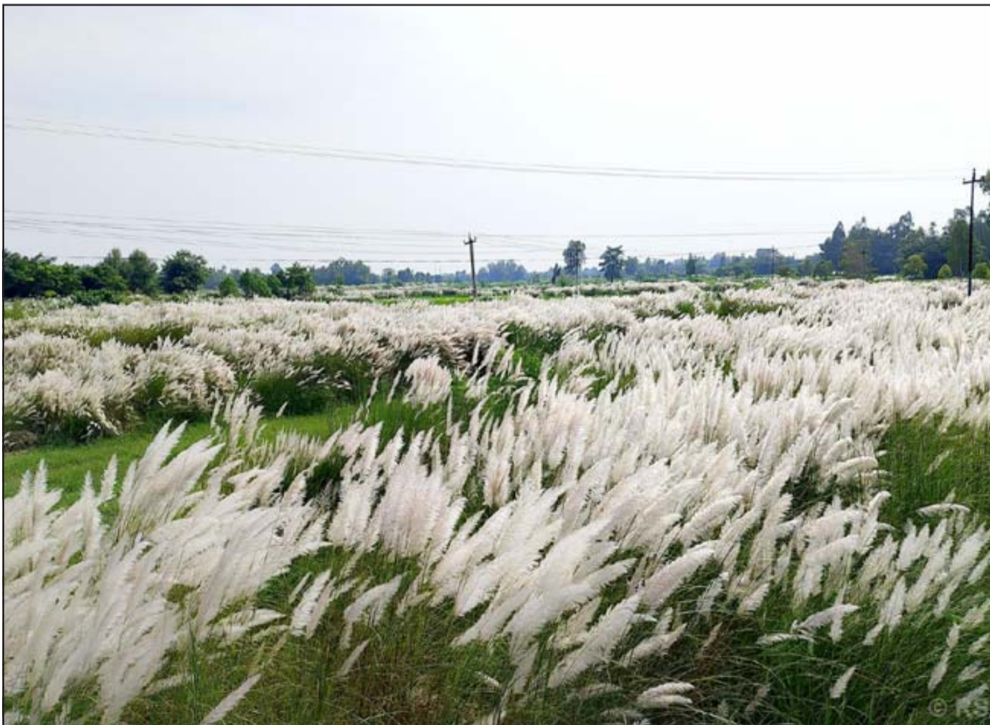
वन काँशः महोत्तरी जिल्लाको जलेश्वर नगरपालिका-६ धबौली गाउँमा फुलेर सेताम्मे बनेको वन काँश (एक प्रकारको खर)।