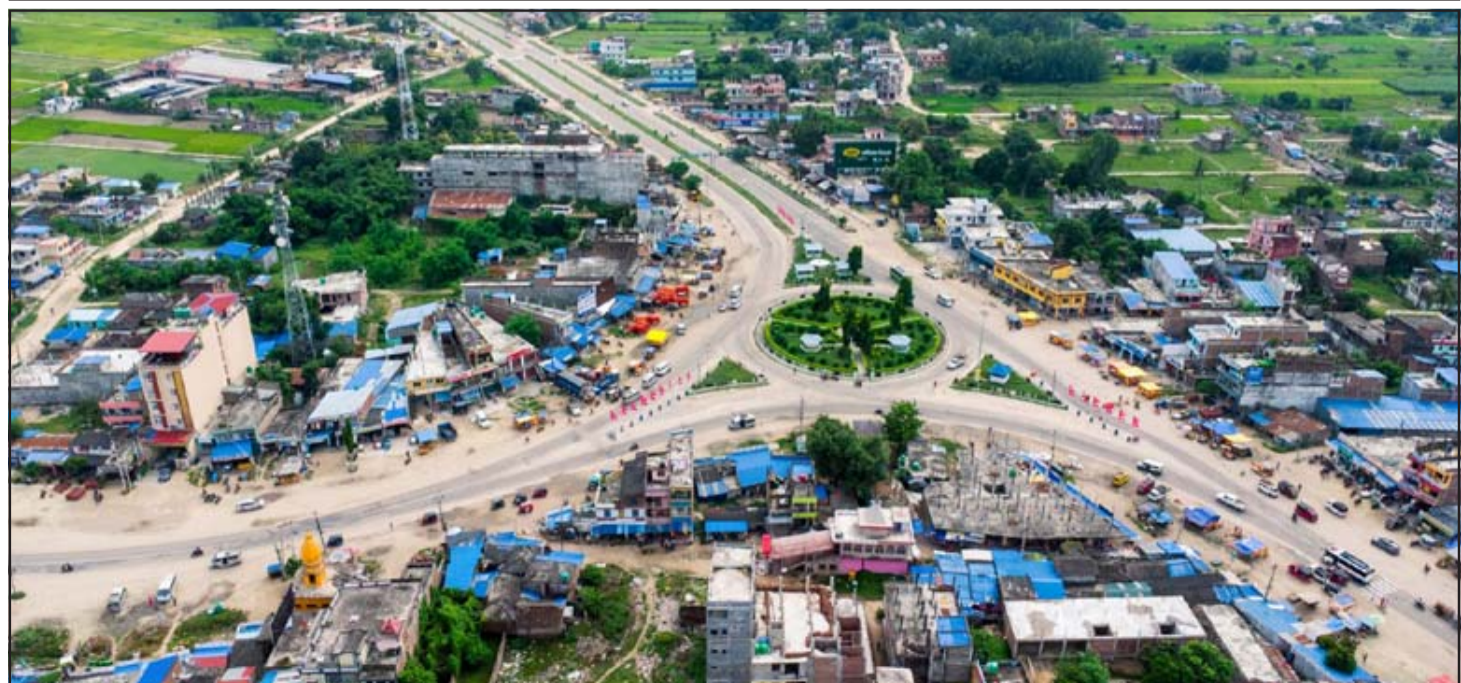
ढल्केबर चोक: पूर्व-पश्चिम राजमार्ग अन्तर्गत धनुषाको ढल्केबर चोकको दृश्य।