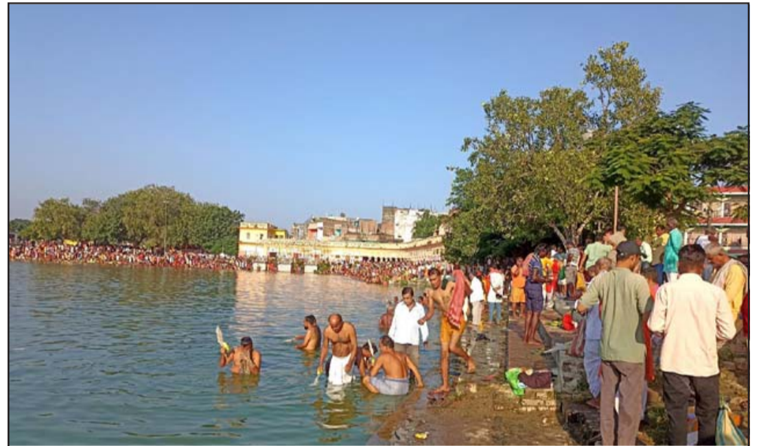
सोह श्राद्धमा गङ्गासागर पोखरी: सोह श्राद्ध अर्थात् पितृ पक्षमा बुधवार जनकपुरधामको गङ्गासागर पोखरीमा दिवङ्गत पितृलाई सम्मानका साथ तर्पण, सिदादान र पिण्डदान गर्नेहरूको घुइँचो।

जम्मू-कश्मीरमा सेप्टेम्बर २५ मा दोस्रो र अक्टोबर १ मा तेस्रो चरणको मतदान हुनेछ। रासस