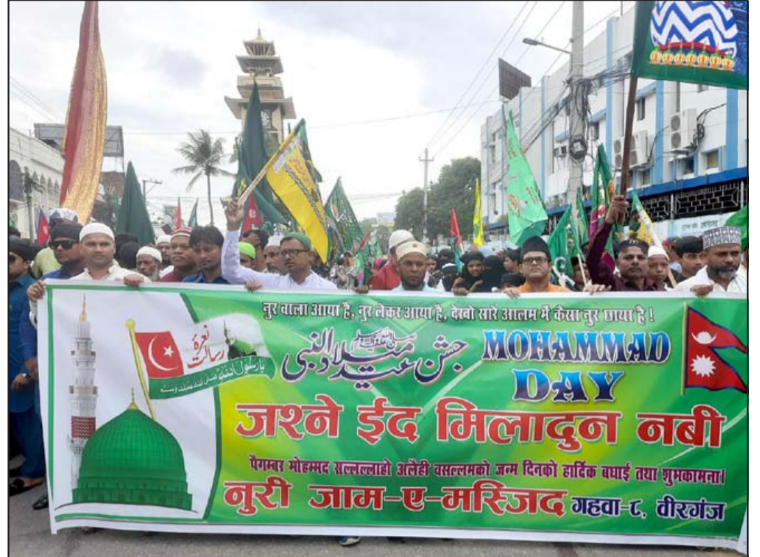
मोहम्मद जयन्तीमा ज्योती : मुस्लिम धर्मका प्रवर्तक पैगम्बर मोहम्मदको जन्मदिनको अवसरमा सोमवार वीरगंजको घण्टाघरमा मुस्लिम समुदायले निकालेको ज्योतीमा सहभागीहरू। मधेश प्रदेश सरकारले आज मोहम्मद जयन्तीका अवसरमा मधेश प्रदेशमा सार्वजनिक बिदा दिएको छ।

धितोपत्र कारोबार सञ्चालन नियमावली, २०७९ को व्यवस्था हेर्दा आजको घटनामा धितोपत्र दलाल व्यवसायीहरूको लापरवाही मात्र नभई