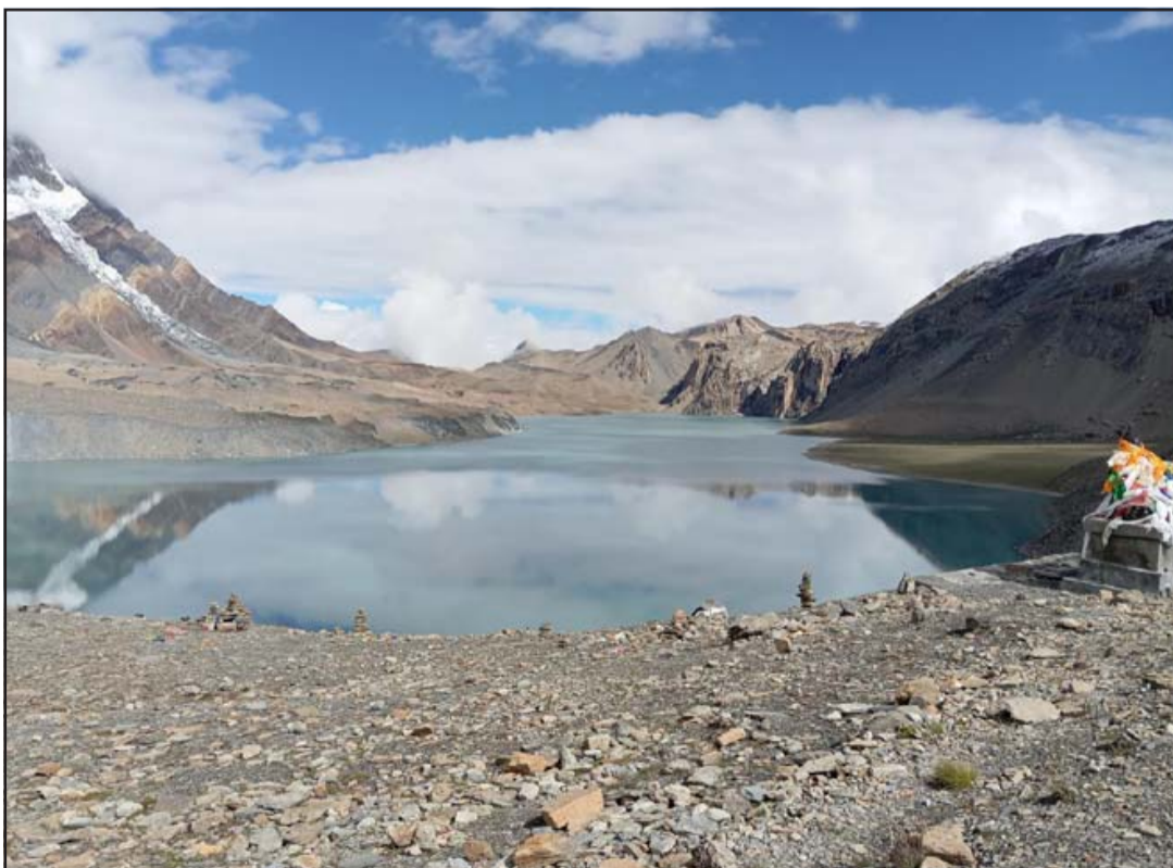
तिलिचोताल : मनाङ डिस्ट्याड गाउँपालिका-९ स्थित तिलिचोताल। विश्वको अग्लो स्थानमा अवस्थित तालहरूमध्येको एक यो ताल समुद्री सतहदेखि चार हजार ९१९ मिटरमा रहेको छ भने चार दशमलव आठ वर्गकिलोमिटर क्षेत्रफल ओगटेको छ।

कारोबार रकमका आधारमा आज सबैभन्दा धेरै सिङ्गिबि हाइड्रोपावर डेभलपमेन्ट कम्पनीको रु ३१ करोड ११ लाख ४९ हजार ७३६ बराबरको कारोबार भएको छ। त्यस्तै, कारोबार भएका शेयर सङ्ख्याका आधारमा भने लक्ष्मी सनराइज बैंक प्रमोटर शेयर पाँच लाख ७७ हजार ७८९ किता खरीद-विक्री भएको छ।