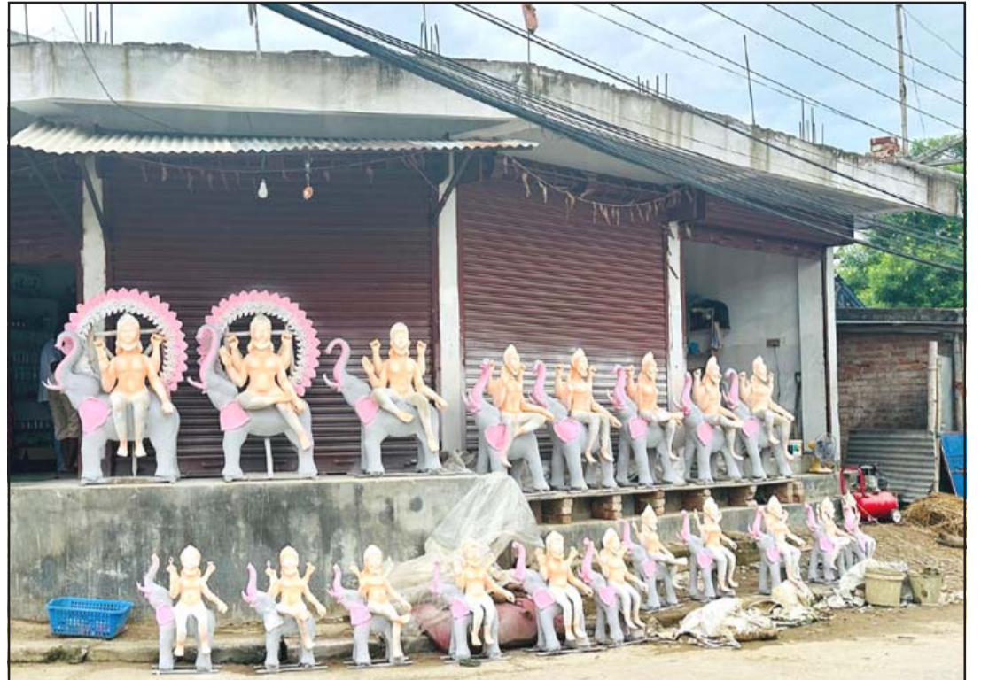
विश्वकर्मा बाबाका मूर्ति : विश्वकर्मा पूजालाई लक्षित गर्दै सिराहाको लहान नगरपालिका-५ मा बिक्रीका लागि राखिएका माटोबाट बनेका विश्वकर्मा बाबाका मूर्तिहरू।

जापान सरकारले आफूना जनसङ्ख्याको हास र वृद्ध जनसङ्ख्यालाई सञ्चालनमा राख्ने प्रयासस्वरूप विभिन्न योजना सार्वजनिक गरेको भएपनि यसले साथकता पाउन सकेको छैन। रासस