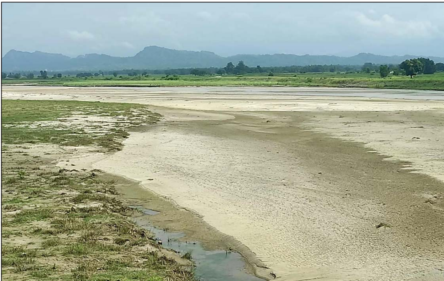
चुरे पहाड र सुक्खा खाँडो नदी : कञ्चनपुर-राजविराज सडकखण्डमा पर्ने सप्तरीको बिरौलस्थित खाँडो पुलबाट उत्तरपट्टि देखिएको चुरे पहाड र पृष्ठभूमिमा सुक्खा खाँडो नदी ।

लिबर्टी इन्जीनी कम्पनी लिमिटेड, हिमालयन हाइड्रोपावर लिमिटेड र मिड सोलु हाइड्रोपावर लिमिटेडको शेयर मूल्यमा आज सकारात्मक सर्किट लागेको