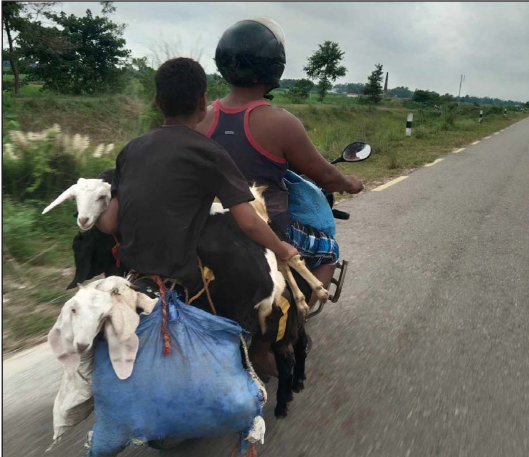
रौतहटको बम नहर सडकखण्डको पोखरिया उमारबाट आठवटा खसी खरीद गरी मोटरसाइकलमा लैजाँदै व्यापारी ।