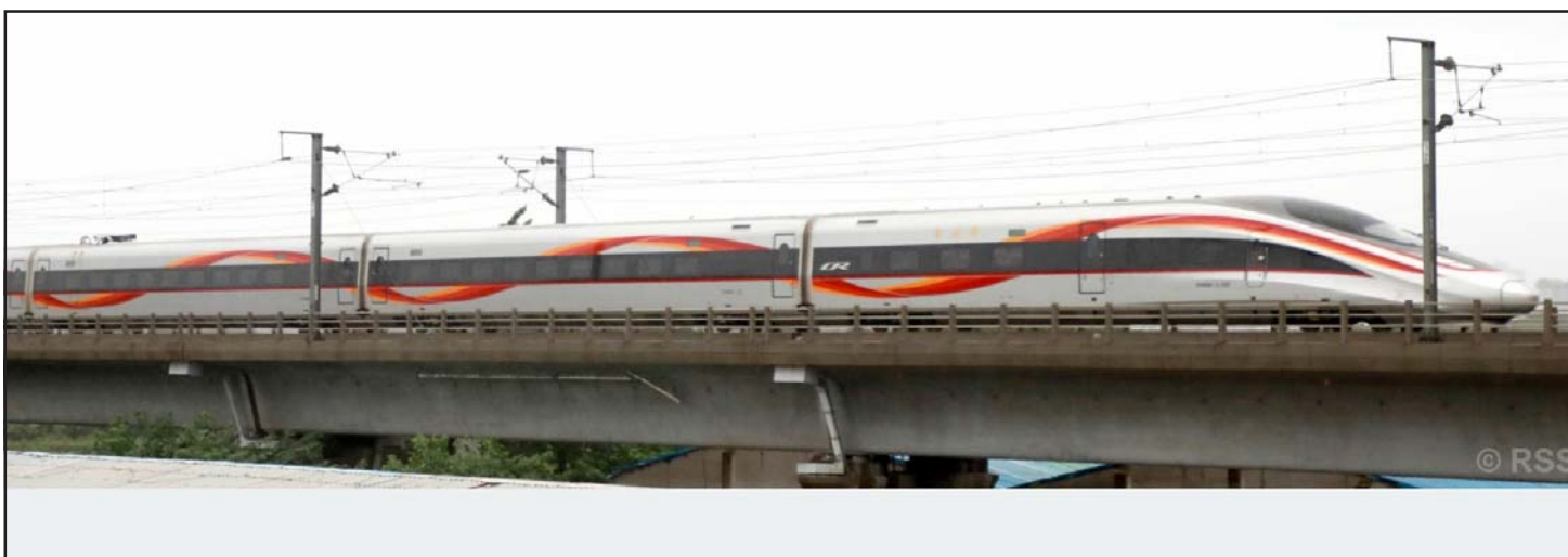
तीव्र गतिमा चल्ने रेल : छिमेकी मित्रराष्ट्र चीनको राजधानी बेइजिङबाट विभिन्न प्रदेशमा जानका लागि तीव्र गतिमा चल्ने हाई स्पीड रेल। प्रतिघण्टा ३५० किलोमिटरसम्म गुड्ने भएकाले लामो दूरीमा जानुपर्ने यात्रुहरू यसै रेलमार्फत आवतजावत गर्ने गर्छन्।