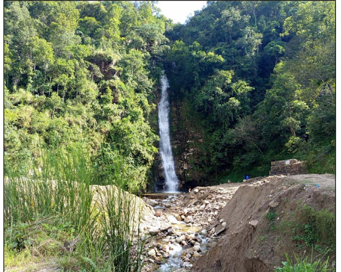
गाईबुरे झरना : लमजुङको बेंसीशहर नगरपालिका वडा नं १ मा अवस्थित गाईबुरे झरना। करीब १५० मिटर उचाइको उक्त झरना पछिल्लो समय आन्तरिक पर्यटकको रोजाइमा पर्ने गरेको छ। झरना जाने बाटो र झरनाको आधार क्षेत्र व्यवस्थित नहुँदा झरनामा मनोरञ्जन लिन आउने पर्यटकलाई सास्ती हुने गरेको छ।

यस क्षेत्रमा टाइफुन तटरेखाको नजीक बनिरहेकोले जलवायु परिवर्तनका कारण भूमिमा लामो समयसम्म टिक्ने गरेको गत महीना जारी गरिएको एक अध्ययनले जनाएको छ।