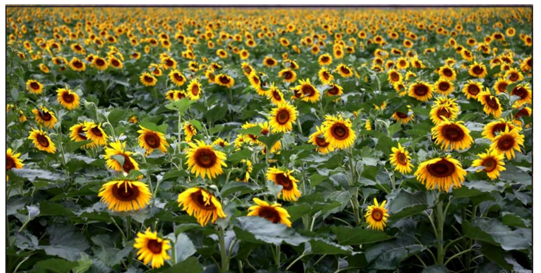
सूर्यमुखी फूल : चीनको ग्रामीण पुनरुत्थान परियोजना टोडफु गाउँ (काउन्टी)का कृषकले खेतमा लगाएको सूर्यमुखी फूल।

जनप्रतिनिधिहरूले सडक डिभिजन कार्यालय र ठेकेदार कम्पनीदेखि विभागीय प्रमुख हुँदै अघिल्लो सरकारका प्रधानमन्त्रीसमेतलाई भेटेर सडक बनाउन ध्यानाकर्षण गराए पनि कतै सुनवाई नभएको गुनासो गरे। अब सडकका लागि छिन्नमस्ताका जनप्रतिनिधिहरू सिंहदरबार पुगेर आन्दोलन गर्ने योजना रहेको अध्यक्ष चौधरीले बताएका छन्।