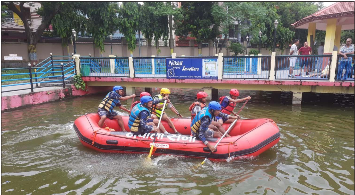
घडीअर्वा पोखरीमा विपत्को अभ्यास : सशस्त्र प्रहरी बल नेपाल १३ नं गण पसाले मङ्गलवार वीरगंजको घडीअर्वा पोखरीमा विपत् र उद्धारको पूर्वतयारीको अभ्यास गर्दै। गणले बिहीवारसम्म विपत् तथा उद्धारसँग सम्बन्धित पूर्वअभ्यास गर्ने जनाएको छ। सो अभ्यासमा नेपाली सेनाको पनि सहभागिता छ।

तारागाउँ रिजेन्सी होटल लिमिटेड, आत्मनिर्भर लघुवित्त वित्तीय संस्था लिमिटेड र दोली पावर कम्पनीको शेयर मूल्यमा सकारात्मक सर्किट लागेको छ भने नेपाल फाइनेन्स लिमिटेडको शेयर मूल्यमा नकारात्मक सर्किट लागेको छ। कारोबार रकमका आधारमा आज सबैभन्दा धेरै हिमालयन रिइन्स्योरेन्स लिमिटेडको र ६५ करोड ४२ लाख नौ हजार ५८२ बराबरको कारोबार भएको छ। कारोबार भएका शेयर सङ्ख्याका आधारमा भने अपि पावर कम्पनी लिमिटेडको १४ लाख ५९ हजार ४५० बराबरको कारोबार भएको छ।