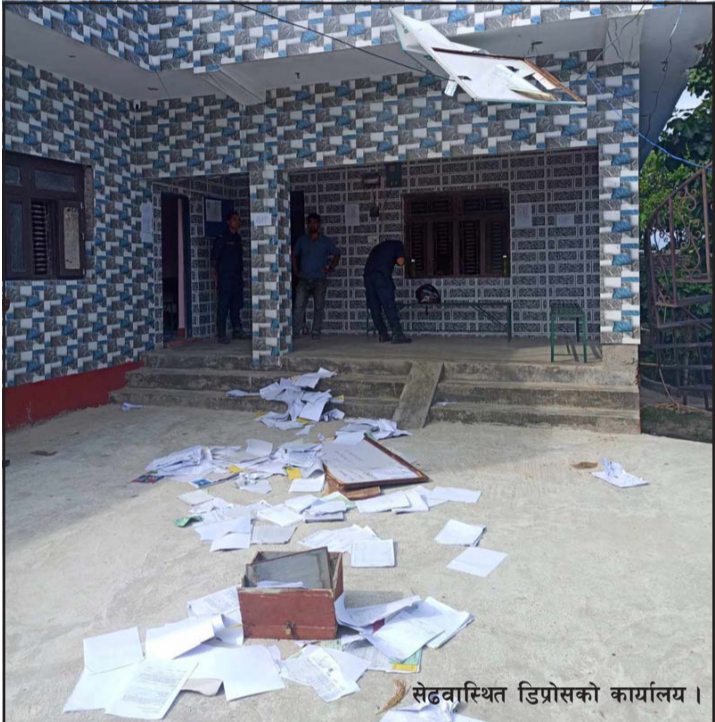
सेढवास्थित डिप्रोसको कार्यालय ।

कार्यालय सहायकमा पनि धेरैजसो दलित छन् । पोखरिया नपामा रहेका दलितहरूमध्ये ९८ प्रतिशत जागीरे रहेका