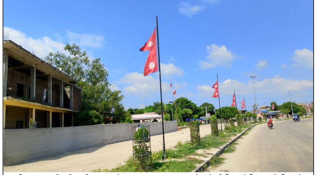
सडकबीचमा फहराइरहेका नेपालको झन्डा : जलेश्वर-जनकपुर सडकखण्ड अन्तर्गत महोत्तरी जिल्लाको पिपरा गाउँपालिका क्षेत्रमा सडकबीचमा फहराइरहेका नेपालको राष्ट्रिय झन्डा। झन्डाले सडक क्षेत्रमा आकर्षण थपेको छ।