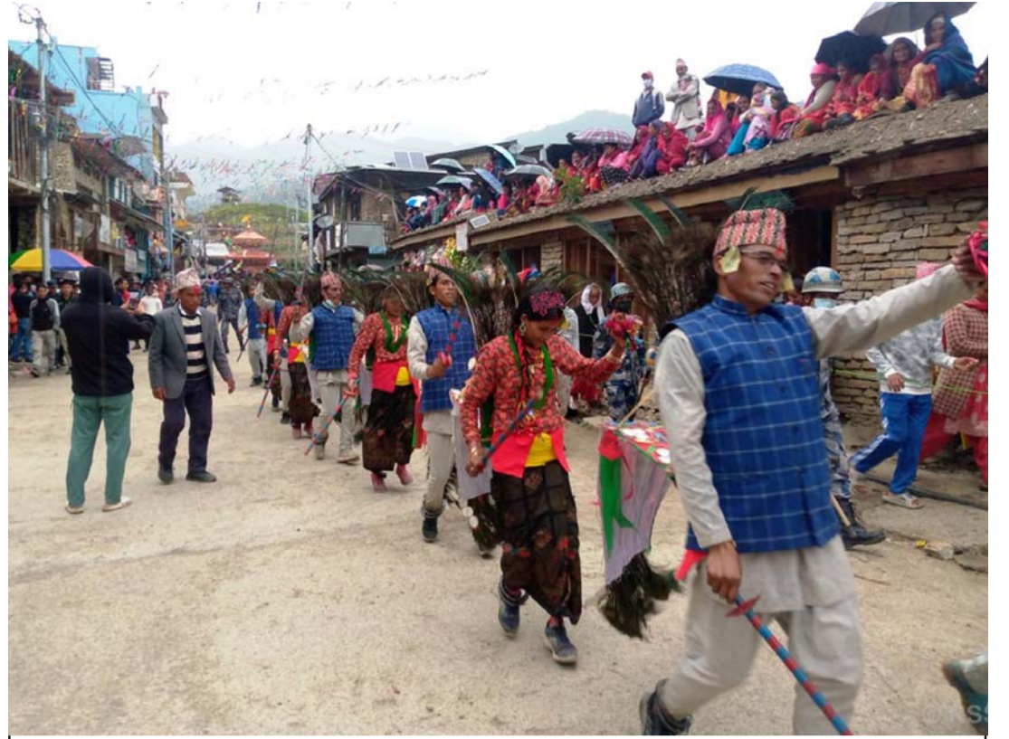
मयूर नाच: जाजरकोटको बारेकोट गाउँपालिकाका स्थानीयवासी जुम्ला सदरमुकाम खलङ्गा बजारमा मयूर नाच देखाउँदै। मयूर नाच जाजरकोटको सांस्कृतिक चिनारीमध्येको एक महत्त्वपूर्ण नाच मानिन्छ।

विक्रमासिङ्ग र प्रेमदासा दुवै एउटै विचारधारासँग जोडिएका व्यक्ति हुन्। रासस