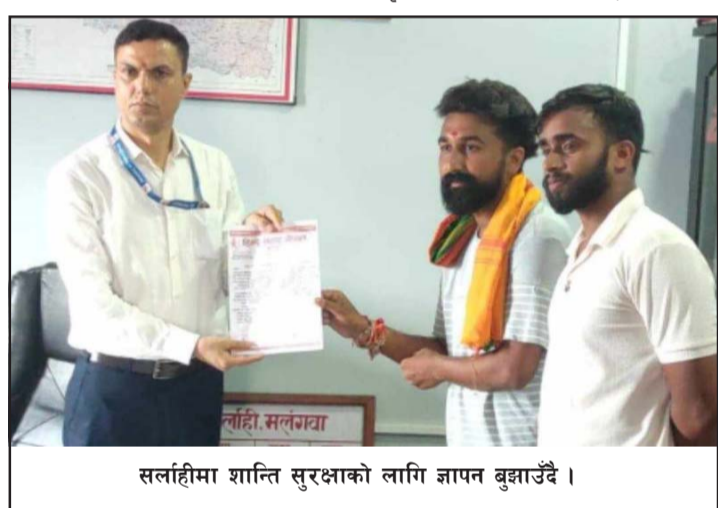
सर्लाहीमा शान्ति सुरक्षाको लागि जापन बुझाउँदै।

बढाएको छ। जिल्लाका सुरक्षा निकायले पर्व मनाउने क्रममा सामाजिक सद्भाव कायम राख्न अपील गरेको छ।