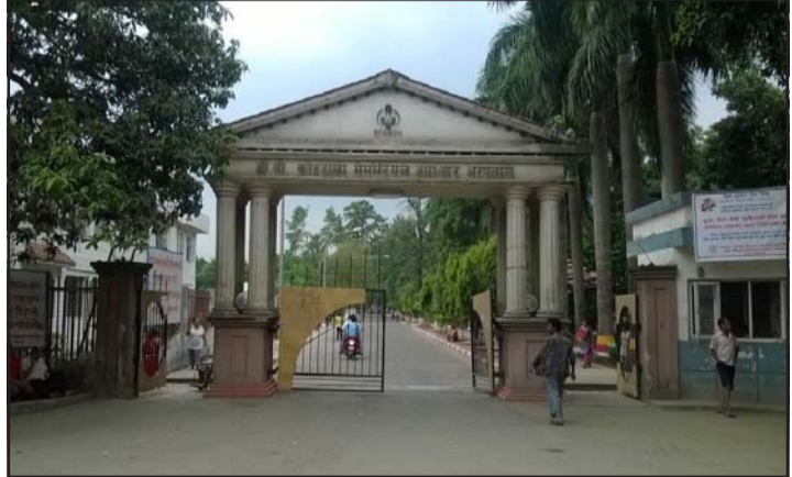
बिपी कोइराला मेमोरियल क्यान्सर अस्पतालमा बोनम्यारो प्रत्यारोपण सेवा

चीन सरकारको सहयोगमा उक्त सेवा सञ्चालनको तयारी गरिएको हो ।