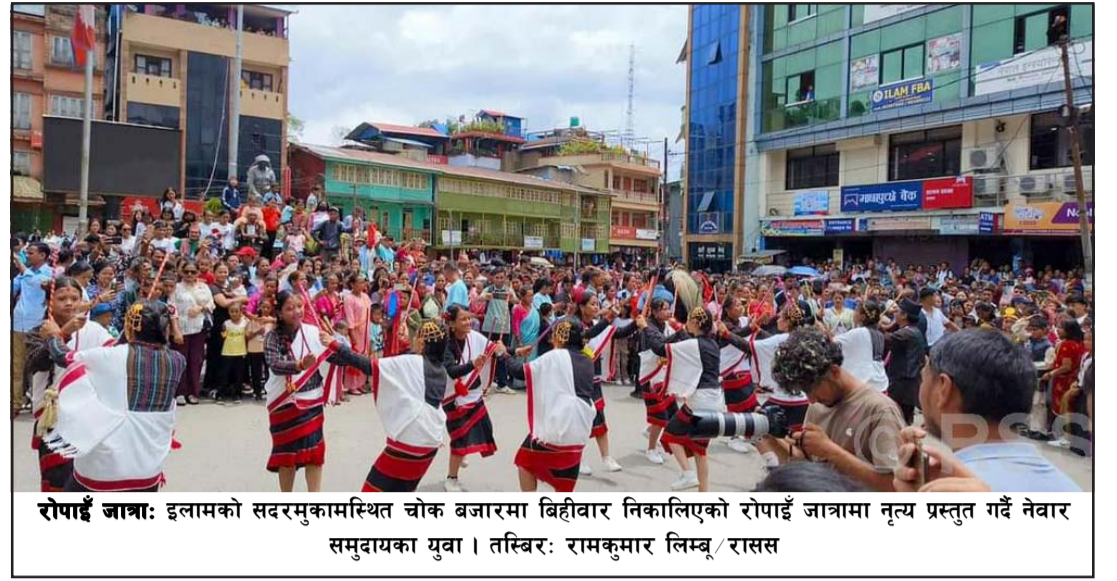
रोपाई जात्रा: इलामको सदरमुकामस्थित चोक बजारमा बिहीवार निकालिएको रोपाई जात्रामा नृत्य प्रस्तुत गर्दै नेवार समुदायका युवा।

प्रतीक प्रकाशन समूह प्रा. लि. (अफसेट छपाखाणा) त्रिमूर्ति सिनेमा हल रोड, श्रीपुर, वीरगंज-११ (नेपाल), पोस्ट बक्स नं. ७५, फोन नं. ०५१-५२५१२२, ५२३१०५ email: prateekdaily@gmail.com, Website: eprateekdaily.com