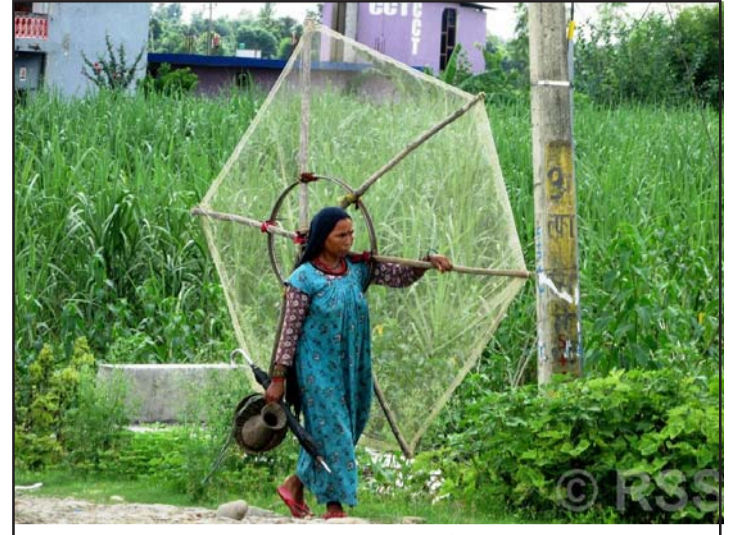
माछा मार्न जाल बोकेर सनवोरा नदीतर्फ जाँदै महिला: कञ्चनपुरको शुक्लाफाँटा नगरपालिका-१० झलारीका राना थारू समुदायका महिला माछा मार्न जाल बोकेर सनवोरा नदीतर्फ जाँदै।

समग्रमा युवा समुदायको अत्यधिक प्रतिनिधित्व हुनेगरी आर्थिक समृद्धि तथा विकासको रणनीतिलाई व्यावहारिक रूपमा लागू गर्नुपर्दछ। यसले विकासोन्मुख मुलुकको पङ्क्तिबाट नेपाललाई क्रमशः विकासशील तथा विकसित मुलुकको यात्रा तय गर्न सहज हुन्छ। हुनत युवा समुदाय यस्तो सिर्जनशील समूह हो, जसको लगनशीलताबाट प्राप्त विकासले छोटो समयमै सकारात्मक परिणाम दिन्छ। पूँजी नभएर देश विकसित नभएको होइन, भएको पूँजीको उचित व्यवस्थापन, उत्पादनमुखी क्षेत्रमा लगानी र मुलुकमै रोजगार सिर्जना गर्न नसकेर हो। त्यसैले विप्रेषणमुखी अर्थतन्त्रलाई उत्पादनमुखी अर्थतन्त्रमा रूपान्तरण गर्दै लैजानुपर्दछ जसले विदेशी हस्तक्षेपमा न्यूनीकरण भई परिभरता अन्त्य हुँदै आत्मसम्मानको प्रत्याभूतिका साथै मुलुकमा आत्मनिर्भर अर्थतन्त्रको विकास हुन्छ। यो नै वर्तमान सरकारको आर्थिक रूपान्तरणको मार्गचित्र हुनुपर्छ।