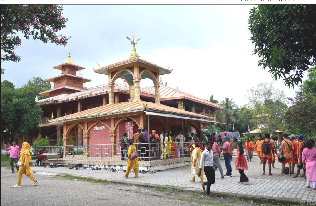
त्रिवेणीधाममा भक्तजन: नवलपरासी (बर्दघाट सुस्तापूर्व) नवलपुरको धार्मिक क्षेत्र त्रिवेणीधामस्थित मन्दिरमा दर्शन गर्न आएका नेपाल र भारतका भक्तजन।

बैंकिङ शून्य दशमलव ७२, विकास बैंक तीन दशमलव ०७, होटल तथा पर्यटन दुई दशमलव ३७, जलविद्युत् एक दशमलव ९१, लगानी दुई दशमलव ४९, उत्पादन तथा प्रशोधन शून्य दशमलव ६४, निर्जीवन बीमा शून्य दशमलव ७४, व्यापार शून्य दशमलव ३९ र अन्य समूह शून्य दशमलव ८३ प्रतिशतले बढेका छन्। आज नौवटा कम्पनीका शेयर मूल्यमा सकारात्मक सर्कित लाग्दा एउटा कम्पनीको शेयर मूल्यमा भने नकारात्मक (बाँकी पाँचौं पातामा)