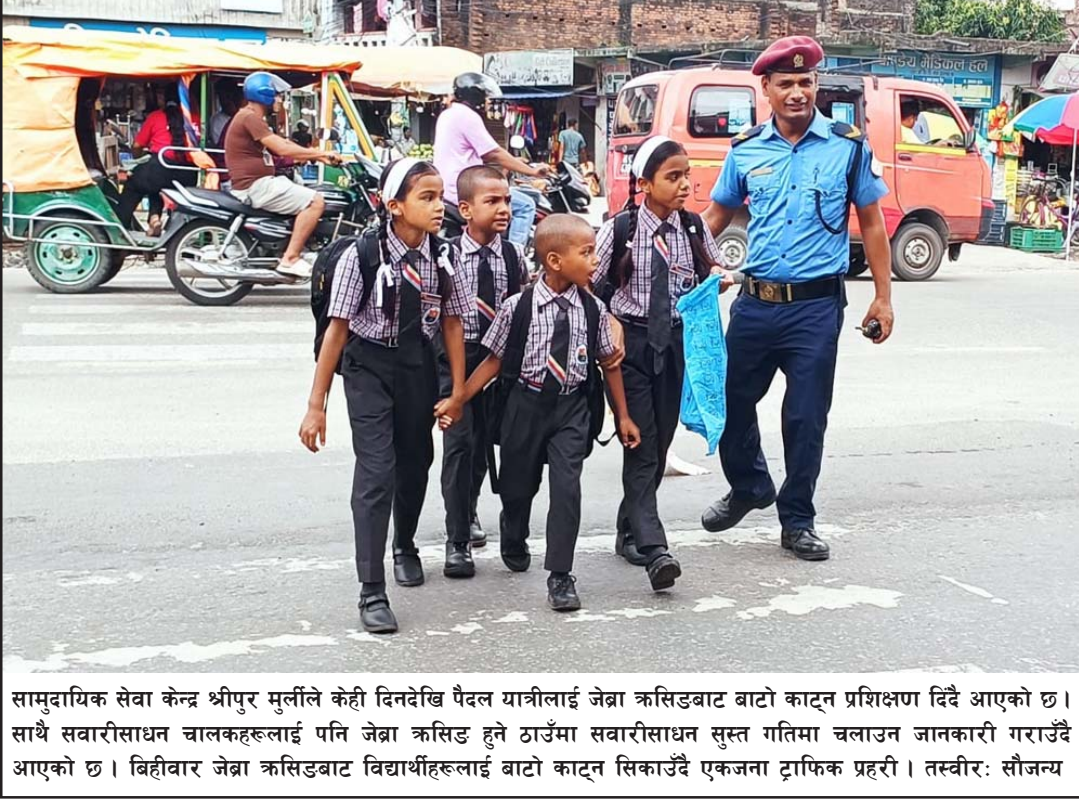
सामुदायिक सेवा केन्द्र श्रीपुर मुर्लीले केही दिनदेखि पैदल यात्रीलाई जेब्रा क्रसिङबाट बाटो काट्न प्रशिक्षण दिँदै आएको छ। साथै सवारीसाधन चालकहरूलाई पनि जेब्रा क्रसिङ हुने ठाउँमा सवारीसाधन सुस्त गतिमा चलाउन जानकारी गराउँदै आएको छ। बिहीवार जेब्रा क्रसिङबाट विद्यार्थीहरूलाई बाटो काट्न सिकाउँदै एकजना ट्राफिक प्रहरी।