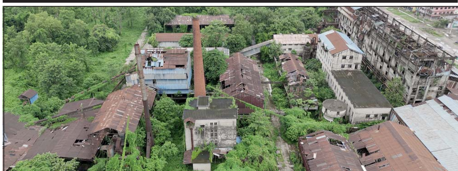
खण्डहर भूकट्टी कागज कारखाना: निजीकरणपछि विसं २०६९ बाट पूर्णरूपमा बन्द रहेको नवलपरासी (बर्दघाट-सुस्तापूर्व)को गैडाकोट-२ स्थित भूकट्टी कागज कारखाना। उद्योग बन्द भएपछि अहिले उद्योगका भौतिक संरचना जीर्ण भएका छन् भने उद्योग परिसरलाई बुटघान र झाडीले ढाकेको छ।

माथि नाम लेखान चाहने चिकित्सकहरूले यस दैनिकको वार्षिक ग्राहक हुन जानकारी गराइनु। सम्पर्क: बजार व्यवस्थापक जीतेन्द्र पटेल मोबाइल नं. ९८०४०९१५४८, ९८०७७७७५३