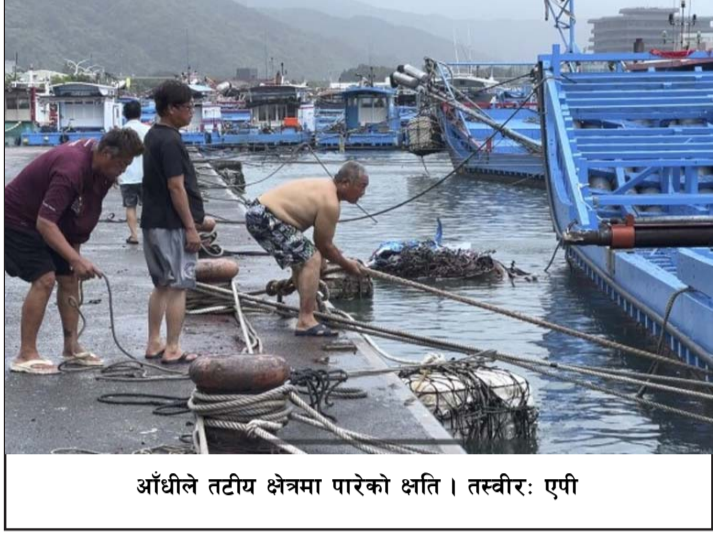
आँधीले तटीय क्षेत्रमा पारेको क्षति।

तल्लो भेगमा बाढी आएको छ भने पहिरोसमेत गएको छ। आँधीले घर र पसलहरूमा क्षति पुगेको छ।