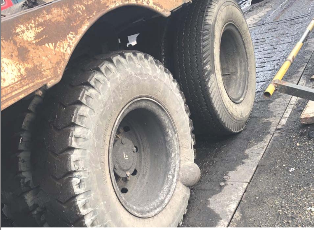
भारतबाट आएको एउटा टेलरको पछाडिको चक्का यसरी फुल्लुलाई एयर लिफ्ट भएको भनिन्छ। यस्तो अवस्थामा यदि टायर पड्कियो भने ठूलो दुर्घटनाको जोखिम रहन्छ।