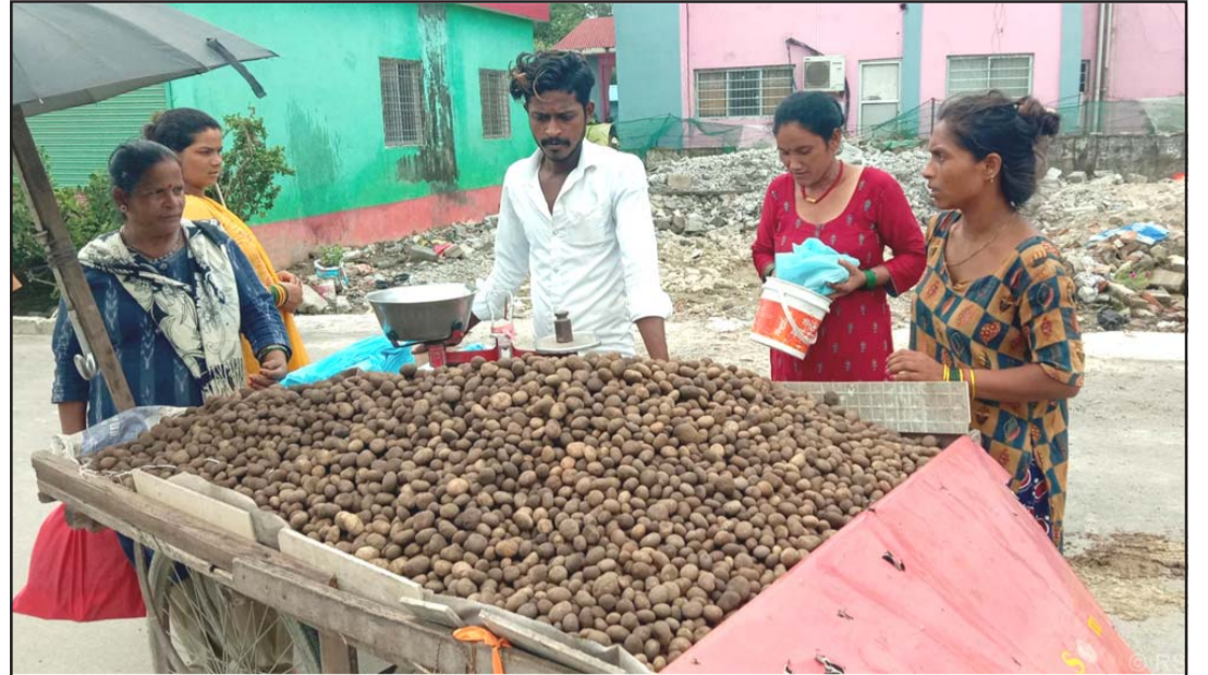
पुङ्की च्याउको व्यापार: कैलालीको धनगढी उपमहानगरपालिका-१ नैनादेवी रोड क्षेत्रमा व्यापारीले बिक्रीका लागि ल्याएको पुङ्की च्याउ खरीद गर्दै उपभोक्ता । जङ्गलमा पाइने पुङ्की च्याउ यहाँ प्रतिकिलो रु ३०० देखि ३५० सम्ममा बिक्री हुने गरेको छ ।

गलत काम अस्वीकार गर्दै आएका सिनावात्राको फेड थाई पार्टीकी नेत्री सेता सिनावात्रा सन् २०२३ को चुनावपछि सेनासँग सम्बन्धित दलसँग गठबन्धन गरेर प्रधानमन्त्री बनेकी थिइन् । रासस