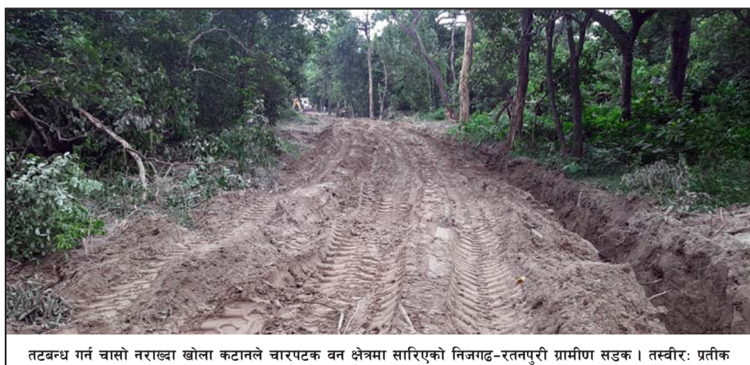
तटबन्ध गर्न चासो नराख्दा खोला कटानले चारपटक वन क्षेत्रमा सारिएको निजगढ-रतनपुरी ग्रामीण सडक ।

प्रस, निजगढ, २ भदौ/ किनार हुँदै गएको निजगढ-रतनपुरी आएको छ । भएका संरचनाको संरक्षण एउटै सडक चार/चार पटक सडकमा तटबन्ध गर्न वास्ता नगर्दा बसेनि गर्दै नयाँ विकासका कार्य गर्नुपर्नेमा