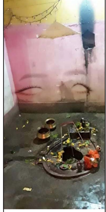
धसेको शिवलिङ्ग र भित्तामा देखिएको विचित्र आँखासहितको आकृति।

प्रस, गरुडा, २८ असार/ रौतहटको समनपुरमा रहेको प्राचीन महत्त्वको शिवलिङ्ग जमीनमा भासिएको