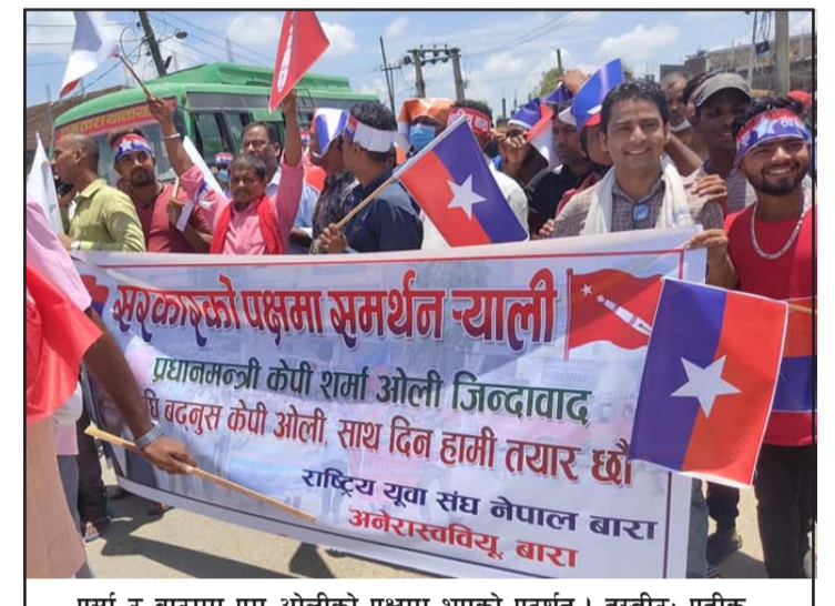
पर्सा र बारामा प्रम ओलीको पक्षमा भएको प्रदर्शन।

विद्यार्थी युनियनको अगुवाइमा भरतचोकमा विरोध प्रदर्शन गरिएको हो। प्रदर्शनको क्रममा सर्वोच्चको