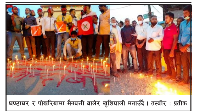
घण्टाघर र पोखरियामा मैनबत्ती बालेर खुशियाली मनाउँदै।