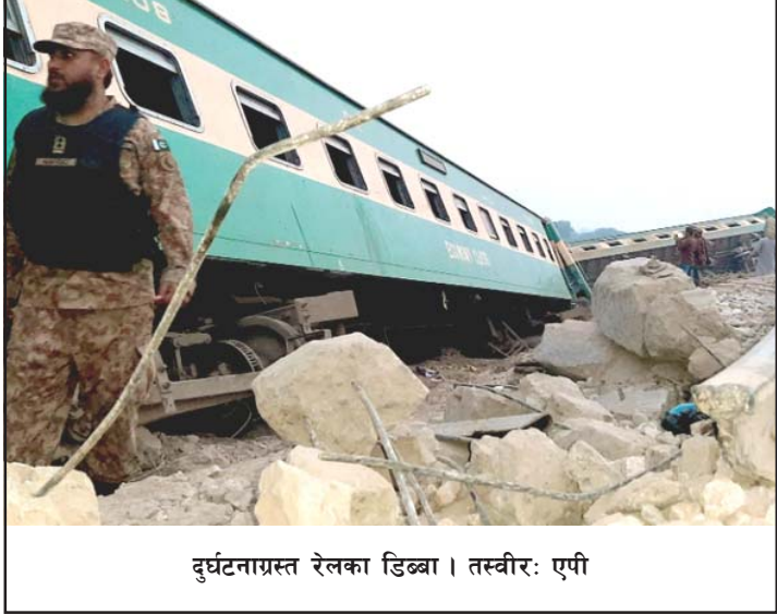
दुर्घटनाग्रस्त रेलका डिब्बा ।

अब्दुल्लाहले पछिल्लो विवरण अनुसार कम्तीमा ३० जनाको मृत्यु भएको बताए । रेलवे अधिकारीहरूका अनुसार दुवै रेलमा गरी करीब एघार सय यात्री सवार थिए । घाइते कतिपय यात्रीको स्वास्थ्य अवस्था निकै नाजुक रहेकाले मृतकको सङ्ख्या बढ्न सबने अधिकारीहरूको भनाइ छ । रासस