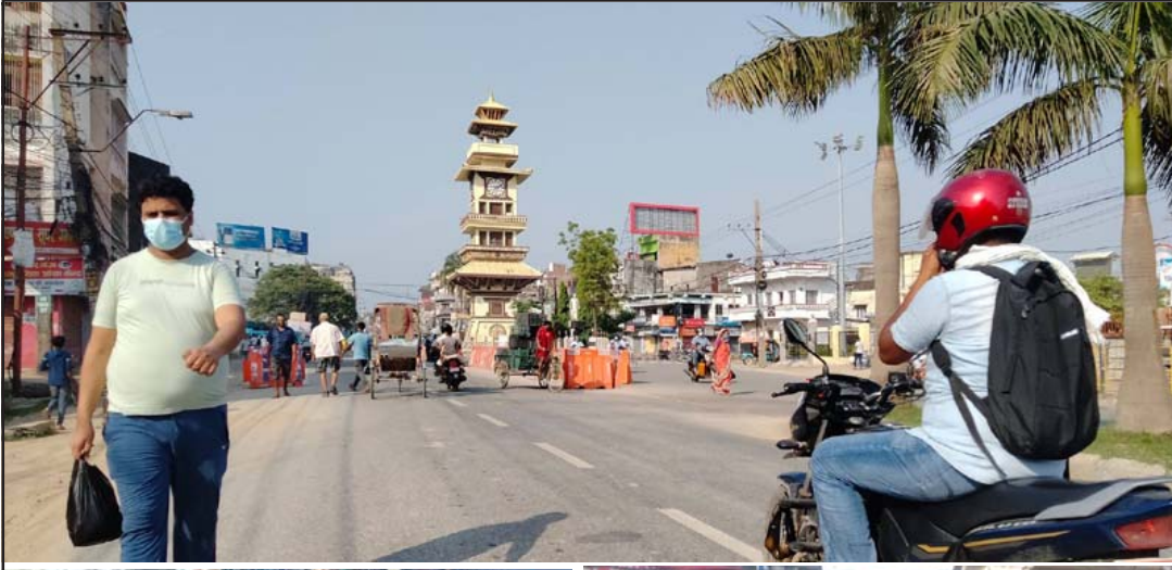
वीरगंज महानगरपालिकाको मुख्य बजार आदर्शनगरमा बिहानीपख खुलेका पसलहरू।

प्रस, वीरगंज, २४ जेठ/ पसां जिल्लामा निषेधाज्ञा अवधि जेठ ३० गतेसम्म रहे पनि अहिले सङ्क्रमित सङ्ख्या घट्दै गरी वीरगंज महानगरपालिकालगायत जिल्लाभरि चहलपहल बढेको छ ।