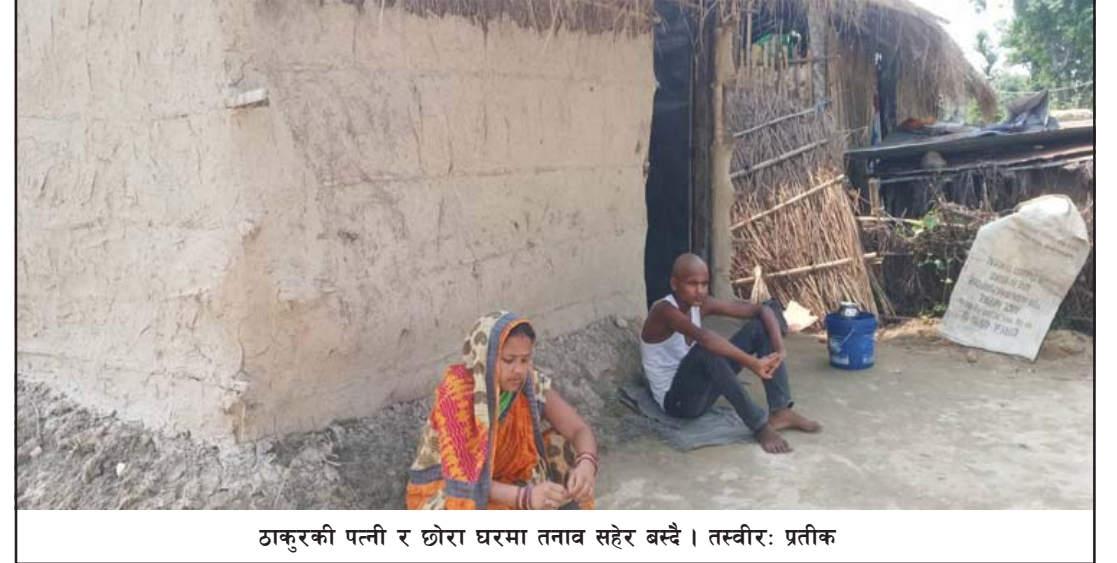
ठाकुरकी पत्नी र छोरा घरमा तनाव सहेर बस्दै ।

लागि डिभिजन वन कार्यालय र जिल्ला प्रशासन कार्यालयमा धेरैपटक उजूरी पनि