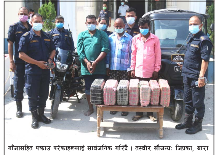
गाँजासहित पक्राउ परेकाहरूलाई सार्वजनिक गरिँदै ।

पसाँको संयुक्त टोलीले बाराको महागढीमाई नगरपालिका-२ इनर्वा चोकबाट ४९ किलो गाँजासहित तीनजनालाई पक्राउ गरेको छ ।