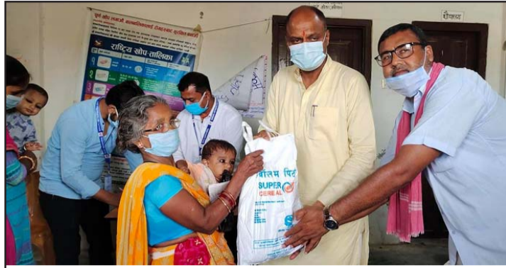
अभिभावकलाई पोषण आहार वितरण गर्दै नगरप्रमुख सरावगी।

कार्यक्रम अन्तर्गत पहिलो चरणमा बिहीवारदेखि सबै वडामा महानगर प्रमुख