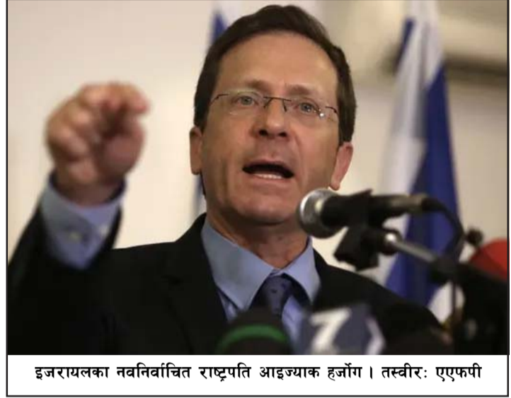
इजरायलका नवनिर्वाचित राष्ट्रपति आइज्याक हर्जोग।

राष्ट्रपतिमा निर्वाचित हुन इजरायली संसद् नेसेटको १२० स्थानमध्ये कम्तीमा ६१ स्थान प्राप्त गर्नुपर्दछ। विजयी उम्मेदवारले आगामी जुलाई ९ बाट कार्यभार सम्हाल्नेछन्। रासस