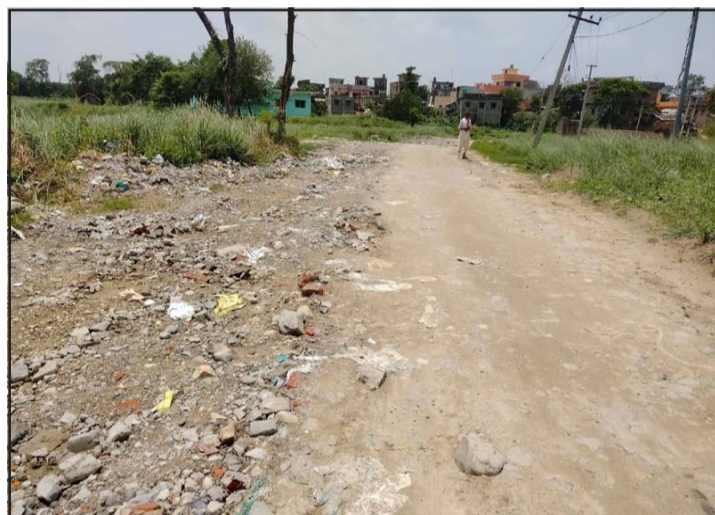
वीरगंज-२५ मौजे श्रीसियामा निर्माण हुन बाँकी सडक ।