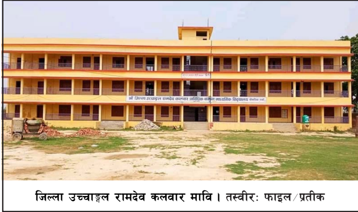
जिल्ला उच्चाङ्गल रामदेव कलवार मावि।