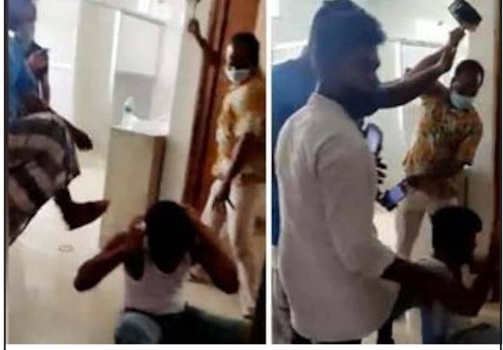
अस्पतालमा स्वास्थ्यकर्मीलाई मुक्का र लातले कुटपिट गरेको भिडियो फुटेज ।

पक्राउ गरिएको बुधवार जानकारी दिए । होजाई जिल्लामा रहेको उडाली केयर