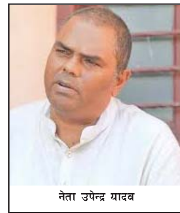
नेता उपेन्द्र यादव

यादवले विज्ञप्तिमा भनेका छन्, “नवधनाढ्यदेखि व्यवसायीलाई त फाइदा नै होला तर यसबाट सबैभन्दा बढी प्रभाव चुरेको संवेदनशील क्षेत्रमा पर्ने र यसले तराई-मधेसमा ठूलो प्राकृतिक सङ्कट निम्त्याउनेछ।”