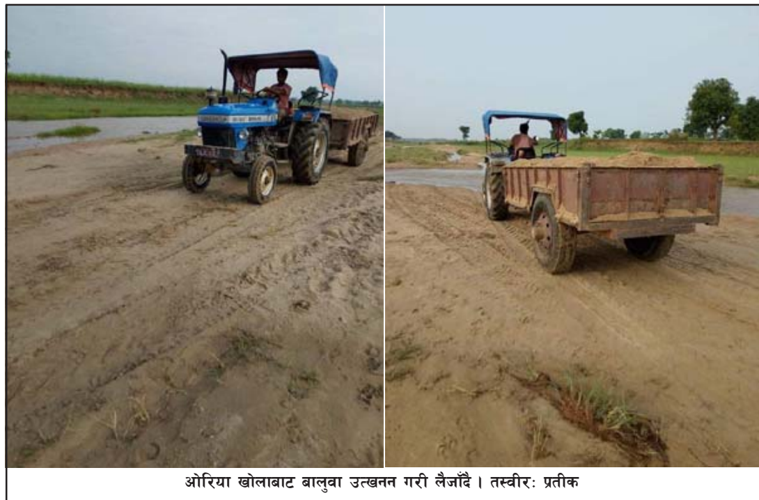
ओरिया खोलाबाट बालुवा उत्खनन गरी लैजाँदै ।

प्रस, पंचगाव, १९ जेठ/ जीराभवानी गाउँपालिका-१ महादेवपट्टिस्थित ओरिया खोलाबाट बालुवा तस्करी भइरहेको छ । ठेक्का नलागेको यो खोलाबाट अहिले अवैध उत्खनन भइरहेको स्थानीयले