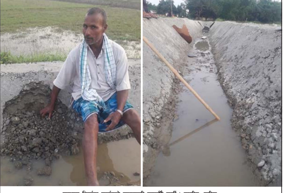
कमसल निर्माण कार्यबारे जानकारी गराउँदै कुर्मि ।

गरेको छ । सो टर्सरी निर्माण भएको एक हप्ताभित्र नै भत्कन थालेको स्थानीय