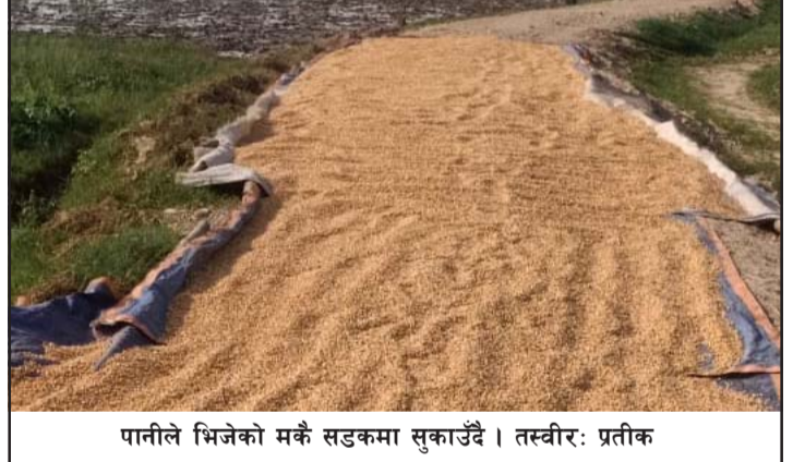
पानीले भिजेको मकै सडकमा सुकाउँदै ।

परेको कारण मकैखेती गरेका किसानहरूलाई घाटा भएको छ । पानी पर्नुअघि उत्पादित मकै प्रतिकिलो रु २५ मा बिक्री हुने गरेकोमा अहिले पानी परेकै कारण व्यापारीहरूले मूल्य घटाएका छन् । अहिले व्यापारीहरूले प्रतिकिलो रु १८ देखि २१ सम्म मकै खरीद गर्दैछन् । व्यापारीहरूले पानी परेको कारण मकैको दानामा सिम आएको र मकैको वजन बढेको भन्दै दाम घटाएका छन् । पर्सगढी नपाको वडा नं ३ को झबराहा, धुलीटार, कटहरिया र वडा नं ४ को बर्वाटौँडी, हरदासपुरमा मकैखेती हुँदै आएको छ । यी ठाउँमा धानखेती कम र मकैबाली बढी हुन्छ । मकै