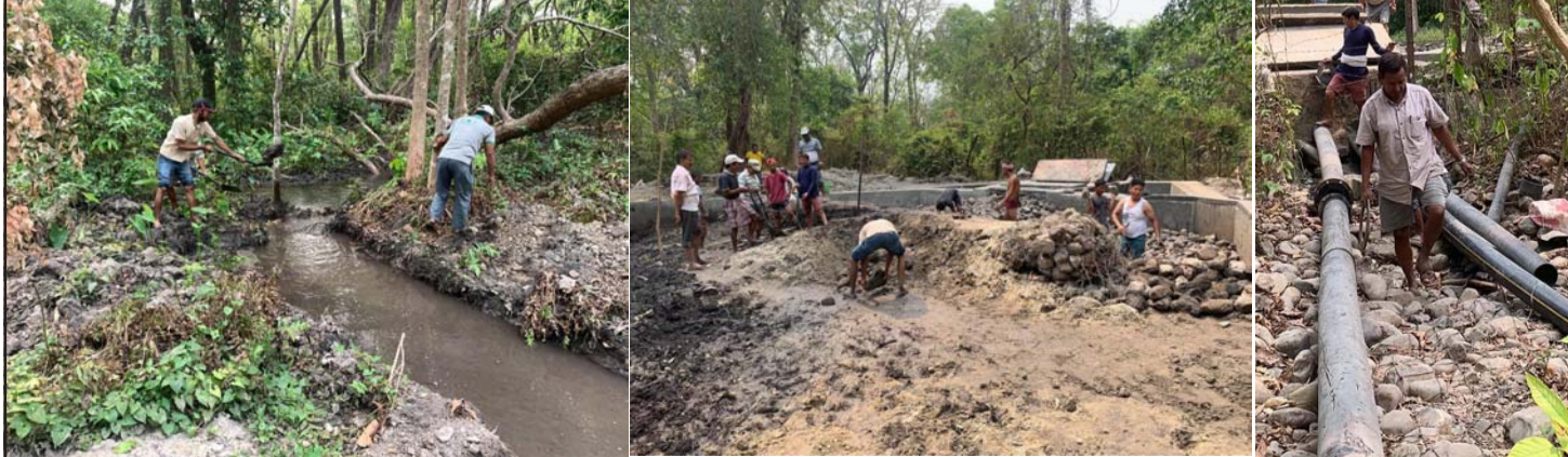
क्षतिग्रस्त खानेपानी मुहान र पाइपको मर्मत गर्दै ।

रहेको किनाराको भाग बसेंनै वर्षा शुरू भएसँगै पानीले भत्काउने गरेको छ । यस वर्ष सोही समस्याका कारण ठोरी