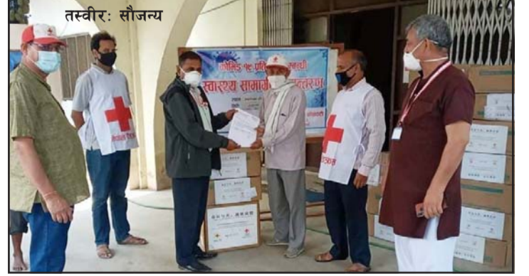
जोगिने स्वास्थ्य सामग्रीहरू हस्तान्तरण गरेको छ ।

गरेका थिए । उनले नेरेसो बारा शाखालाई २३ हजार थान सर्जिकल मास्क, १ हजार थान एन-९५ मास्क र १५ थान व्यक्तिगत सुरक्षा सामग्री