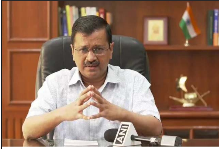
भारत दिल्लीका मुख्यमन्त्री अरविन्द केजरीवाल।

दिल्ली सरकारका अनुसार अहिले अग्रपङ्क्तिमा खटिएका स्वास्थ्यकर्मी लगायतका कर्मचारीहरूलाई दुई लाख ६५ हजार १० कोभिसिड खोप उपलब्ध गराइएको छ। त्यसबाहेक दिल्लीमा अरु ५२ लाख ६४ हजार २३२ खोप प्रयोग भइसकेको छ। रासस