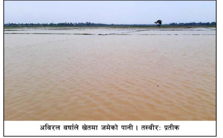
अविरल वर्षाले खेतमा जमेको पानी ।

निषेधाज्ञाको कारण छिटपुट सवारीसाधनहरू सञ्चालन भएकाले त्यति असर परेको छैन । तर यसबाहेक सो सडकखण्डबाट आवतजावत गर्नेहरू