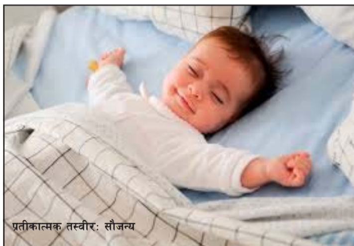
प्रतीकात्मक तस्वीर: सौजन्य

सपना देखिन्छ, तर गहिरो निद्रामा छ भने मानिसले सपना देख्दैन ।