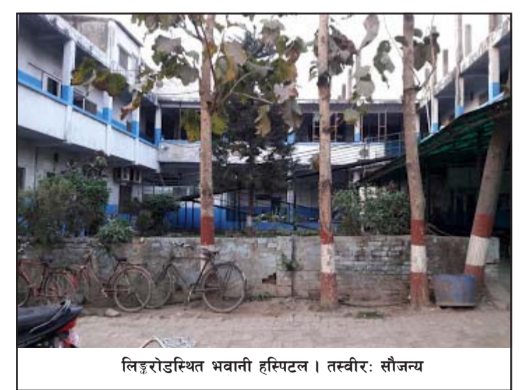
लिङ्गरोडस्थित भवानी हस्पिटल ।

गरी शल्यक्रिया गरिएको उनले बताए । बिरामीलाई तीन वर्षदेखि टाड दुख्ने, सीधा हिंडुल गर्न नसक्ने, हिंडुल गर्दा शरीर टेढो गरेर हिंडुने समस्या थियो । उनी यसअघि टाडको पीडालाई लिएर भारत, बिहारको राजधानी पटना, काठमाडौंलगायतका विभिन्न हाडजोर्नी तथा नसा रोग विशेषज्ञसँग परामर्श लिएर औषधि सेवन गर्दै आएका थिए । तर पीडा कम नभएपछि आफूकहाँ आएको र शल्यक्रिया गर्ने सल्लाह दिएको बताए । बिरामीको एमआरआई गरेर हेर्दा टाडको तीन लेभलमा स्पाइन्को स्टोनिंग र डिस्कमा समस्या देखिएको उनले बताए । (बाँकी अन्तिम पातमा)