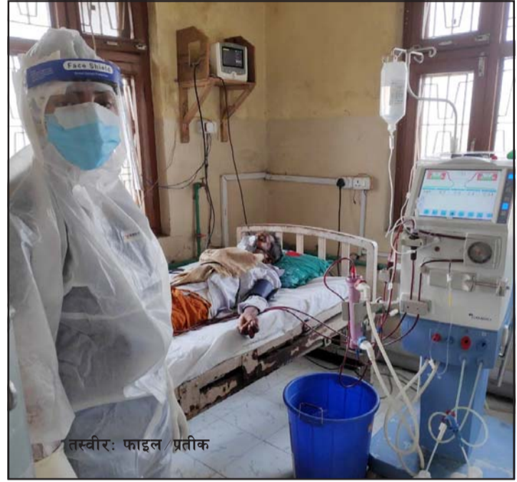
व्यवस्था गर्न चिकित्सकहरूले सुझाएका छन् । सरकारले डायलोसिसका लागि

यो अवस्थामा नारायणी अस्पतालले कोभिड भएका बिरामीहरूलाई मात्र डायलोसिस सेवा दिने हो भने नेशनल र वीरगंज हेल्थकेयरले ननकोभिड मिर्गौलारोग पीडितको डायलोसिस गर्न सक्ने थियो । यसो गर्दा सबैजनाले सहज सेवा पाउने वातावरण हुने एकजना चिकित्सकले सुझाएका छन् ।