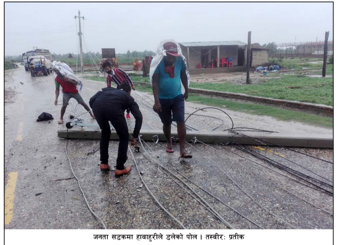
जनता सडकमा हावाहुरीले डलेको पोल ।

पञ्जियारले नयाँ पोल गाड्ने काम भइरहेको बताए । उनले निरन्तर वर्षाको कारण तत्काल विद्युत् आपूर्ति हुन नसक्ने