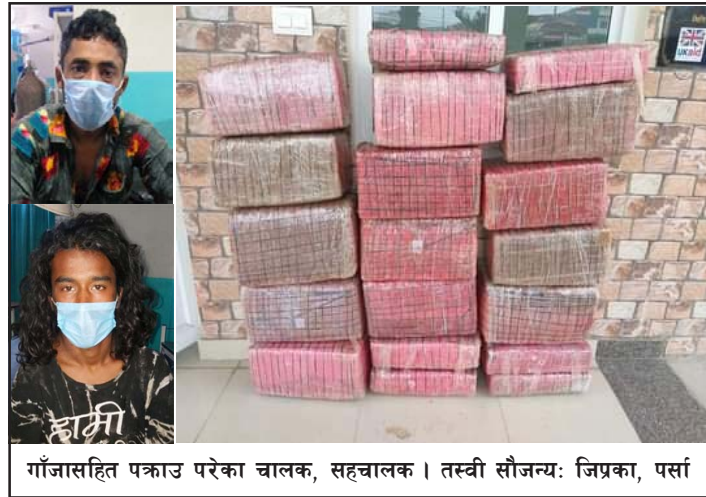
गाँजासहित पत्राउ परेका चालक, सहचालक ।

सूचना पाएपछि ग्यारेजमा मरम्मतको लागि पार्किङ गरिराखेको ट्याङ्करबाट