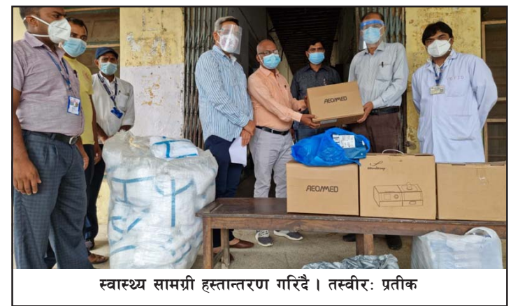
स्वास्थ्य सामग्री हस्तान्तरण गरिँदै ।

वीरगंज तथा मध्यतराईका जिल्लाहरू बढी प्रभावित भएको भन्दै नारायणी