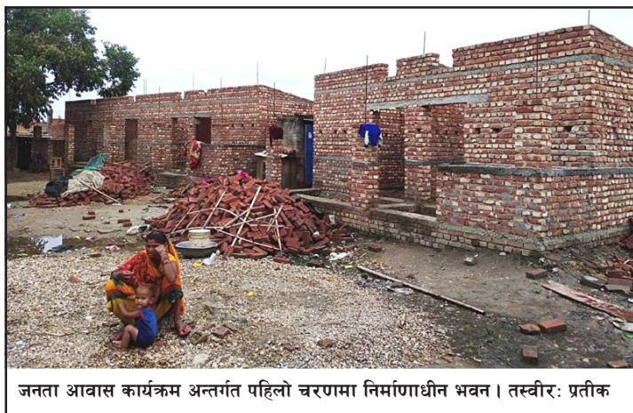
जनता आवास कार्यक्रम अन्तर्गत पहिलो चरणमा निर्माणाधीन भवन।

छन्, सोही ठाउँका व्यक्तिको संलग्नतामा उपभोक्ता समिति बनाएर निर्माण कार्य