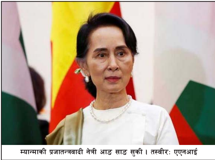
म्यानमाकी प्रजातन्त्रवादी नेत्री आड साड सुकी।

त्यति बेलाको निर्वाचन धाँधलीपूर्ण भएकाले फेरि अर्को निर्वाचन गर्नुपर्ने भन्दै म्यानमामा सेनाले सत्ता नियन्त्रणमा लिएको छ। रासस