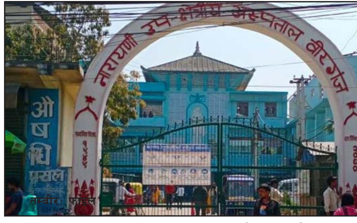
५३ वर्षीय पुरुषको बिहान दुई बजे मृत्यु भएको जिल्ला प्रशासन कार्यालय पर्साका

३५.८ सम्म सिटी भ्यालू रहेको बताए । यसैबीच, शनिवार साँझ ६ बजेसम्म वीरगंजका अस्पतालमा तीनजना सङ्क्रमितको मृत्यु भएको छ । नारायणी अस्पताल, बयोधा र स्पर्श स्पेशलिटाटी अस्पताल गरी तीन स्थानमा तीनजना सङ्क्रमितको मृत्यु भएको हो । नारायणी अस्पताल वीरगंजमा बारा जिल्ला महागढीमाई नगरपालिका-२ निवासी ५० वर्षीया महिलाको दिउँसो साढे दुई बजे मृत्यु भएको थियो । यसैगरी, नारायणी बयोधा अस्पतालमा वीरगंज- ९ निवासी ६५ वर्षीय पुरुषको बिहान साढे ६ बजे र स्पर्श अस्पतालमा पर्सा जिल्ला पकाहामैनपुर गापा-४ निवासी