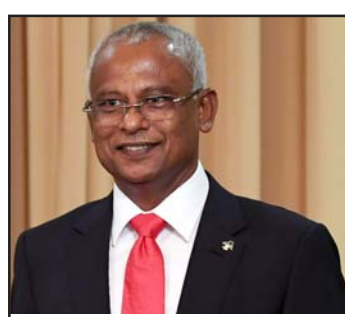
राष्ट्रपति इब्राहिम मोहम्मद सोलिह

पनि निश्चित मापदण्ड पूरा गरेर मात्रै सञ्चालन गर्न पाइने व्यवस्था गरिएको छ।