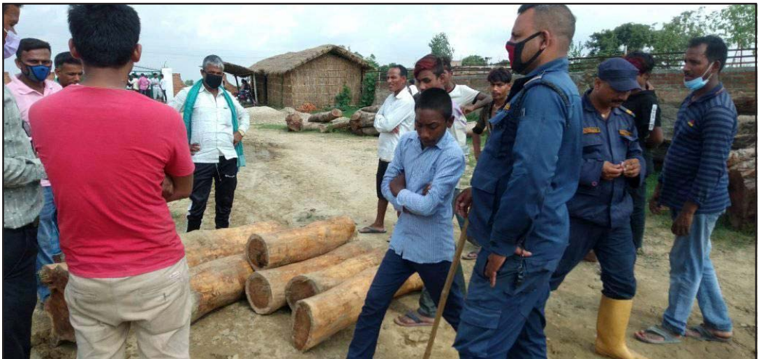
बरामद काठ प्रहरीले नियन्त्रणमा लिँदै।

जटाशङ्कर प्रसादले सञ्चालन गरेको समिलबाट बरामद भएको हो। स्थानीय युवाहरूको सक्रियतामा सो सिसौको काठ