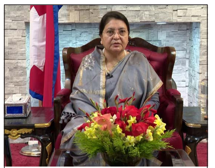
राष्ट्रपति विद्यादेवी भण्डारी।