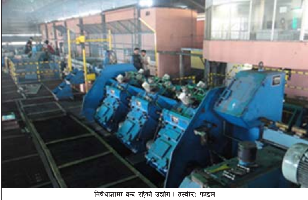
निषेधाज्ञामा बन्द रहेको उद्योग ।

व्यवसायीहरूले कच्चा पदार्थ आयात र बिजुली महसुलमा सरकारले तत्कालै नीति बनाएर सङ्कटकालमा चलिरहेको उद्योगलाई छुट दिनुपर्ने मागसमेत गरेका छन् ।