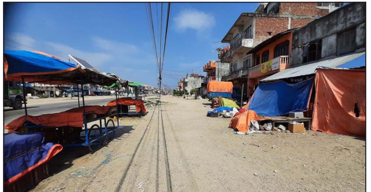
कोरोना सङ्क्रमित बढेसँगै एक दिन अघिदेखि एकसाताका लागि निजगढमा लकडाउन घोषणा गरेसँगै सुनसान निजगढ राजमार्गका बस्ती।

Aadarsh Nagar, Birgunj, Nepal, www.lordshotels.com,