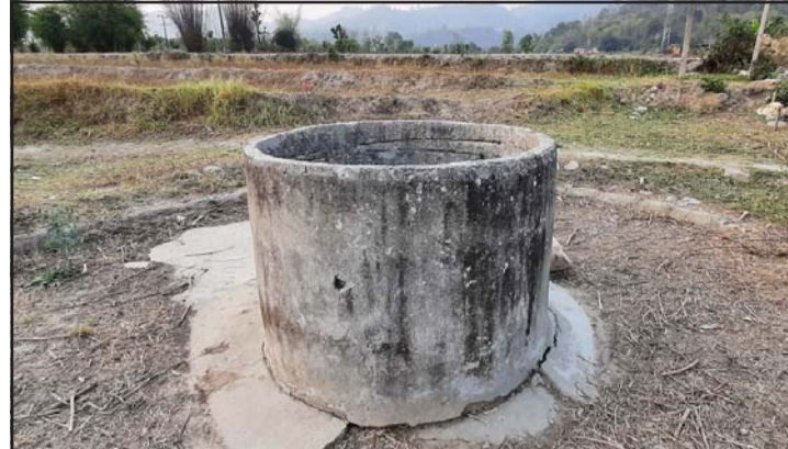
निजगढ नपा-१२ स्थित भूमिगत पानीको स्रोत इनार।

राष्ट्रपति चुरे-तराई मधेस संरक्षण विकास समितिले यस क्षेत्रमा पोखरी, तालतलैया निर्माणका लागि काम गर्दा केही हदसम्म पानीको स्रोत संरक्षण हुने तर ती स्थानमा अहिलेसम्म ध्यान नगएको स्थानीयको गुनासो छ। स्थानीय तह, वन कार्यालयलगायत सम्बन्धित निकायहरूले यस क्षेत्रमा पनि पोखरी निर्माणका लागि बजेट विनियोजन गरी काम गर्न पहल गर्नुपर्ने यहाँका मानिसको माग छ।