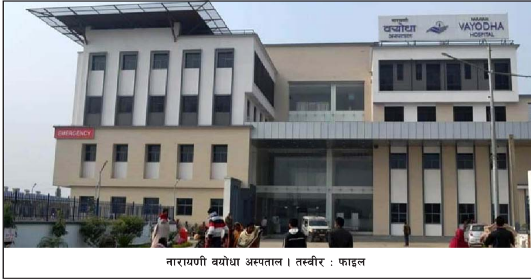
नारायणी वयोधा अस्पताल । तस्वीर : फाइल

वैशाख २५ गते नारायणी अस्पतालमा थिए । यसैगरी वीरगंज महानगरपालिका- १३ राधेमाई निवासी ५० वर्षीया महिलाको