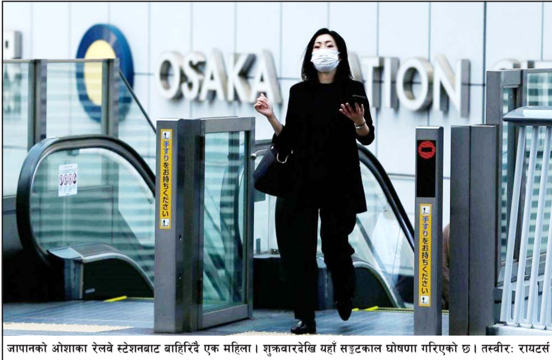
जापानको ओशाका रेलवे स्टेशनबाट बाहिरिदै एक महिला। शुक्रवारदेखि यहाँ सङ्कटकाल घोषणा गरिएको छ।

सुगाले कोभिड-१९ भाइरसको महामारी तीव्ररूपमा फैलिएपछि फेरि पनि सङ्कटकालको घोषणा गरेका छन्।