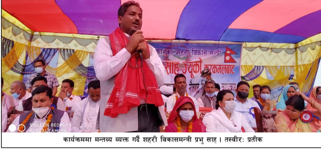
कार्यक्रममा मन्त्र्य व्यक्त गर्दै शहरी विकासमन्त्री प्रभु साह ।

गरी भारतको सीमासम्म सन्तपुर भएर नै सडकको सम्पूर्ण पूर्वाधार आफ्नो नेतृत्वमा तयार भइसकेकोले द्रुतमार्गको निर्माण पूरा हुनासाथ भारत र नेपाल