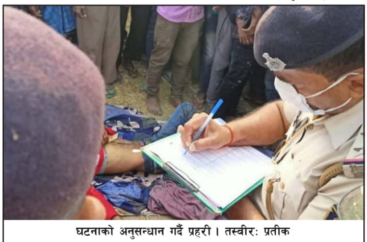
घटनाको अनुसन्धान गर्दै प्रहरी ।

अनुसार बिहीवार बिहान ५ बजे मनरेगा पार्कनजीकै खेतमा गहुँ काट्न गएका