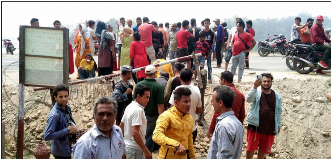
वीरगंज-ठोरी हुलाकी सडक अधूरो नै हस्तान्तरण भएपछि राजमार्गमा विरोध गर्दै स्थानीय ।

नगरेको स्थानीयको भनाइ छ । हुलाकी सडकले निकुञ्जसँग समन्वय गरी जतिसक्दो छिटो काम सम्पन्न गर्नुपर्ने स्थानीयको ठहर रहेको सङ्घर्ष समिति