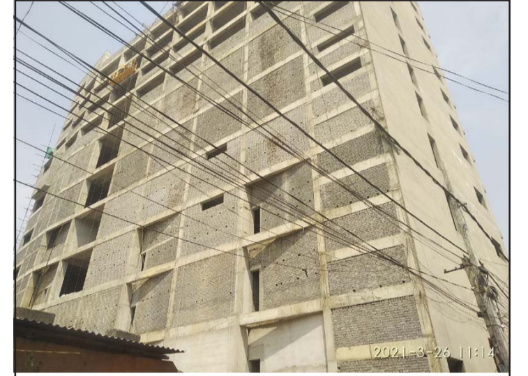
निर्माणधीन मल।

कुन परिमाणमा र कति सङ्ख्यामा नयाँनयाँ वस्तु एवं सेवा प्रयोग गर्ने त? के आर्थिक विकास भनेको मानव सभ्यतालाई प्रतिकूल पार्ने वस्तुहरूको जानाजानी उपयोग गर्नु मात्र हो त?