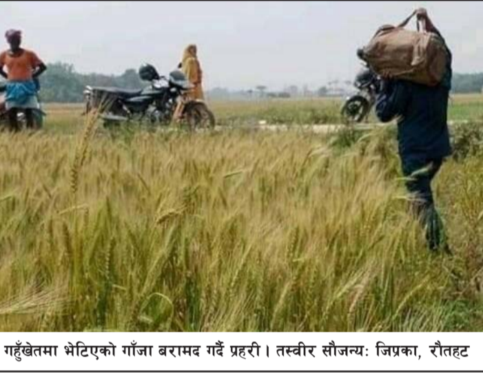
गहुँखेतमा भेटिएको गाँजा बरामद गर्दै प्रहरी।

गौर नगरपालिका-४ टिकुलियाको खेतबाट १२ किलो गाँजा बरामद गरेको छ।