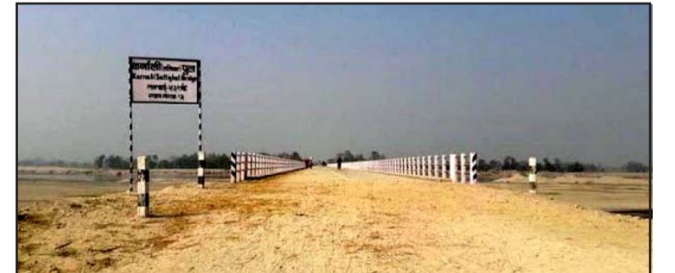
ठोरी-माडी सडक अन्तर्गत देवेन्द्रपुर-बगही सडकखण्ड।

निर्माण भइरहेको पुल बनिसकेपछि पर्स जिल्लाका १४ स्थानीय तहका