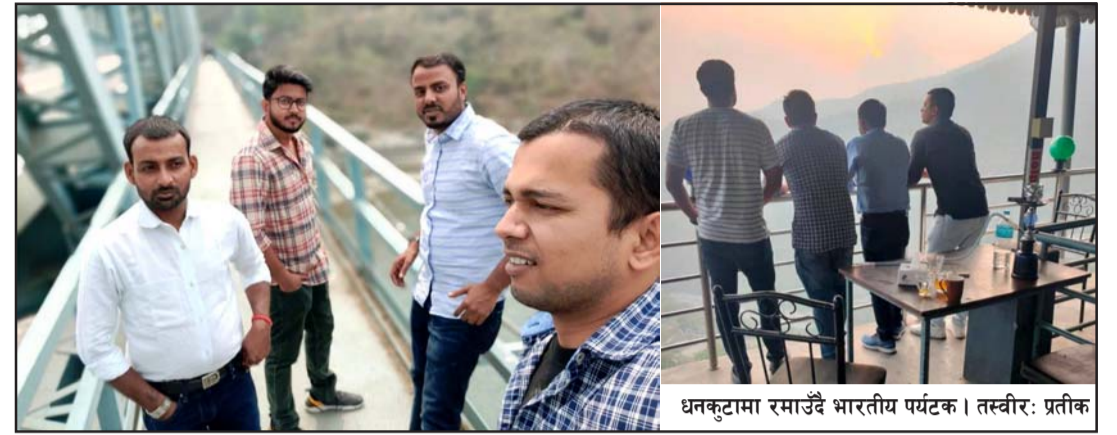
धनकुटामा रमाउँदै भारतीय पर्यटक ।

बन्दाबन्दीपछि नेपालमा पर्यटन गतिविधि सहज हुन थालेको छ ।