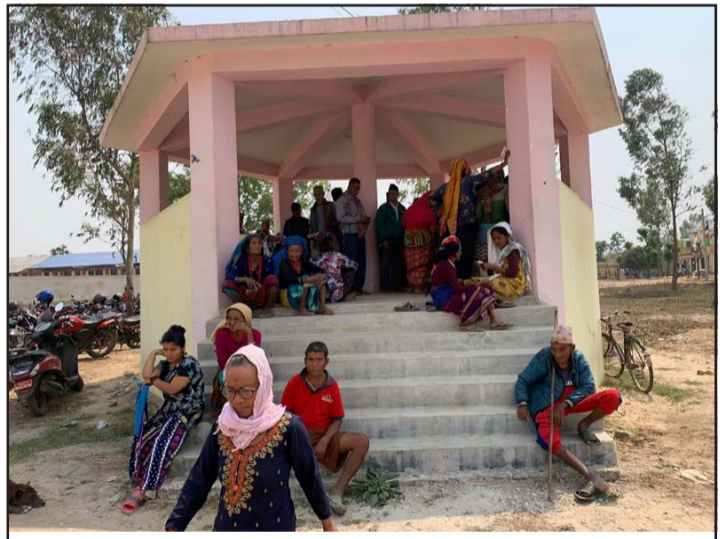
सामाजिक सुरक्षा भत्ता लिन बसेका सेवाग्राहीहरू।

र यसअघिका प्रयासहरू सोही कारणले असफल भएको कारण घुम्ती सेवामार्फत