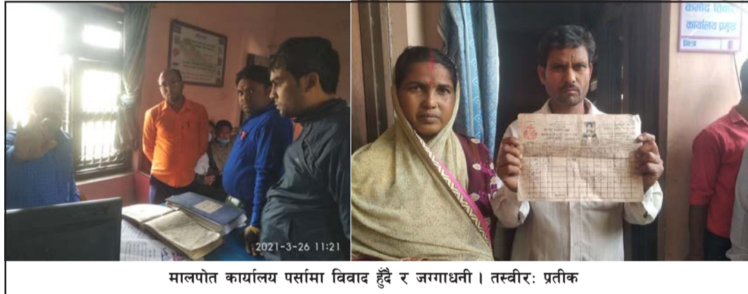
मालपोत कार्यालय पर्सामा विवाद हुँदै र जग्गाधनी।