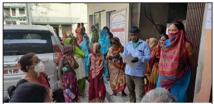
सामाजिक सुरक्षा भत्ता माग गर्दै महानगरमा महिलाहरू ।

नवीकरणको लागि महानगरपालिकामा पठाएको र त्यहीबाट चूक भएको हुन सक्ने बताए । सामाजिक सुरक्षा भत्ता