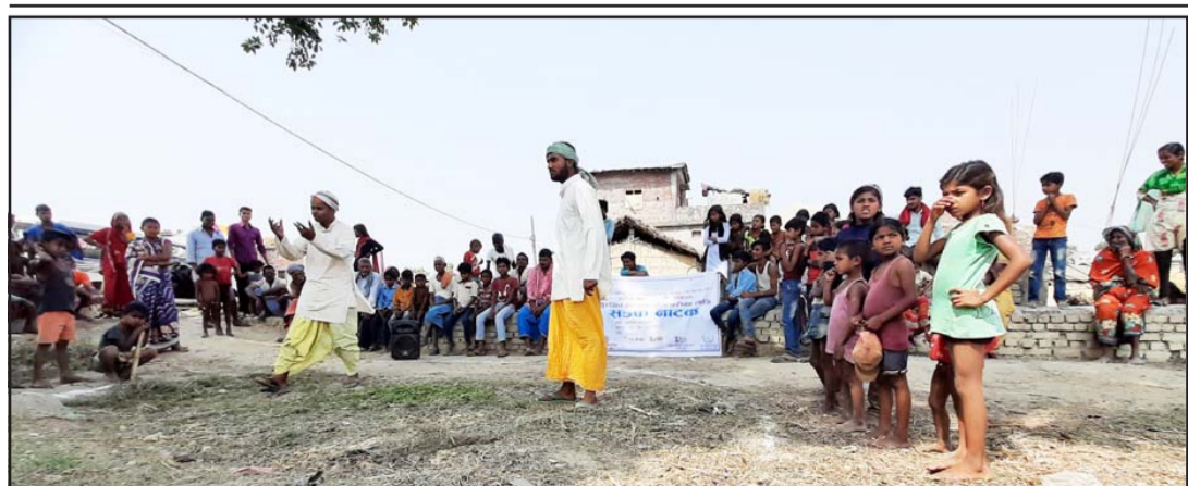
सुरक्षित वैदेशिक रोजगारका लागि सचेतना फैलाउँदै बाराको बध्वनमा सडकनाटक देखाउँदै कलाकारहरू ।