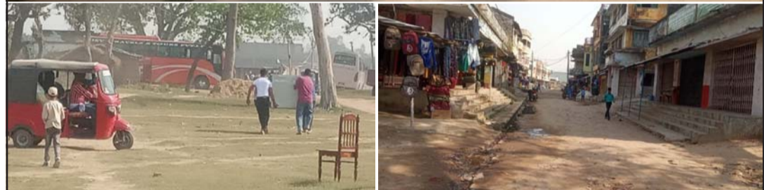
नेपालको भिस्वामा प्रहरीले मूलबाटोमा लगाएको तारबारसहितको ढाट (माथि), सामान भारत लैजाँदै र भिस्वा बजारको दृश्य ।

यतिखेर तस्करी बढेको छ । रातिपख यहाँका व्यापारीहरूले भरिया लगाएर विभिन्न सामान भारतको सिकटा बजार पुऱ्याउने गरेका छन् । कोरोना शुरु भएसँगै सीमा सिल भएको एक वर्ष बितेको छ । यसबीचमा सशस्त्र र जनपद रहेको सीमा क्षेत्रमा तारबारसहितको ढाट लगाएर आवतजावत बन्द गरिएको छ । मुख्य सडकबाट आवतजावत बन्द भएपनि कोरोना बढेकै बेलादेखि चोरबाटोबाट भारत जाने र त्यहाँबाट नेपाल आउने क्रम रोकिएको पनि छैन ।