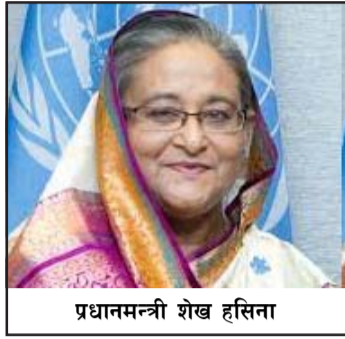
प्रधानमन्त्री शेख हसिना

सन् २००० देखि प्रतिव्यक्ति जिडिपी पनि तीन गुणाभन्दा बढीले वृद्धि भएको छ। प्रधानमन्त्री शेख हसिनाको सरकारले सन् २०११ सम्ममा बङ्गलादेशलाई “विकसित मुलुक”मा रूपान्तरण गर्ने योजना अघि सारेको छ। आर्थिक पक्षमा बङ्गलादेशले तीव्र गतिमा प्रगति गरिरहे पनि अधिकारकर्मीहरूले प्रधानमन्त्री हसिनाको शासनकालमा मानव अधिकार उल्लङ्घनका घटना बढेकामा सर्वत्र चिन्ता व्यक्त गरेका छन्। प्रधानमन्त्री हसिना सन् २००९ देखि लगातार बङ्गलादेशको प्रधानमन्त्री छन्। उनी बङ्गलादेशका राष्ट्रपिता शेख मुजिबुर रहमानकी छोरी पनि हुन्। रासस