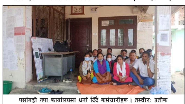
पसांगढी नपा कार्यालयमा धर्ना दिँदै कर्मचारीहरू।

गौरो बुधवार नक्शापासको लागि कार्यालयमा आएका थिए। उनीहरूले नै