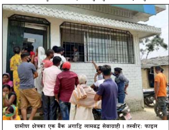
ग्रामीण क्षेत्रका एक बैंक अगाडि लामबद्ध सेवाग्राही।

ग्राहकोमा चार दिनदेखि चेक क्लियरिङ नहुँदा दुःख झेल्दै आएको गुनासो गरे।