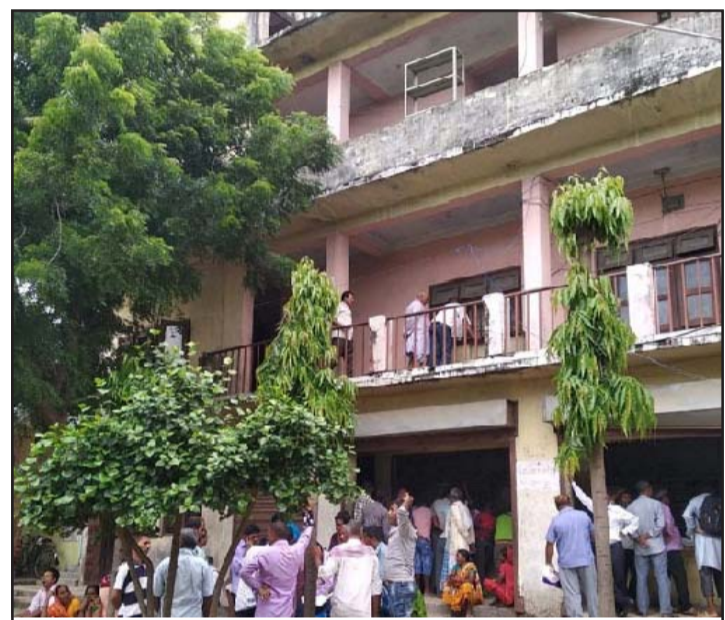
मालपोत कार्यालय, पर्सामा सेवाग्राहीको भीड।