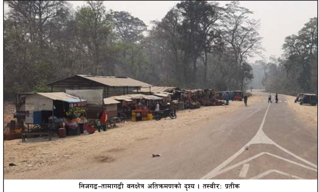
निजगढ-तामागढी वनक्षेत्र अतिक्रमणको दृश्य।

प्रस, निजगढ, ९ चैत / अन्यत्र स्थानमा गर्नुपर्ने उनले बताए। गाडी धुने, कपडा धुने र पसलेहरूले निजगढ-तामागढी-सिम्रौनगढ वनक्षेत्र अतिक्रमण हुने तरीका यही हो। समेत पानी भर्ने गर्दा पानीको खपत बढी