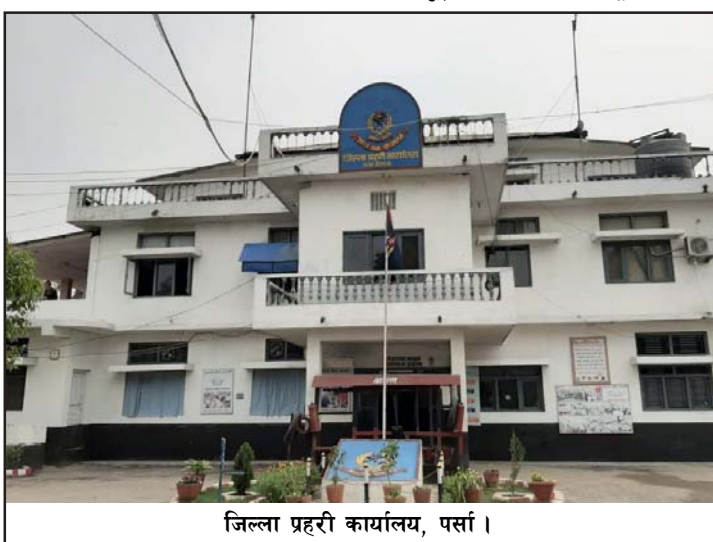
जिल्ला प्रहरी कार्यालय, पर्सामा।

मुद्दा गत वर्ष १२० वटा दर्ता भए भने चालू आवको ६ महीनामा ७२ वटा मुद्दा दर्ता भए। जबरजस्ती करणी, उद्योग,