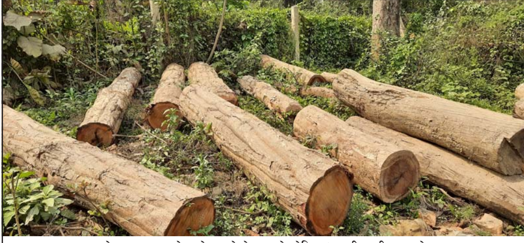
वनक्षेत्रमा तस्करहरूले काटेर राखेको सालको गोलिया।

गाडी हुलेर गोलिया चोरी तस्करी रोक्न डिभिजन वन कार्यालय बाराको