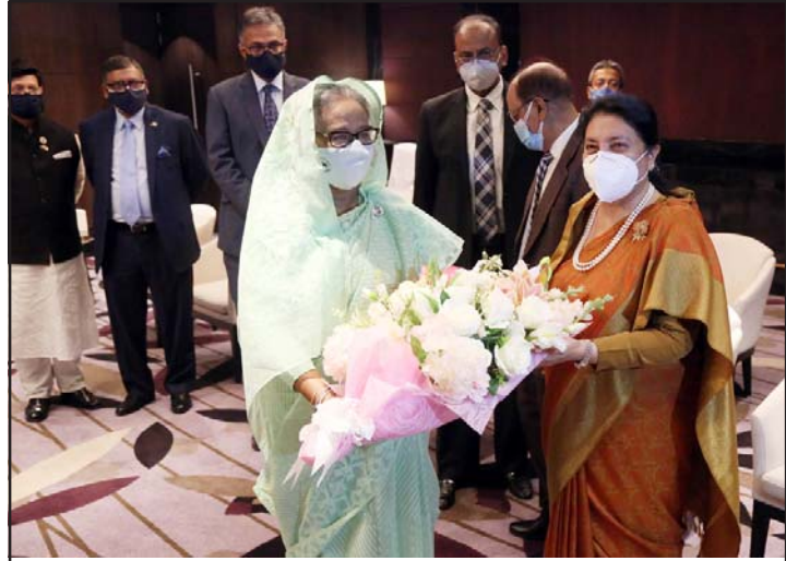
राष्ट्रपति विद्यादेवी भण्डारीसँग शिष्टाचार भेटवार्ताअधि स्वागत गर्दै बङ्गलादेशी प्रधानमन्त्री शेख हसिना ।

भएको छ । आजै यहाँका विदेशमन्त्री डा मोमेनले राष्ट्रपति भण्डारीसँग अलगगै शिष्टाचार