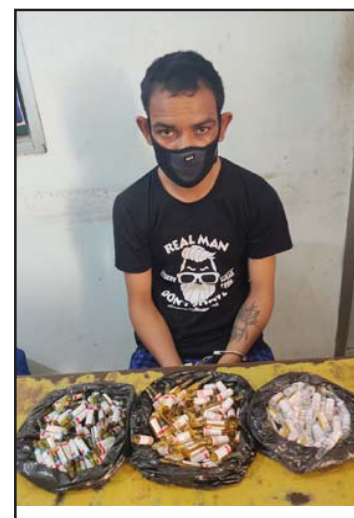
लागूऔषधसहित पक्राउ परेका नेपाली।

विश्वका सबै जनसङ्ख्यालाई स्वच्छ खानेपानी र सरसफाइको सुविधा उपलब्ध गराउने कार्यक्रम ल्याएको छ। दिगो विकास लक्ष्यका कार्यक्रम अन्तर्गतको यो लक्ष्य हासिल गर्न नेपालले १५औं आयोजनामा पानीका उपलब्ध स्रोतको संरक्षण, संवर्द्धन र किफायती उपयोग