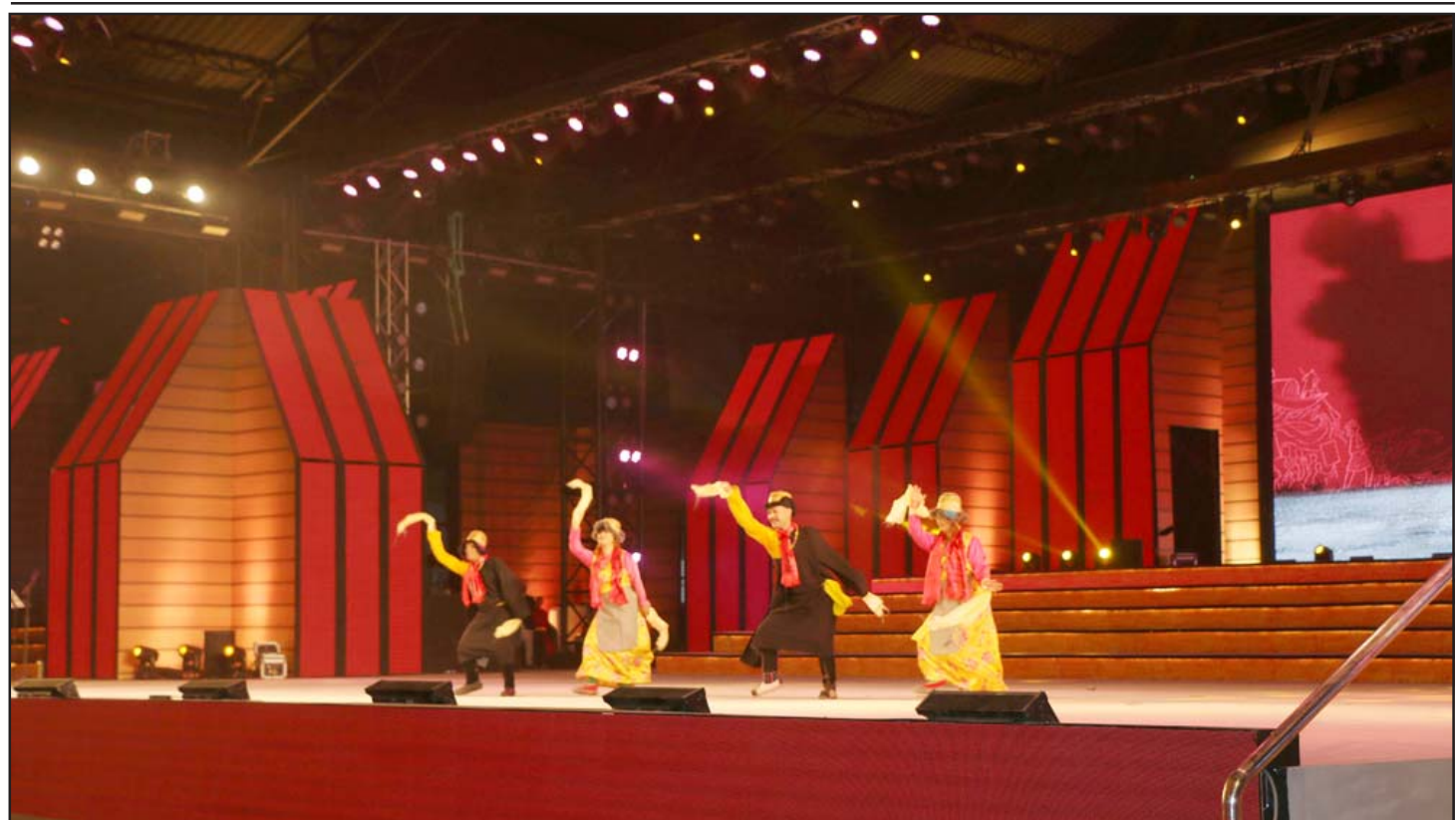
नेपाली कलाकारको प्रस्तुति : बङ्गलादेशका राष्ट्रपिता बङ्गबन्धु शेख मुजिबुर रहमानको जन्म शताब्दीको अवसरमा बङ्गलादेशको राजकीय भ्रमणका सिलसिलामा राष्ट्रपति विद्यादेवी भण्डारी र बङ्गलादेशका राष्ट्रपति मोहम्मद अब्दुल उपस्थित विशेष समारोहमा कला प्रस्तुत गर्दै नेपाली कलाकार।

गर्ने नीति, रणनीति, कार्यक्रम र योजना तय गरेको छ। यस अन्तर्गत सतहको पानी, वर्षाको आकाश पानी, सतहमुनिको पानी तीनवटै स्रोतको उपयोग गर्ने नीति लिइएको छ। दिवसका अवसरमा नेपालमा पनि सरकारी, सामाजिक र निजी क्षेत्रबाट पनि विभिन्न कार्यक्रम आयोजना गरी मनाइएको जनाइएको छ।