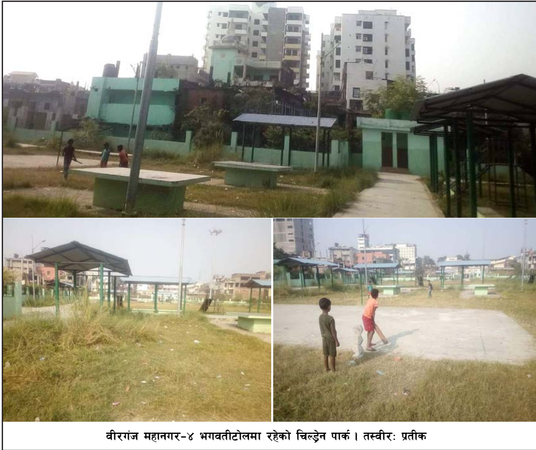
वीरगंज महानगर-४ भगवतीटोलमा रहेको चिल्ड्रेन पार्क।