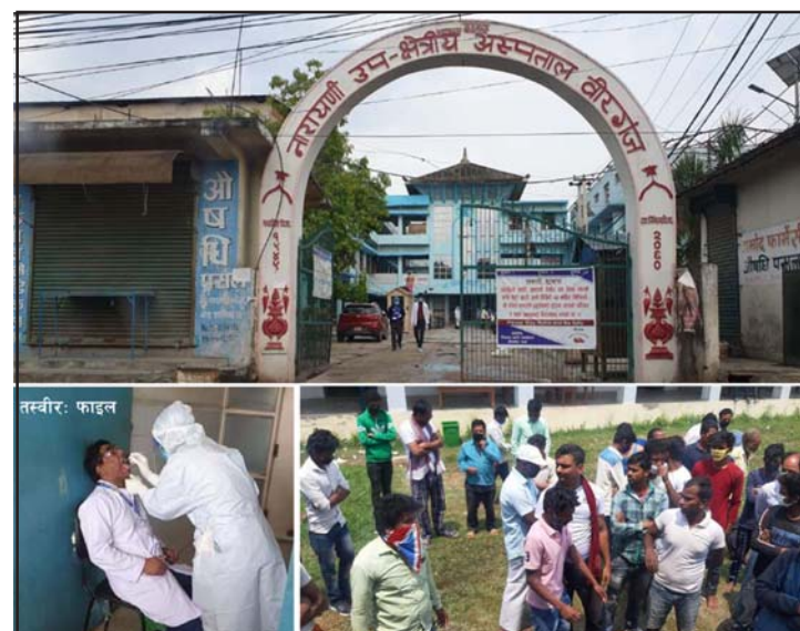
नगरप्रमुख सरावगीले लामो समयपछि वीरगंजमा १४ जनामा कोरोना सङ्क्रमण भेटिएको बताए। उनले

यसैबीच, स्वास्थ्य महाशाखा प्रमुख महतोले विगतमा कोभिड नियन्त्रणमा खटेका सबैजनाको जोखिम भन्ना भुक्तानी भएको दावी गरे। उनले व्यक्तिको नाममा एकाउन्टेपेयी चेक पठाएको र भुक्तानी गर्ने संस्थाले नदिएको भन्दै उनले कसैको नाममा जोखिम भन्ना बाँकी नरहेको बताए।