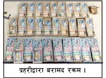
प्रहरीद्वारा बराबद रकम।

क्रममा साहबाट साढे १९ लाख रूपैयाँ बराबद भएपछि निजलाई पर्सा प्रहरीको जिम्मा लगाएको सशस्त्र प्रहरीले जनाएको छ। केही समयदेखि सीमावर्ती क्षेत्रहरूमा स्रोत नखुलेका लाखौं परिमाणका रकम बराबद हुन थालेको छ। प्रहरीले यसरी बराबद हुने रकम अवैध हुण्टीको कारोबारीको भएको दाबी