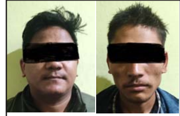
पक्राउ परेका लामा र कार्की

लागि छुटेको बसलाई प्रहरी चौकी परवानीपुरअगाडि चेकिङ गर्दा चितवन