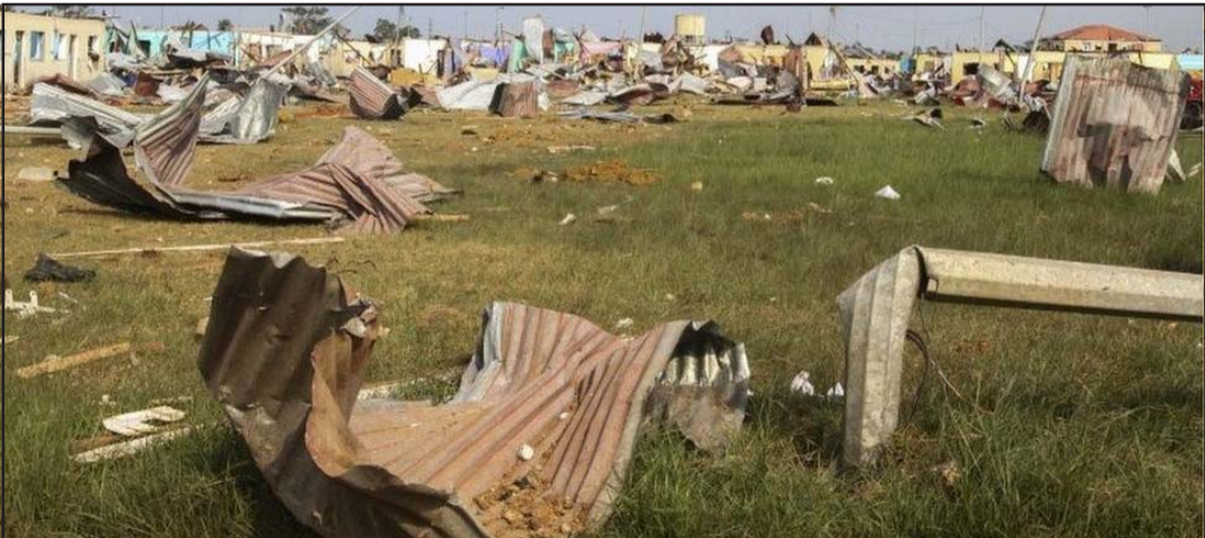
इक्वेटोरियल गिनीको बाटा शहरमा भएको विस्फोटमा क्षतिग्रस्त घरहरू।

सर्वसाधारणलाई रक्तदान गर्न आहवान गरेका थिए। बाटामा रहेको चिनियाँ स्वास्थ्य टोलीले घाइतेको उद्धारमा सहयोग गर्नुका साथै चिकित्सा उपकरण स्थानीय अस्पताललाई उपलब्ध गराएको