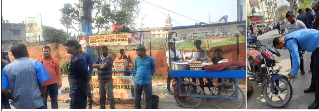
फुटपाथ अतिक्रमणमुक्त गर्दै र जथाभावी पार्किङ गरिएको मोटरसाइकललाई लक गर्दै ।