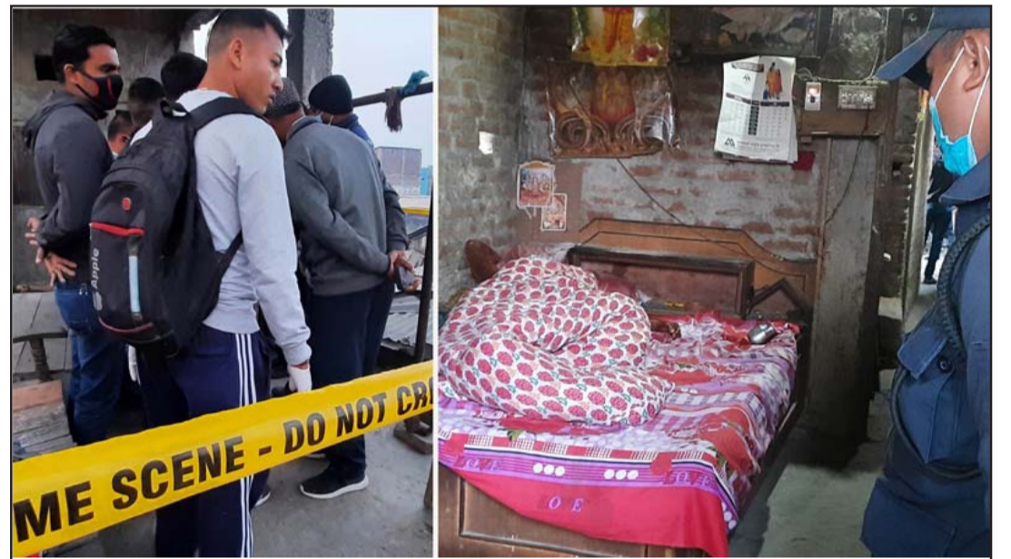
घटनास्थलको अनुसन्धान गर्दै प्रहरी ।