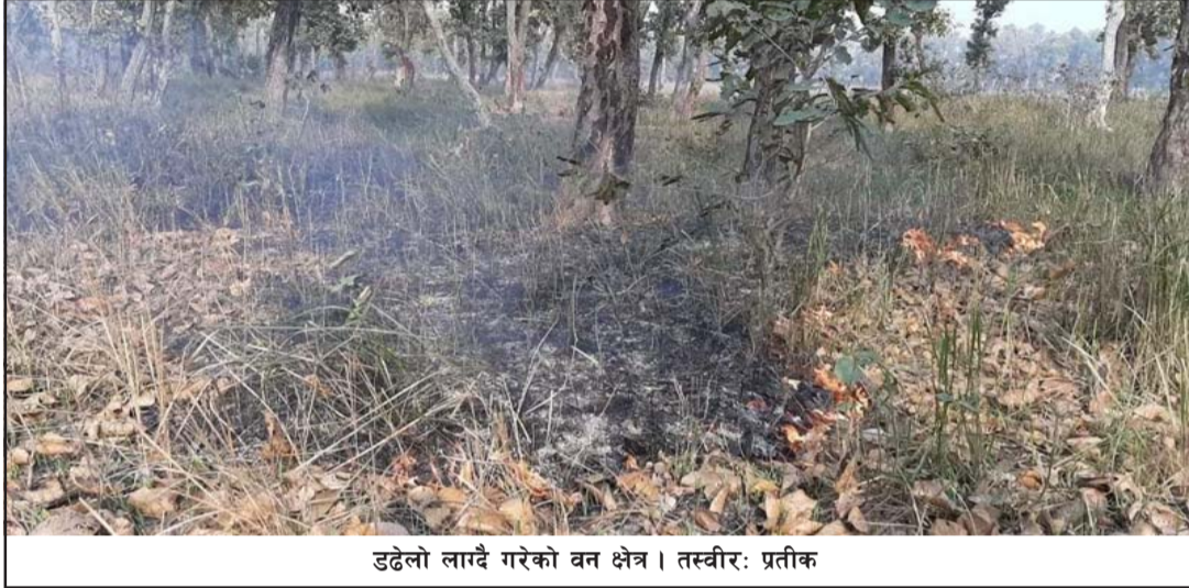
डढेलो लादै गरेको वन क्षेत्र ।

अलि पर जाँदै गर्दा आफूले समाल खोज्दा ती युवकले 'यो मोटरसाइकल मेरो हो' भन्दै झर्केर बोलेपछि आफू पछि हटेर होटलमा आई प्रहरीलाई फोन गर्न लाग्दा ती व्यक्ति भागेको थिडले बताए ।