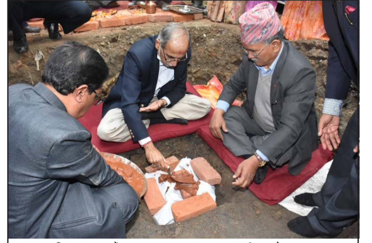
शिलान्यास गर्दै राजदूत क्वात्रालगायत।

२०७२ सालको भूकम्पले क्षति पुऱ्याएको नेपालका ८ जिल्लाका २८ वटा सांस्कृतिक सम्पदामध्ये कुमारी छें र कुमारी निवास विकास र निर्माण दोस्रो चरणको भएको दूतावासले