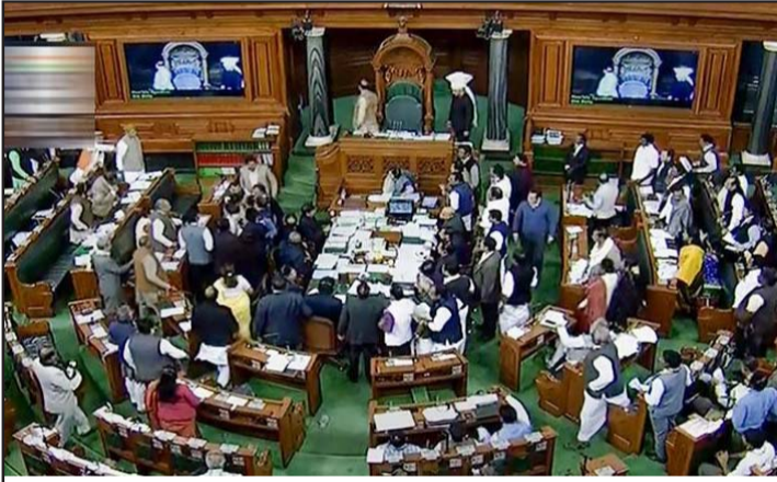
भारतीय संसदमा विवाद चर्किएपछि अवरुद्ध भएको बैठक।

राज्यको विधानसभा चुनावका कारण संसदको सत्रलाई छोट्याउन सक्ने भारतीय सञ्चारमाध्यमहरूद्वारा प्रसारित समाचारमा उल्लेख गरिएको छ। रासस