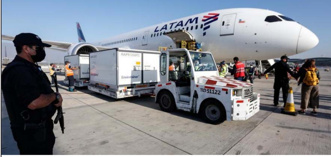
कोभिड-१९ विरुद्धको खोप "कोरोनाभ्याक"को पाँचौं खेप चिली पुगेपछिको दृश्य।

उक्त खोप अभियान समाप्त भएलगत्तै अरु एक करोड ५० लाख व्यक्तिलाई खोप दिइनेछ। दक्षिण अमेरिकी मुलुक चिलीमा