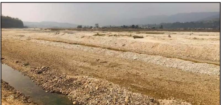
राप्ति नदीको पानीबारे अध्ययन गर्दै टोली।

राप्ती खोलाबाट बाराको दुधौरा खोलासम्म पानी ल्याउन राप्ती-दुधौरा