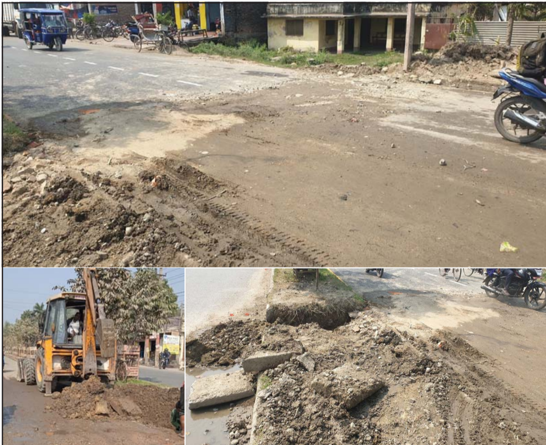
खानेपानी संस्थानले भत्काएको वीरगंज फोरलेन सडक।

प्रस, वीरगंज, २४ फागुन / वीरगंज महानगरपालिकाले निर्माण गरेको घण्टाघर-पावरहाउस सडकखण्ड बनेको एक महीनामै खानेपानी संस्थानले भत्काएको छ। सो सडकखण्डको अर्पणा कम्प्लेक्स अगाडि खानेपानी संस्थानले सडक भत्काएर काम गरेको छ। भर्खरै निर्माण भएको सडकखण्ड भत्काइएपछि सो बाटो भएर आउनमा समस्या भएको छ। घण्टाघर-पावरहाउस फोरलेन सडक