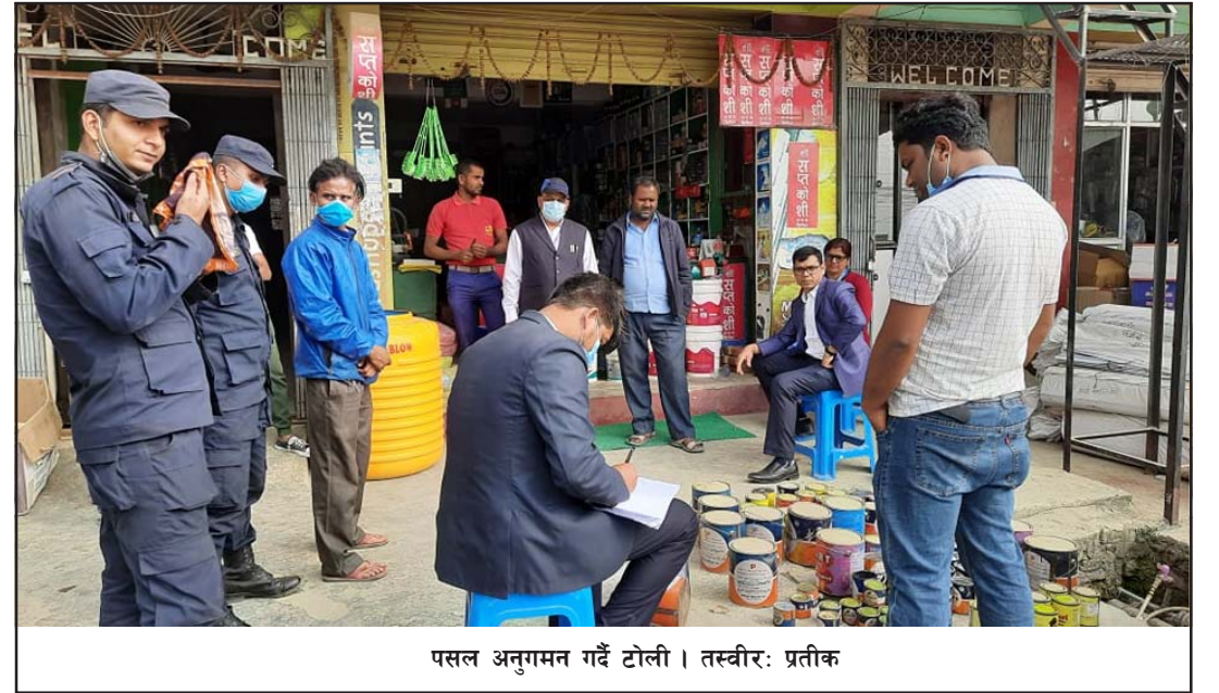
पसल अनुगमन गर्दै टोली।

जनक फौन्सी पसललाई कुल ४ लाख २० हजार तत्काल जरिवाना गरी ७ दिन