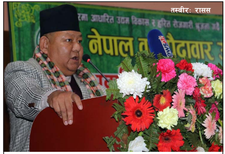
कार्यक्रममा बोल्दै वन तथा वातावरणमन्त्री प्रेमबहादुर आले।

१०औं महाधिवेशन तथा २१औं वार्षिक साधारणसभामा बोल्दै उनले केही दिन