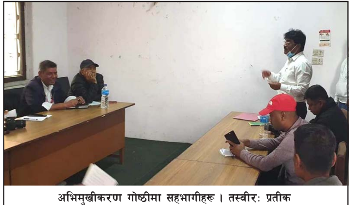
अभिमुखीकरण गोष्ठीमा सहभागीहरू।

हजारजनालाई खोप दिइने उनले बताए। लक्षित वर्ग, ६५ वर्षभन्दा माथिका