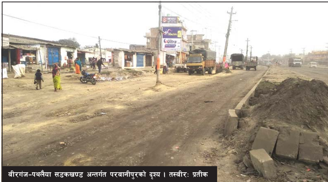
वीरगंज-पथलैया सडकखण्ड अन्तर्गत परवानीपुरको दृश्य।

उनको भनाइ। वीरगंज-पथलैया सडकखण्डमा पप्पु, एमआर कन्टेक,