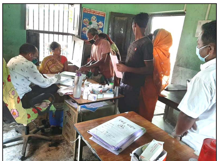
पटेवासुगौली गापाको स्वास्थ्य संस्थामा उपचार गराउँदै बिरामी।

बालबालिका वृद्धवृद्धाहरूले स्वास्थ्यमा ध्यान दिनुपर्ने, खानपिन, सरसफाइ र