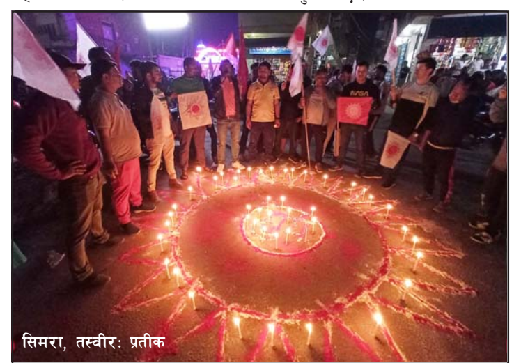
सिमरा