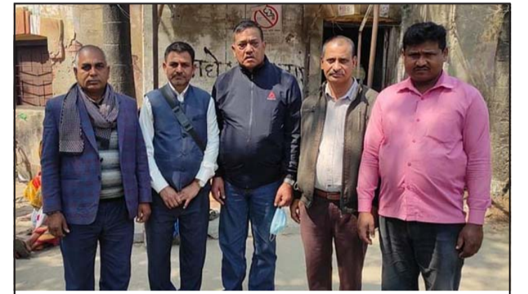
मालपोत कार्यालय, पसांगढी जग्गा नामसारी गर्दै।

बर्वाटौँडी सडकखण्डमा रहेको एक कट्टा जग्गा बुधवार खड्काले पसांगढी