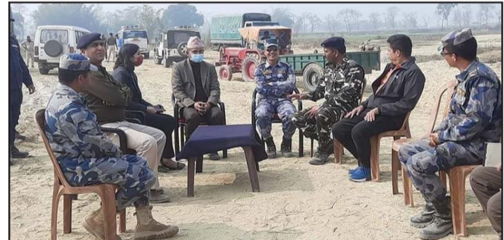
नेपाल-भारतका सरोकारवालाबीचको बैठक।