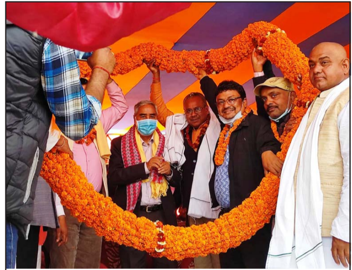
सभापति देउवालाई मालाले स्वागत गर्दै।