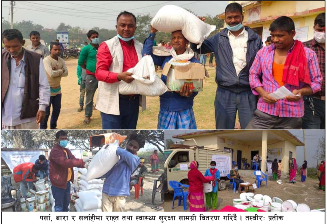
पर्सा, बारा र सर्लाहीमा राहत तथा स्वास्थ्य सुरक्षा सामग्री वितरण गरिँदै ।

६ स्थानमा कार्यक्रम सञ्चालन भएको थियो र त्यहाँ ५५४ जनालाई स्वच्छता