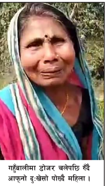
गहुँखेतीमा डोजर चलेपछि हैद आफ्नो दुःखेसो पोख्दै महिला ।