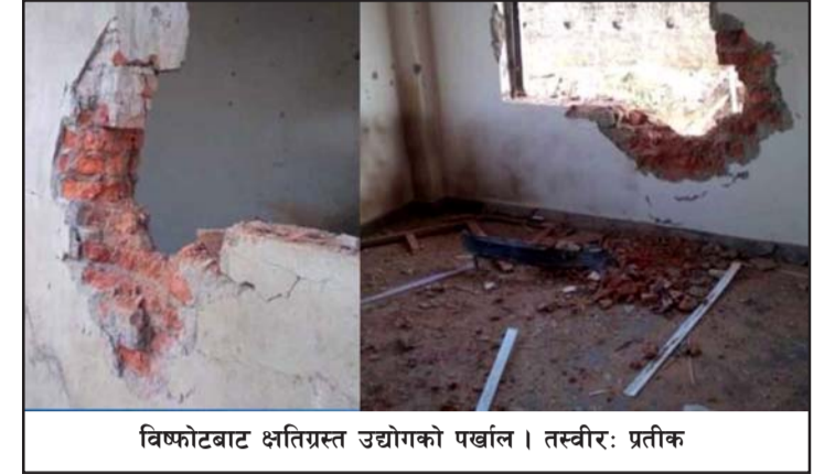
विष्फोटबाट क्षतिग्रस्त उद्योगको पर्खाल।

अस्वीकार गरेपछि विष्फोट भएकोले विप्लव समूहको संलग्नताको आशङ्का गरिएको छ। तर विप्लव समूहले यसको