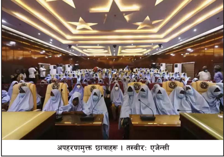
अपहरणमुक्त छात्राहरू।

इन्टरनेशनल क्राइसिस ग्रुपको अर्को अध्ययन अनुसार विद्यालयमा सुरक्षा खतरा रहेको भन्दै यस अफ्रिकी क्षेत्रमै विद्यालय नजाने बालबालिकाको सङ्ख्या विश्वमै सबैभन्दा बढी छ। रासस