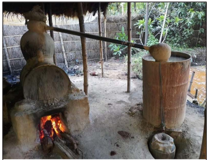
सिम्रौनगढ नगरपालिकामा रहेका एउटा मदिराभट्टी ।

क्षेत्रमा अहिले धमाधम नयाँ मदिराभट्टी सञ्चालनमा आएको बताए । खासगरी भारतमा मदिरा प्रतिबन्ध रहेको र फागु