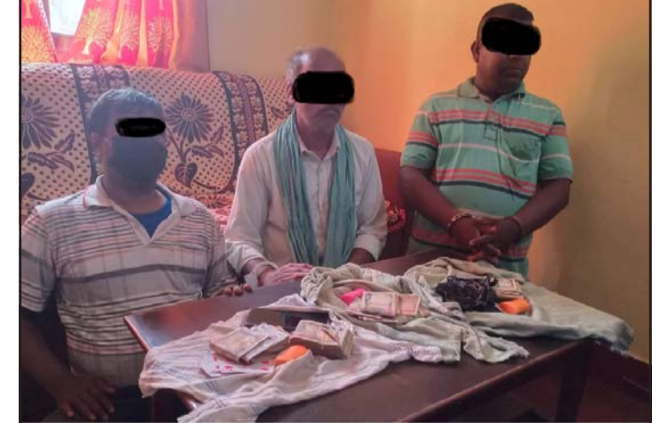
जुवा खेल्दै अवस्थामा छापामारी गर्दै प्रहरी र पक्राउ परेका जुवाडेहरू।