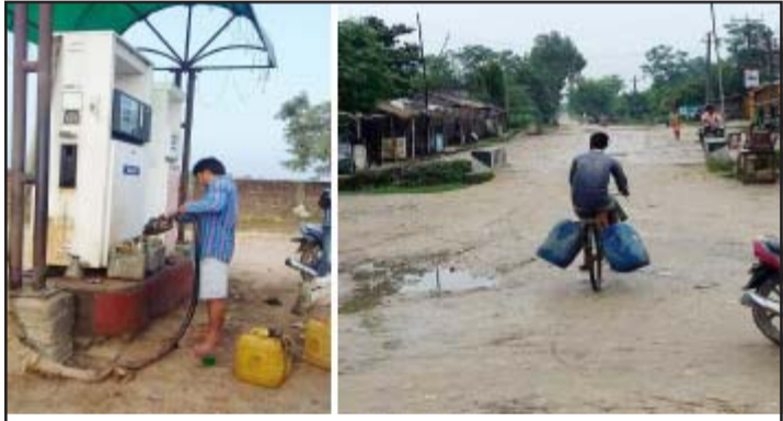
ग्रामीण क्षेत्रको पेट्रोलपम्पबाट इन्धन लैजाँदै तस्करी ।

भिस्वामा सशस्त्र प्रहरीको बोर्डर आउट पोस्ट छन् तर पनि पेट्रोलियम पदार्थको तस्करी निर्बाधरूपमा हुँदैछ ।