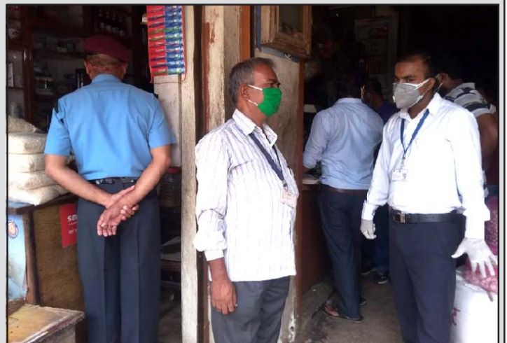
पसलको अनुगमन गर्दै टोली ।

प्रस, वीरगंज, १८ फागुन/ चालू आर्थिक वर्षमा वाणिज्य, आपूर्ति तथा उपभोक्ता संरक्षण कार्यालय वीरगंजले आफ्नो क्षेत्रमा कानूनविपरीत सञ्चालित एक सयवटाभन्दा बढी फर्मलाई कारबाई गरेको छ । यसरी कारबाई गर्दा ३० लाख रुपैयाँभन्दा बढी दण्ड जरिवाना असुल भएको सो कार्यालयले जनाएको छ ।