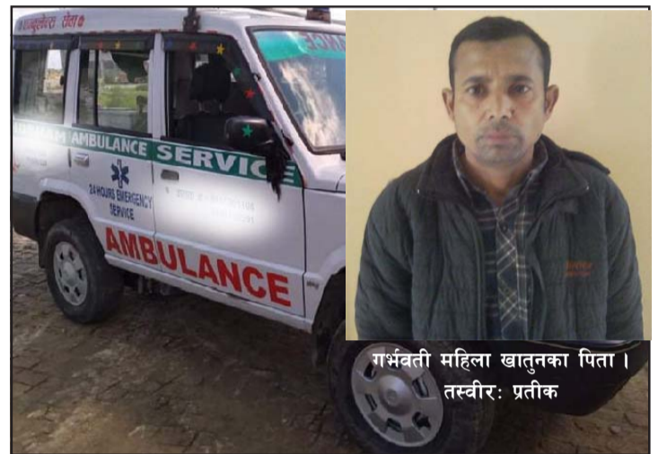
गर्भवती महिला खातुनका पिता।

प्रस, वीरगंज, ११ फागुन/ कोरोनाको समयमा लुकेर बसेका पुऱ्याउने गरेका पाइएको छ। पोखरिया नगरपालिका-६ की