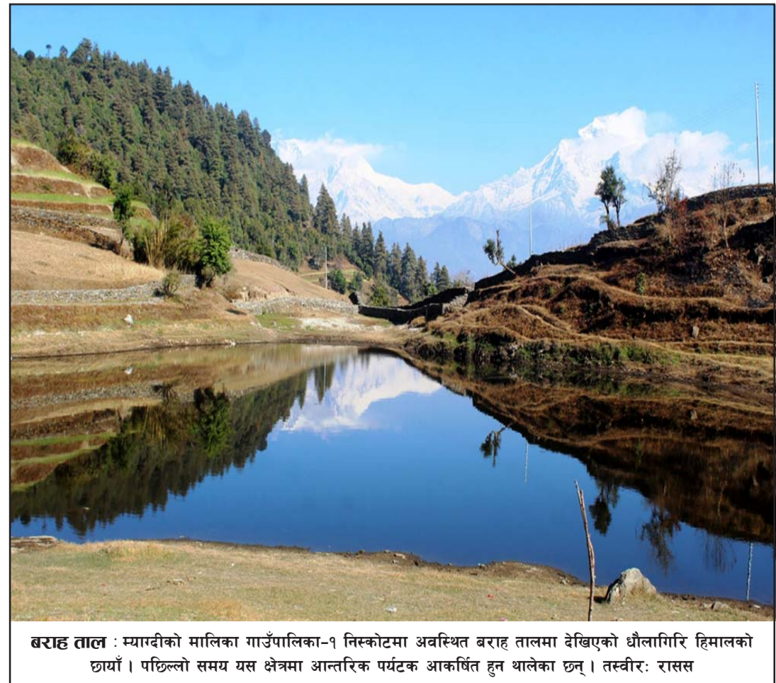
बराह ताल : म्याग्दीको मालिका गाउँपालिका-१ निस्कोटमा अवस्थित बराह तालमा देखिएको धौलागिरि हिमालको छायाँ। पछिल्लो समय यस क्षेत्रमा आन्तरिक पर्यटक आकर्षित हुन थालेका छन्।

आयोजनाको ६० हजार लिटर दूध भण्डारण क्षमता रहेको छ। दही तीन हजार लिटर, घ्यू, मखन, पनीर उत्पादन क्षमता प्रतिदिन ५०० किलो, पेन्समिल्क एक हजार ५०० बोतल प्रतिदिन, पेडा ३६० प्याकेट प्रतिदिन र लालमोहन ९०० प्याकेट प्रतिदिन उत्पादन हुने गरेको उनले जानकारी दिए। बिक्री वितरण क्षेत्रमा तीन वितरक, २८ डिलर र १९७ बिक्री बुथमार्फत बिक्री भइरहेको छ। लकडाउनमा पनि आयोजनाले आफ्नो सेवालालाई निरन्तरता दिएको थियो।