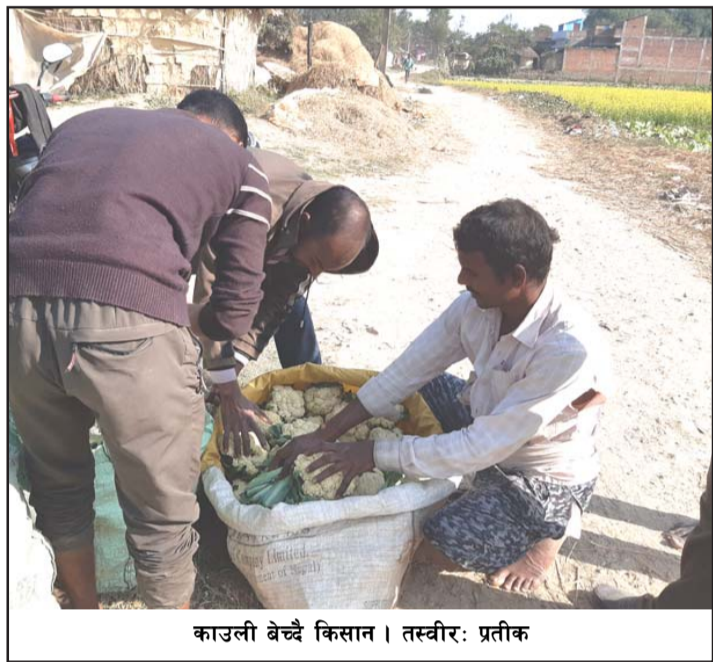
काउली बेच्दै किसान।