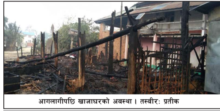
आगलागीपछि खाजाघरको अवस्था।