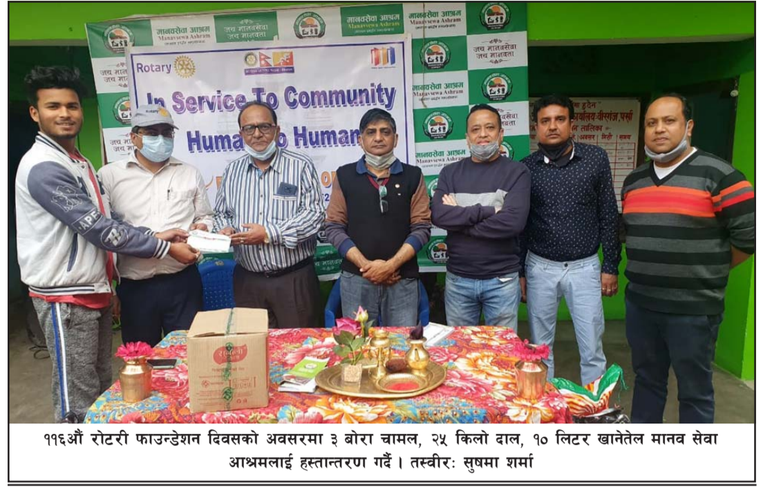
११६औं रोटरी फाउन्डेसन दिवसको अवसरमा ३ बोरा चामल, २५ किलो दाल, १० लिटर खानेतेल मानव सेवा आश्रमलाई हस्तान्तरण गर्दै।

विरुद्धको खोप अभियान शुरू काबुल, ११ फागुन/एएफपी अफगानिस्तानमा मङ्गलवारदेखि कोभिड-१९ विरुद्धको खोप अभियान शुरू भएको छ। भारत सरकारले उपलब्ध गराएको कोभिड-१९ पाँच लाख डोजबाट खोप अभियान शुरू भएको हो। अफगान सरकारका अनुसार उक्त खोप पहिलो चरणमा चिकित्सक, सुरक्षाकर्मी र पत्रकारलाई दिइनेछ। राष्ट्रपति अशरफ घानीले खोप अभियान शुरू गर्दै पहिलो चरणको खोप अभियान शुरू भएको र यो अफगानी जनताका लागि ठूलो अवसर रहेको बताए। अफगानिस्तानमा करिब ५५ हजार ६०० व्यक्ति कोरोना सङ्क्रमित भएका र तीमध्ये दुई हजार ४३० जनाको मृत्यु भएको छ। रासस