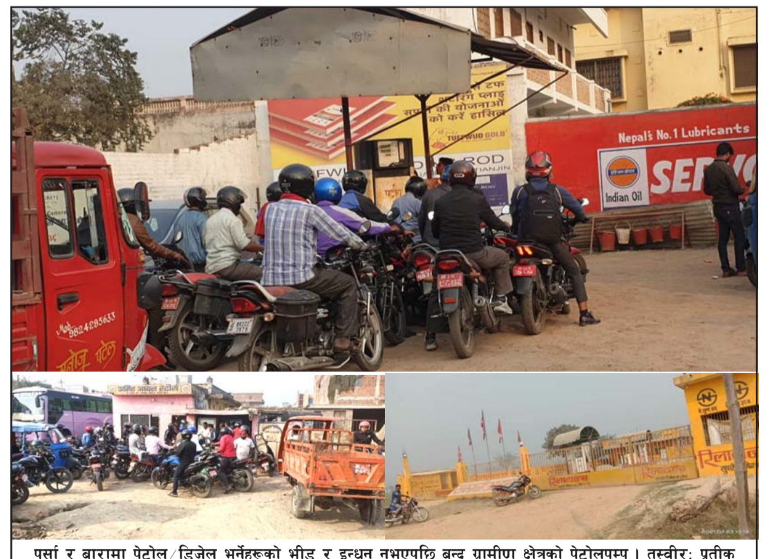
पर्सा र बारामा पेट्रोल/डिजेल भर्नेहरूको भीड र इन्धन नभएपछि बन्द ग्रामीण क्षेत्रको पेट्रोलपम्प।

प्रस, वीरगंज, ११ फागुन/ पर्सा जिल्लाबाट पेट्रोलियम पदार्थको तस्करि बढेको छ। भारतमा पेट्रोलियम पदार्थको मूल्य नेपालको तुलनामा निकै महँगो भएको कारण सीमावर्ती भारतीय क्षेत्रमा अहिले पर्साबाट दिनहुँ पेट्रोल, डिजेलको तस्करि भइरहेको छ। विगत केही महिनादेखि पर्सा जिल्लाका जानकीटोला, भिस्वा, दसौता, पाँडेपुर, महादेवपट्टि, सुवर्णापुर,