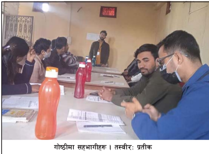
गोष्ठीमा सहभागीहरू।

एचआइभी सङ्क्रमित फेला परेको जानकारी गराएका थिए।