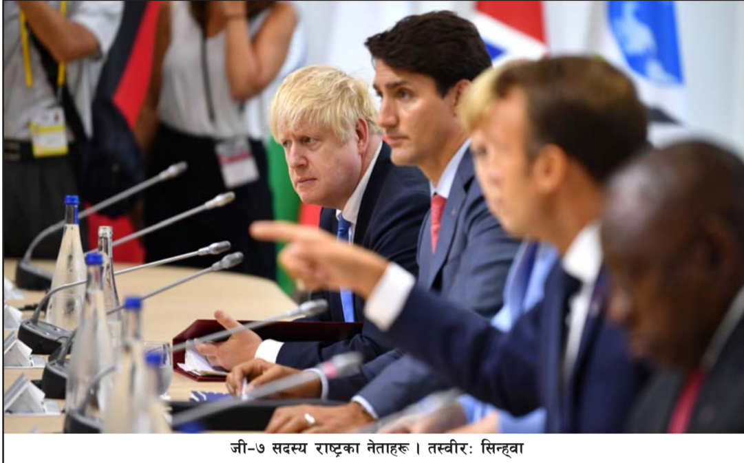
जी-७ सदस्य राष्ट्रका नेताहरू ।

हाल विश्वमा कोरोना भाइरसको खोप वितरण भइरहेको र त्यस खोप