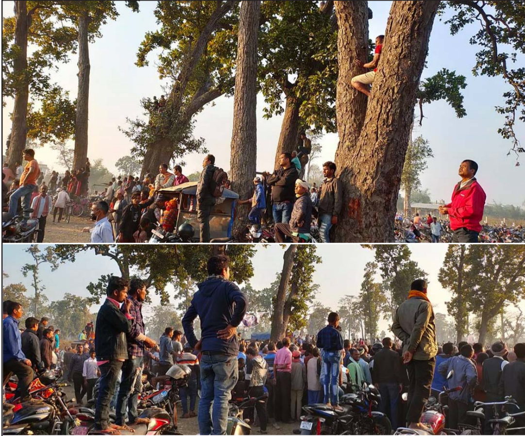
खेलप्रति मोह : बडनिहारमा आयोजित तेस्रो पर्सगढी गोल्डकप फुटबल प्रतियोगिताको फाइनल खेल हेर्न जोखिम मोलेर रूख तथा मोटरसाइकल र साइकलमा उभिएर खेलको आनन्द लिँदै दर्शक ।