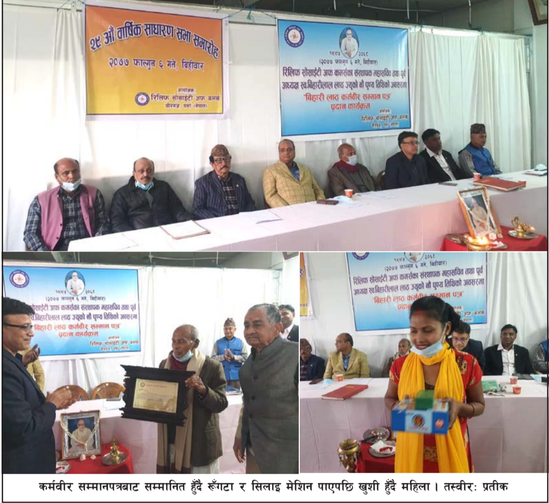
कर्मवीर सम्मानपत्रबाट सम्मानित हुँदै रूंगटा र सिलाइ मेशिन पाएपछि खुशी हुँदै महिला ।

निर्माण ४६ प्रतिशत मात्र काम भएकोले ती दुई निर्माण कम्पनीलाई कारबाई शुरू गरिएको सूचना अधिकारी दासले बताए । सो सडकखण्ड असोज २२ र माघ २८ गतेसम्म निर्माण गर्ने सम्झौता गरेका ठेकेदार कम्पनीले काम पूरा नगरेपछि कारबाई प्रक्रिया अगाडि बढाइएको उनले बताए । वीरगंज-पथलैया ६ लेन सडक निर्माणको भौतिक प्रगति ७२ प्रतिशत छ र निर्धारित समयमा निर्माण सम्पन्न नहुने प्राविधिकहरूले बताएका छन् । कारबाईमा पर्ने ठेकेदार कम्पनीमा १ नं खण्डको एएमआर/पप्पु/कन्टेक जेभी र ५ नं खण्डको शर्मा युनाइटेड बिल्डर्स दिवा निर्माण सेवा रहेको सूचना अधिकारी दासले बताए ।