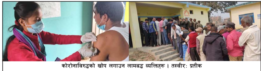
कोरोनाविरुद्धको खोप लगाउन लामबद्ध व्यक्तिहरू।