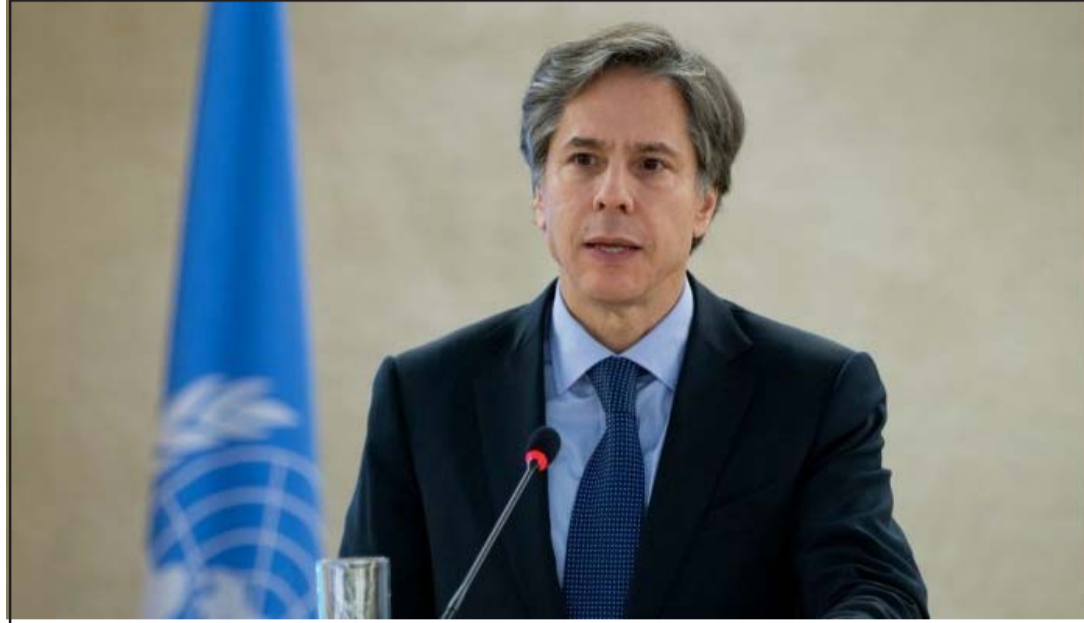
अमेरिकाका विदेशमन्त्री एन्टोनी ब्लिन्केन ।

गत वर्ष मात्र अमेरिकी राष्ट्रपति ट्रम्पले विश्व स्वास्थ्य सङ्गठनलाई दिएको सहयोग रोकने मात्र नभएर सो सङ्गठनबाट