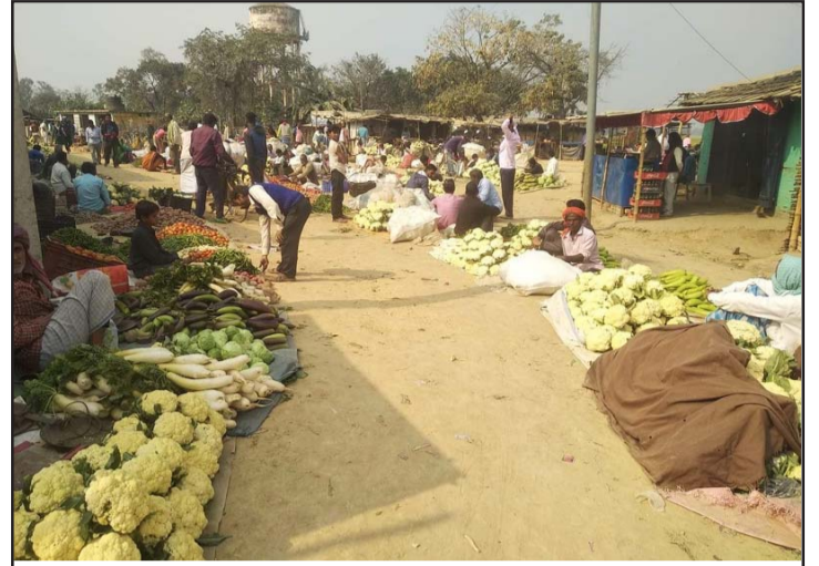
हरियो तरकारी सस्तो भएपछि ग्रामीण भेगको पोखरिया बजारमा बिक्री वितरण गर्नका लागि राखिएका तरकारी।

नेताको लिंग सङ्कमा जाने काम अब बन्द गर्नुपर्छ। हडताल, चक्काजाम, बन्द, जुलूस, प्रदर्शन समाप्त गर्नुपर्छ। देशको आर्थिक विकासको लागि यस्तो हुनु आवश्यक छ। होइन, नेताहरूको स्वार्थका लागि हामी जुलूस प्रदर्शनमा सरिक भइरहने हो भने हाम्रो मुलुक पनि अफगानिस्तान वा यमन वा सोमालिया बन्न सक्छ। नेताहरूको अहमले देश बिगारेको प्रशस्त उदाहरण छन्।