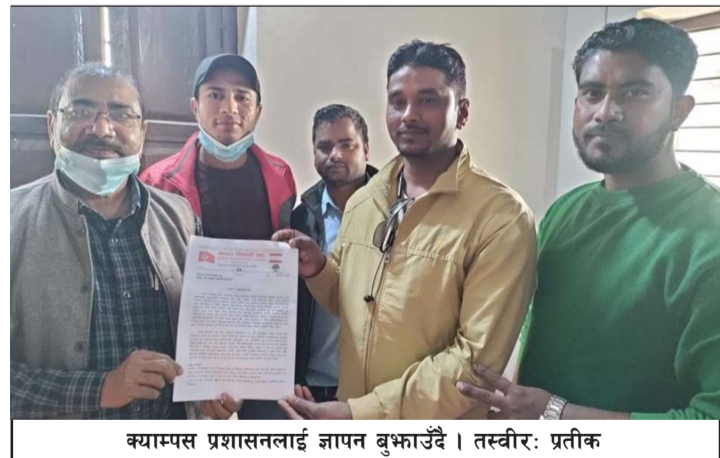
क्याम्पस प्रशासनलाई ज्ञापन बुझाउँदै ।

हुन् । पूर्व सहमति अनुसार दोहोरो नियुक्ति