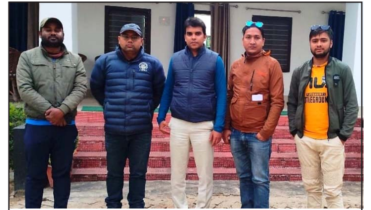
बाघको खोजी गर्न वाल्मीकि व्याघ्र परियोजना पुगेको नेपाली टोली ।

अन्सारीले स्थानीय पालिकाभित्र पर्ने खोलाको हकमा सम्बन्धित पालिकाले पहिले अनुगमन गरी प्रतिवेदन तयार गरे पनि जिल्लास्थित जिल्ला समन्वय समितिको नेतृत्वमा विज्ञहरूको टोलीले अनुगमन गरी प्रतिवेदनलाई स्वीकृति दिएपछि खोलाको टेन्डर प्रक्रिया अघि बढ्ने नियम रहेको छ । चारवटा खोलाको ठेक्का लाग्न नसक्दा स्थानीय पालिकाको वार्षिक करोडौं रूपैयाँ राजस्व गुमिरहेको छ ।