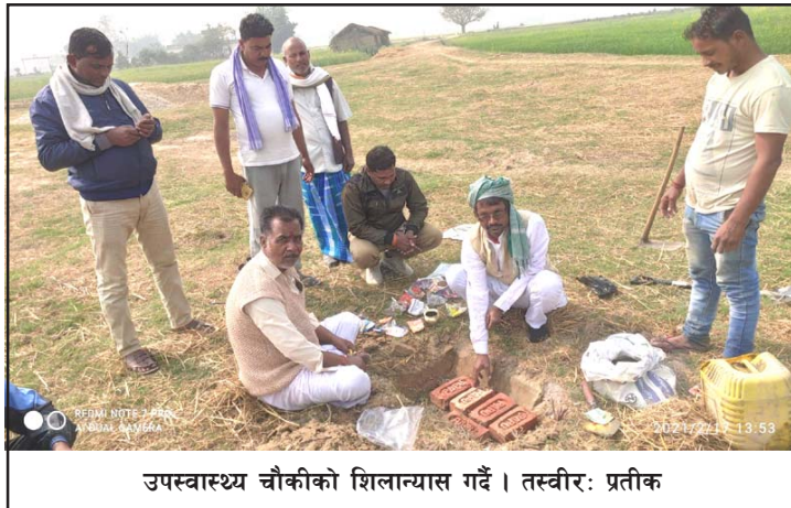
उपस्वास्थ्य चौकीको शिलान्यास गर्दै ।