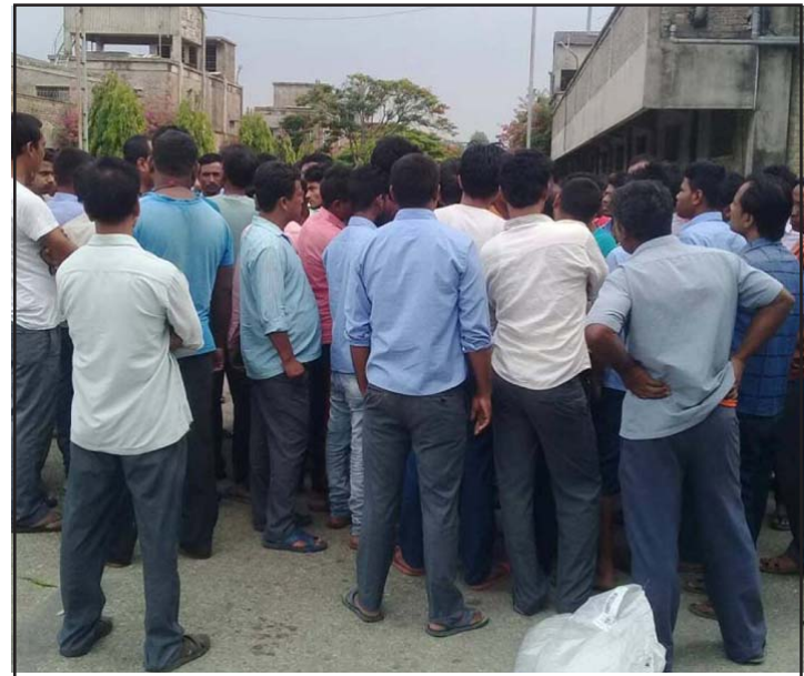
त्रिवेणी स्पिनिड मिलका आन्दोलनरत मजदूरहरू।

त्रिवेणी स्पिनिडले दैनिक ३० टन धागो उत्पादन गरी भारत र टर्कीमा निर्यात गर्दै आएको छ। त्रिवेणी समूहको त्रिवेणी टेक्सटाइल्स यसअघि बन्द भइसकेको छ।