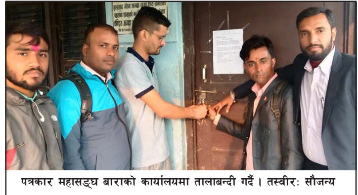
पत्रकार महासङ्घ बारामाको कार्यालयमा तालाबन्दी गर्दै।

तालाबन्दी गरेका हुन्। बारामा दुई दर्जन सङ्ख्याका