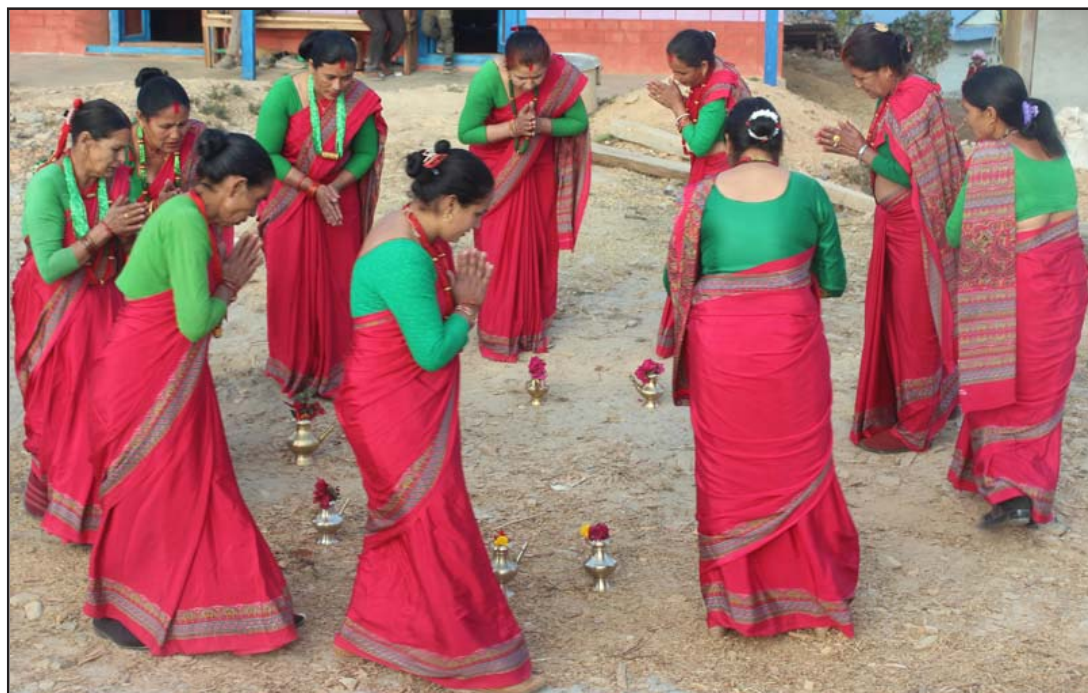
सङ्गिनी नाच प्रस्तुत गर्दै महिला: सङ्गिनी नाच प्रस्तुत गर्दै खोटाङको रावाबेंसी गाउँपालिका-४ डुम्रेधारापानीका महिला। छवटा बडा रहेको रावाबेंसी गाउँपालिकाले हरेक जातजातिको संस्कार/संस्कृति संरक्षण गर्न नीति तथा कार्यक्रम नै पारित गरेर अभियान थालेको छ।

जिल्ला प्रहरी कार्यालय बागलुङले सोमवार उक्त सङ्गठित ठगीको घटनाका आरोपितलाई सार्वजनिक गरेको छ। पक्राउ पर्नेमा तनहुँको देवघाट