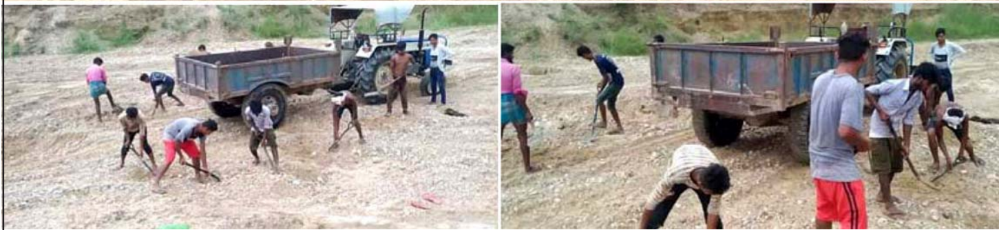
वीरगंज महानगर-३१ स्थित भेडाहा खोलामा बालुवा, ग्रेभल उत्खनन गर्दै ।