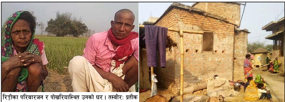
रिङ्गीको परिवारजन र पोखरियास्थित उनको घर ।

उनको मृत्युमा निजको प्रेमी, घरपरिवार अथवा स्वयम् उनकै संलग्नता छ कि