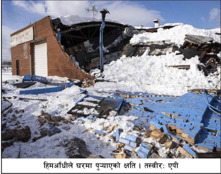
हिमआँधीले घरमा पुऱ्याएको क्षति।

वाशिंगटन, ५ फागुन/सिन्हावा संयुक्त राज्य अमेरिकामा केही दिनदेखिको हिमआँधीमा परेर कम्तीमा २० जनाको मृत्यु भएको स्थानीय सञ्चारमाध्यमहरूले बताएका छन्।